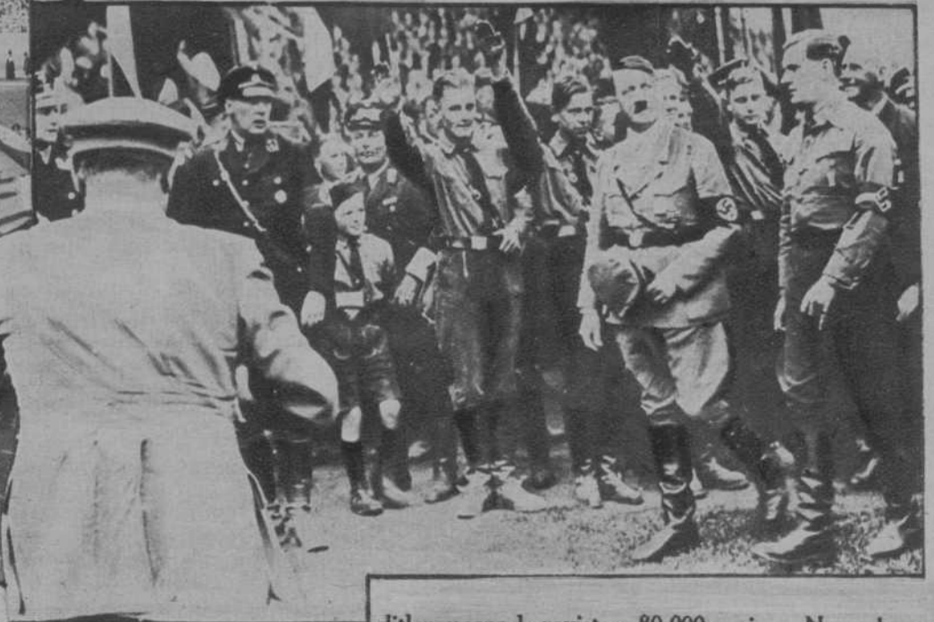
Hitler, pasando revista a 80.000 nazis en Nuremberg