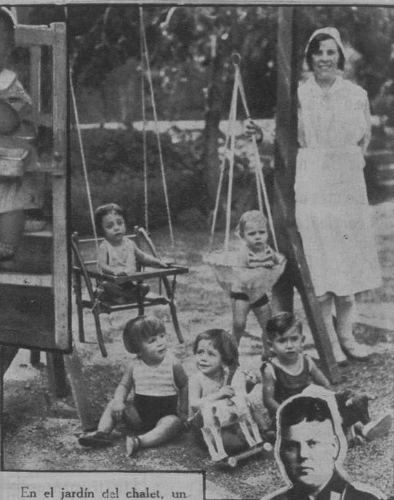
En el jardín del chalet, un grupo de niños de uno a dos años

Concesionario : GROLLER Plaza Letamendi, 3, Barcelona