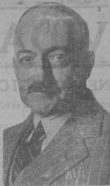
Céspedes, o en Cuba sí que pasa algo

La nueva revolución cubana, a pesar de las noticias contradictorias parece tener una significación evidentemente opuesta a la blandura y al "aquí no ha pasado nada". El El Gobierno Céspedes, se se formó de una manera provisional al derrocar el pueblo la sangrienta dictadura de Machado, mantuvo en sus puestos de mando a la mayor parte de los jefes militares adictos a la política de aquél.