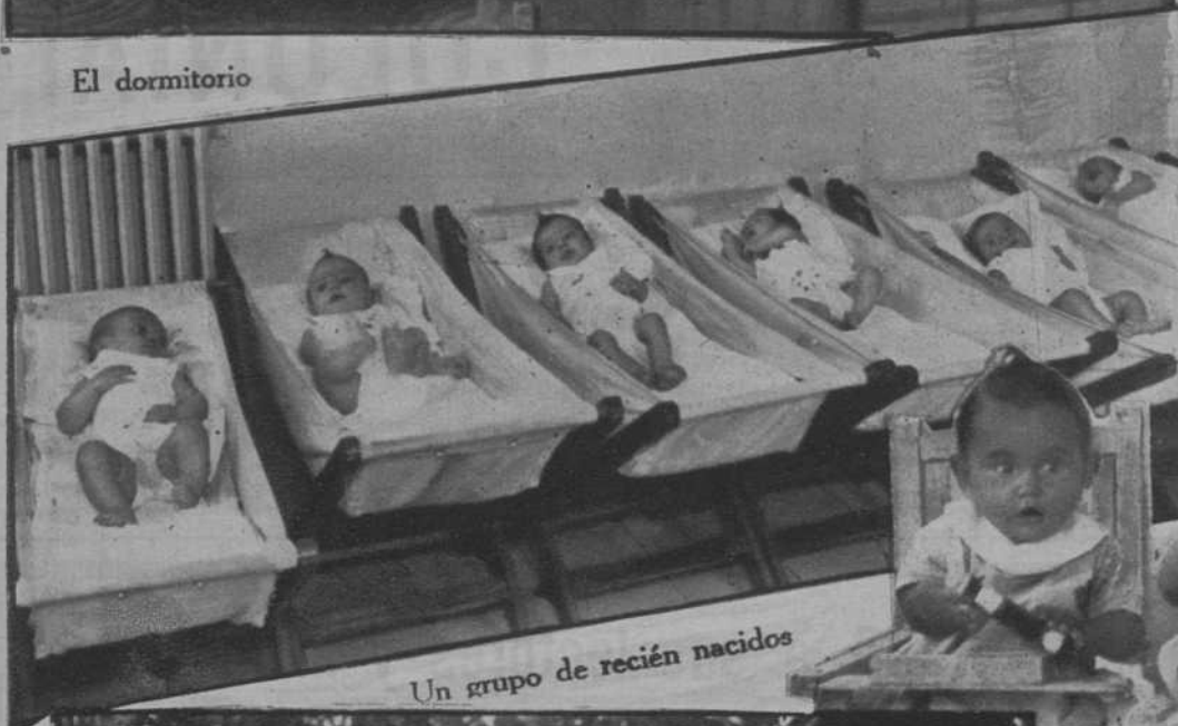
Un grupo de recién nacidos