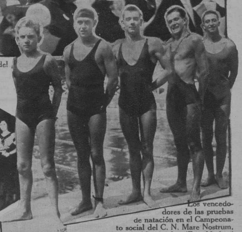
Los vencedores de las pruebas de natación en el Campeonato social del C. N. Mare Nostrum, en la piscina de Montiuich.