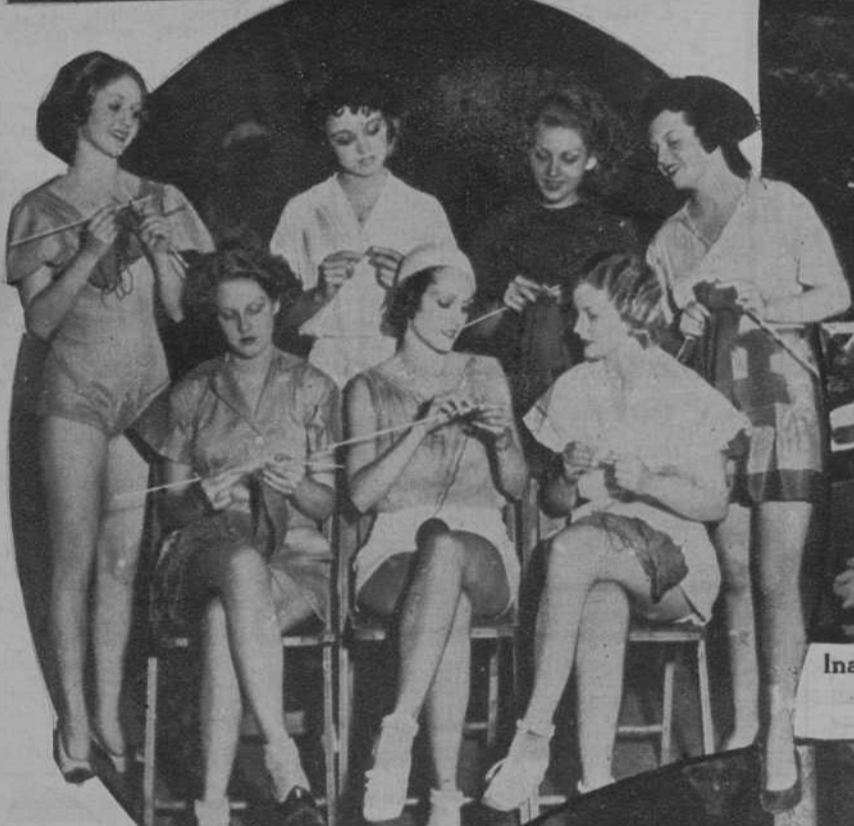
Grupo de girls de un estudio de Hollywood, en un descanso trabajan como muchachas caseras.