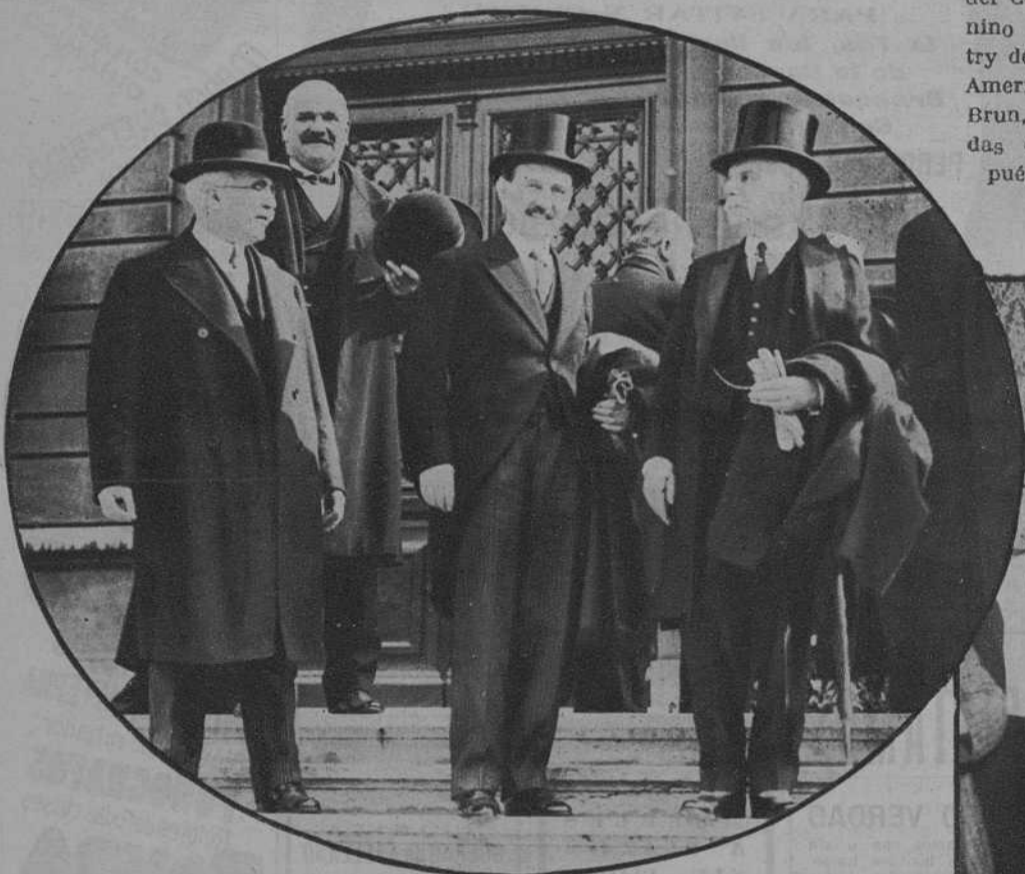
Lyon.—Los ministros Godart y Chautemps, el embajador inglés, Lord Tyrrell, y el embajador español, señor Madariaga.