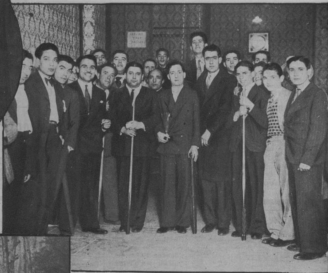
Campeonato social de hillar en el bar «La Violeta»