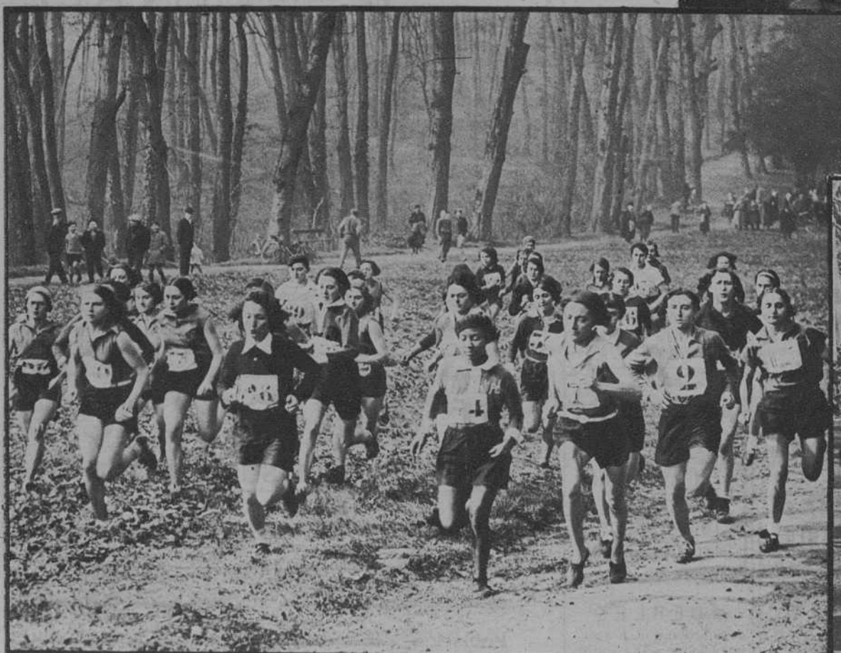
Las participantes en el Cross-Country femenino de Francia.