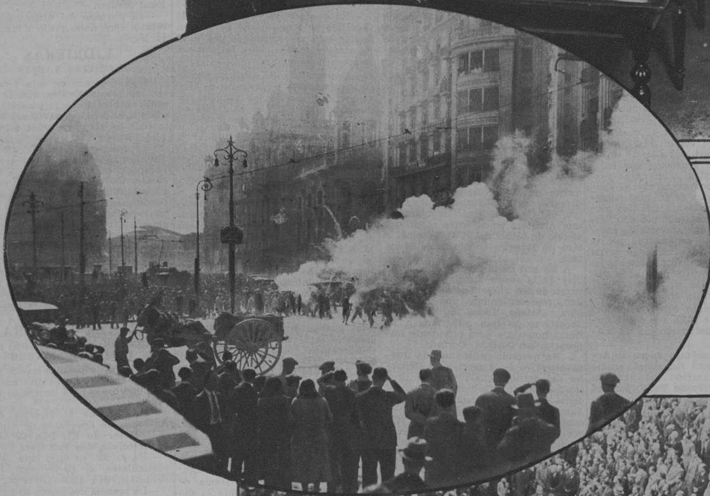
Valencia.—Una de las fallas quemadas con motivo de la semana fallera.