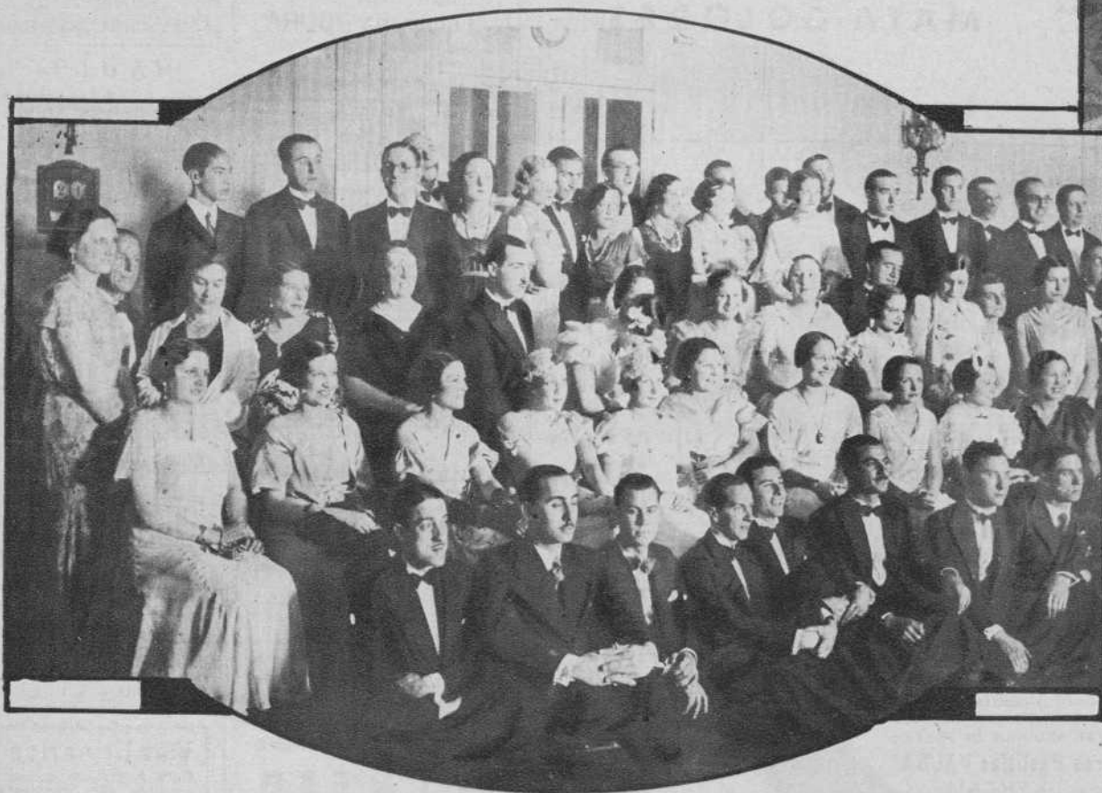
Festival organizado por la Colonia de Horta en el Ritz.