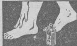
NO IRRITA NI CAUSA LA MENOR MOLESTIA

Dolores reumáticos, ciático, lumbago, resfriados, contusiones, torticolis, torceduras, toda clase de dolores musculares, desaparecen aplicando suavemente, sin frotar, el Linimento de Sloan.