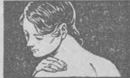
ALIVIA EL DOLOR DE TERCERAS Y DISLOCACIONES