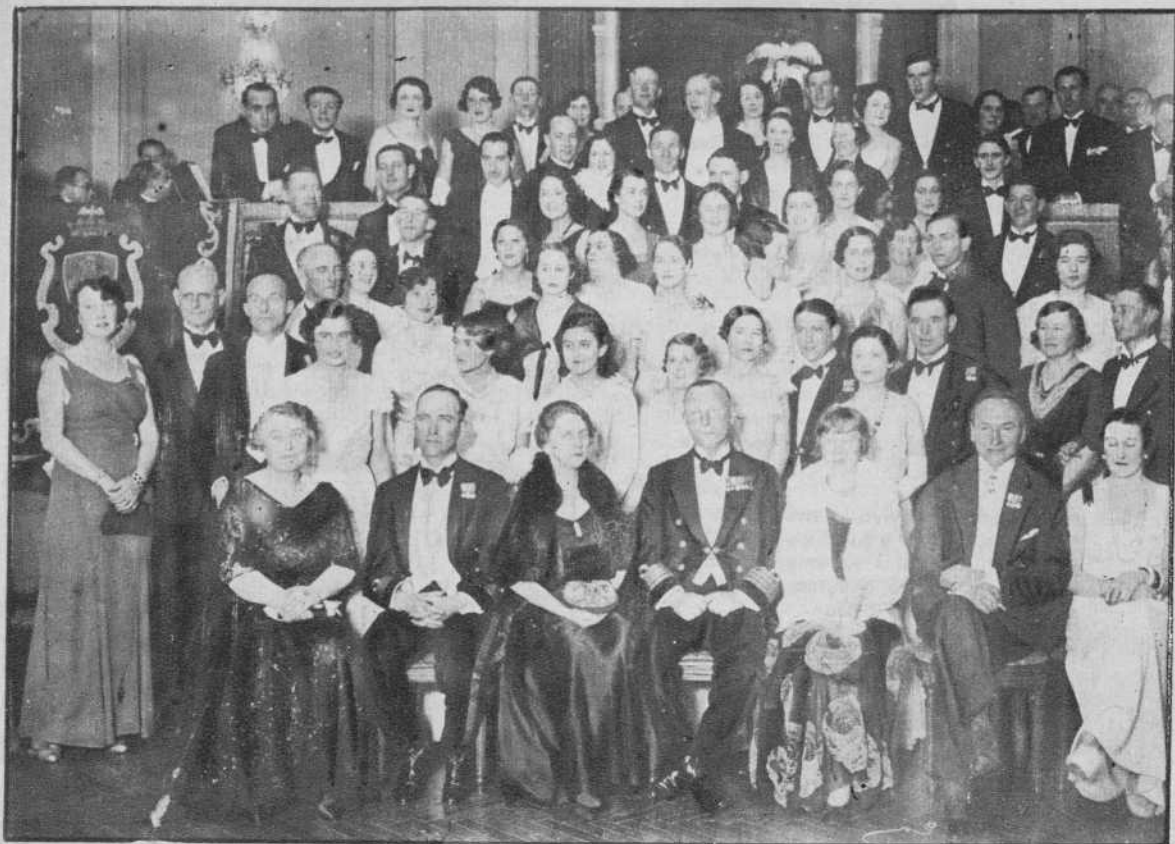
La fiesta celebrada en el Ritz en honor de la oficialidad de la división naval Británica.