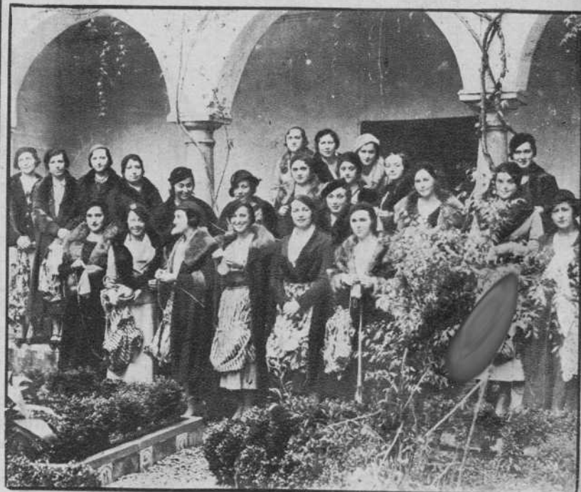
Córdoba. — Señoritas confeccionando ropas para familias necesitadas.