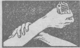
APLIQUESE SUAVEMENTE PENETRA SIN FROTAR

hay muchos remedios. Son todos ellos eficaces? El mejor remedio es aquel que ha probado su mérito durante cincuenta años. Y ese es el Linimento de Sloan. Productos nuevos, anunciados a bombo y platillo, han venido y han desaparecido, pero el Linimento de Sloan continúa siendo el verdadero "mata dolores".