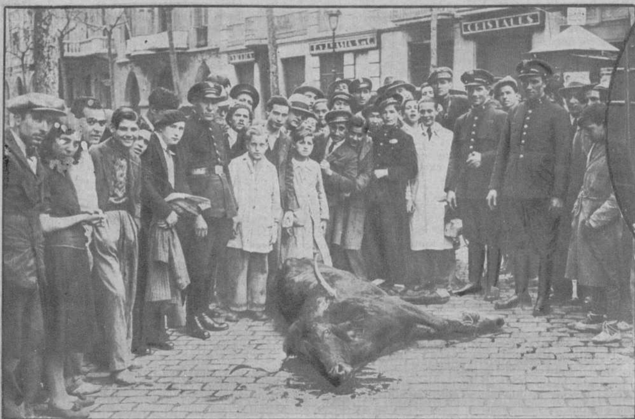
La ternera desmandada, muerta en el cruce de la calle Diputación y Rambla de Cataluña.