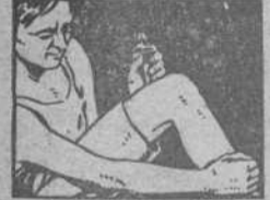
LINIMENTO DE SLOAN PENETRA SIN FROTAR