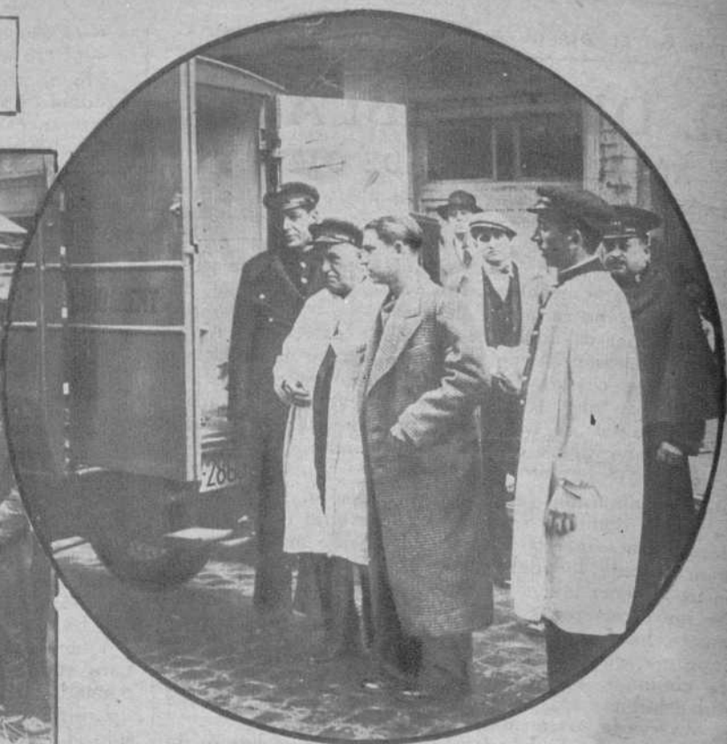
Don Juan Belmonte, herido en un pie a causa de los disparos hechos para matar a una ternera desmandada en la calle de la Diputación.