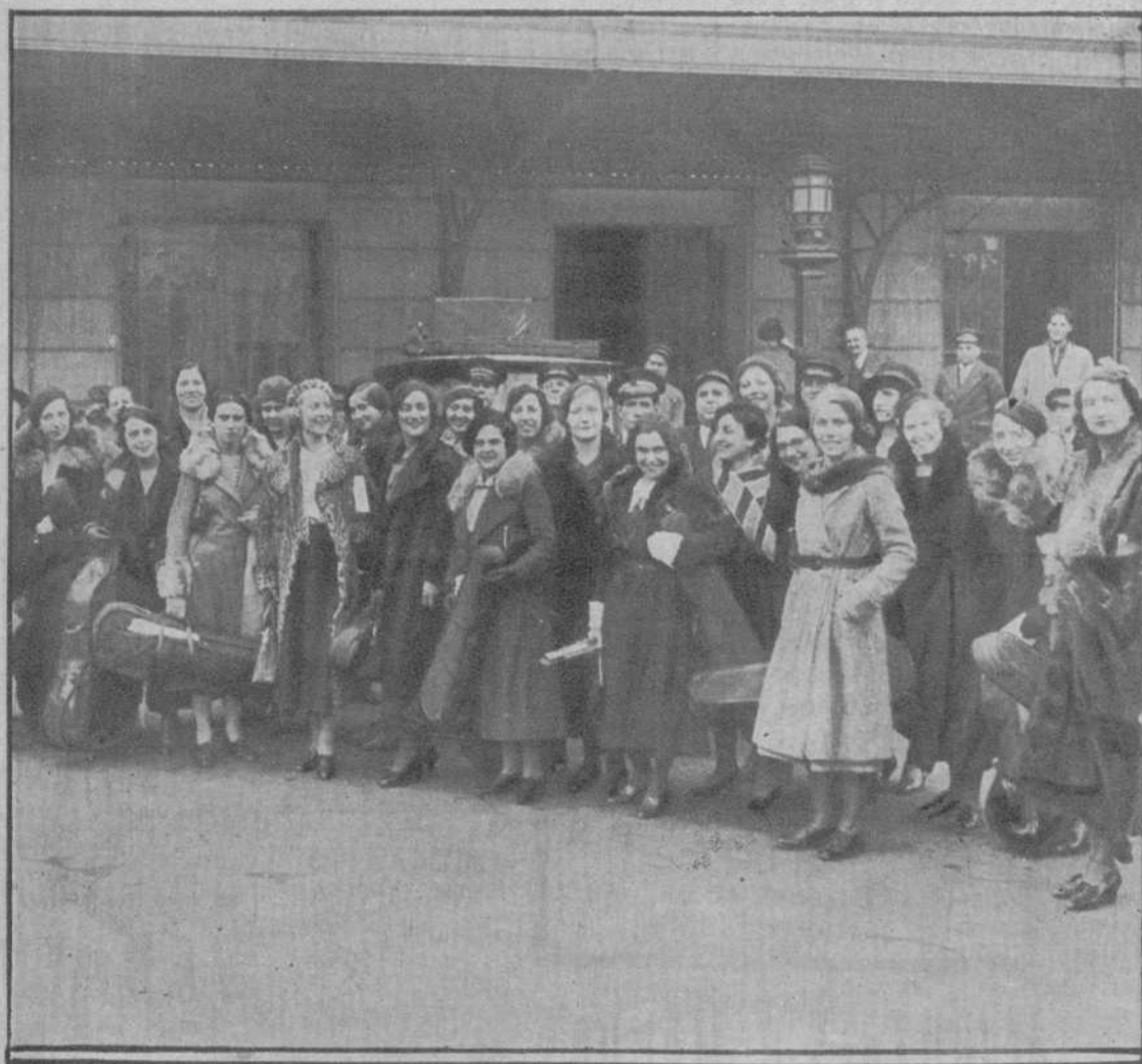
Las señoritas que integran la Orquesta Femenina de París, llegadas ayer, al salir de la estación