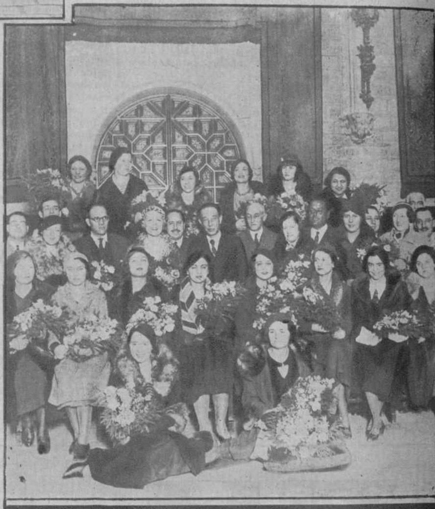
La Orquesta Femenina de París, en el Ayuntamiento, con el alcalde.