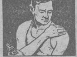
DESCONGESTIONA Y PRODUCE BIENESTAR