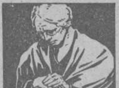
CALIENTA COMO LOS RAYOS DEL SOL