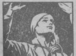
EVITA RESFRIADOS Y ENFRIAMIENTOS

JOYAS de ocasión Compra oro, plata, diamante, brillantes, perlas. Pagamos su valor. ZAMBRA FLORES 8, Joyería Núñez ALBAÑIL se ofrece. Esc. DIA GRAFICO núm. 127