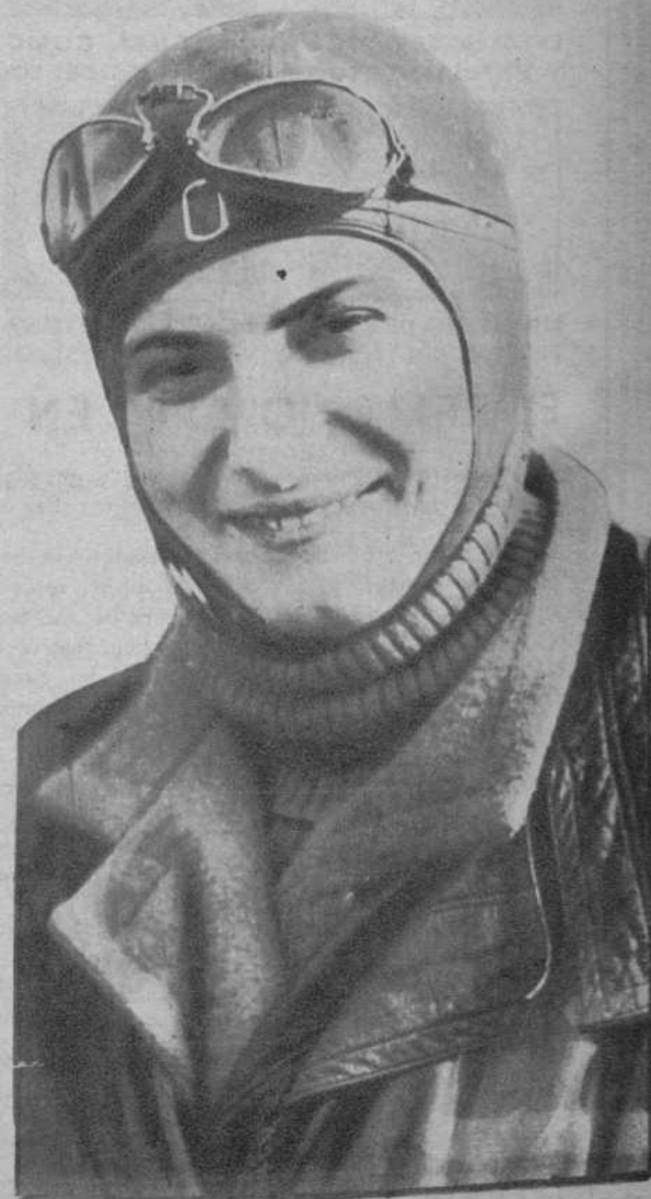
La aviadora francesa Elena Boucher, que realiza el raid París-Saigon.