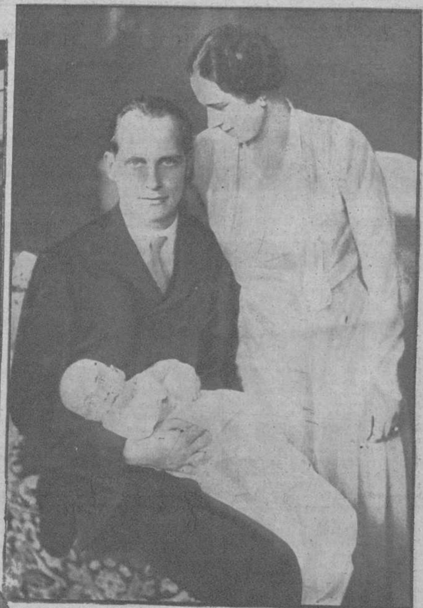
El archiduque Antonio de Habsburgo, con su mujer, la princesa Elena de Rumanía, y su heredero.