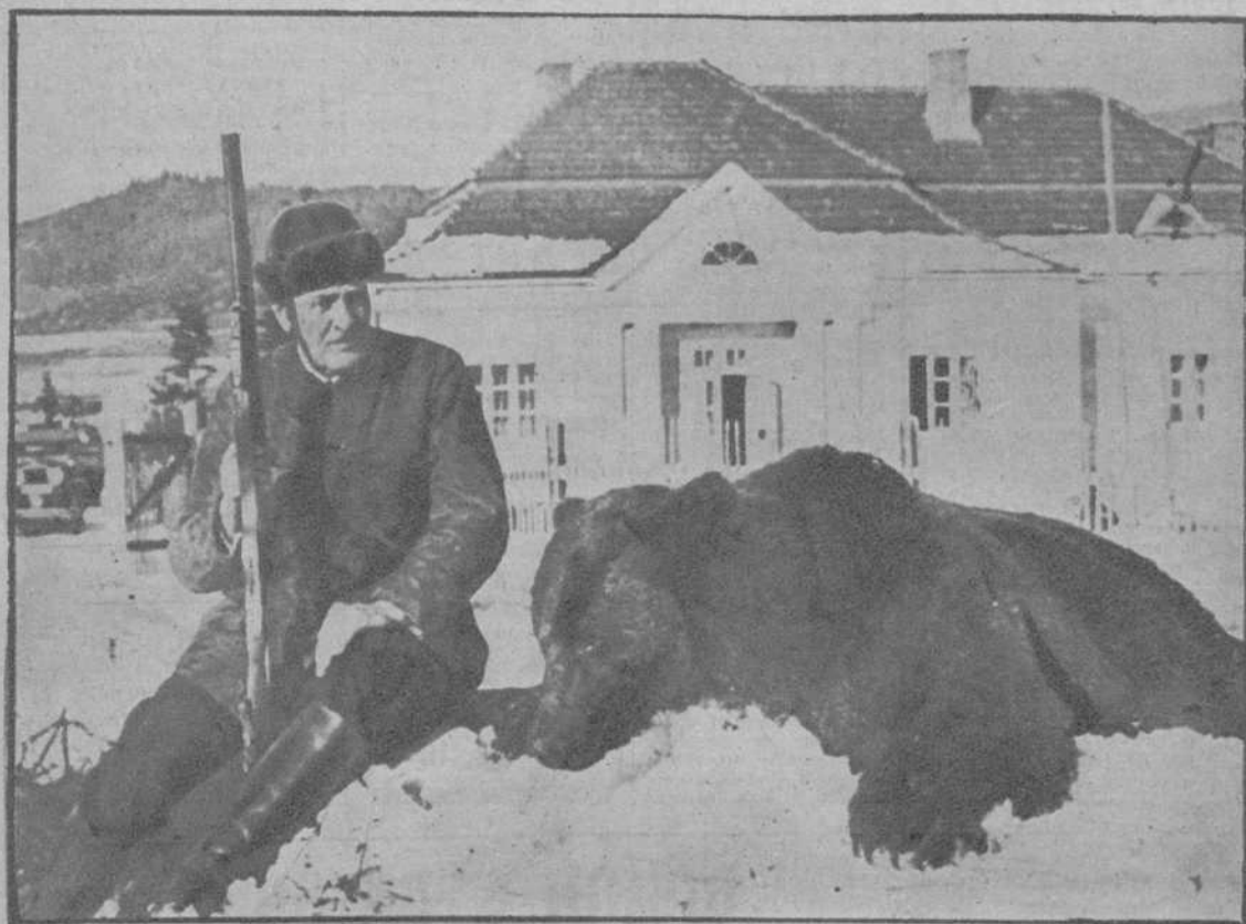
El Presidente de la República de Polonia, al lado de uno de los osos que ha cazado