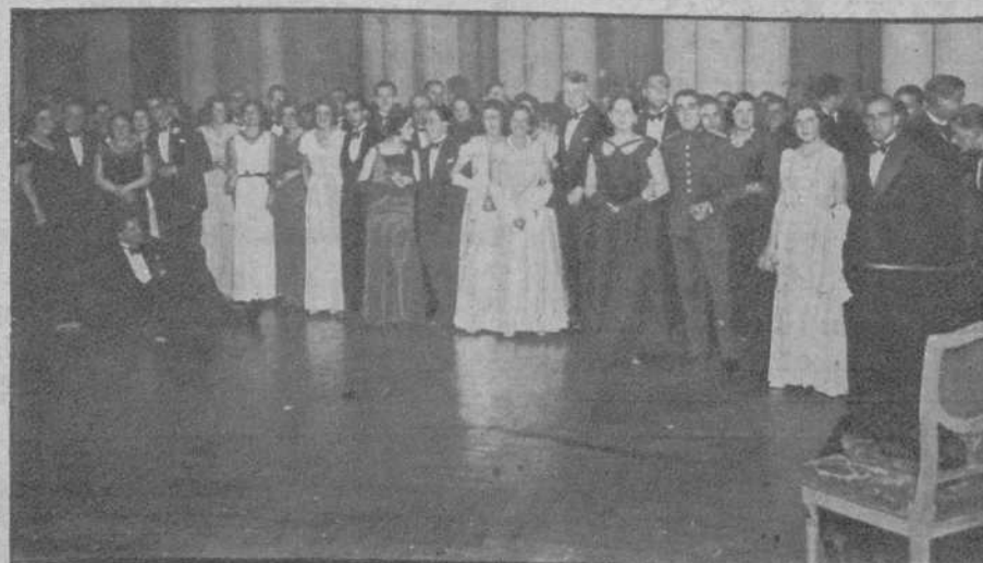
Vigo.—Un grupo de asistentes al baile de fin de año, celebrado en el Casino.