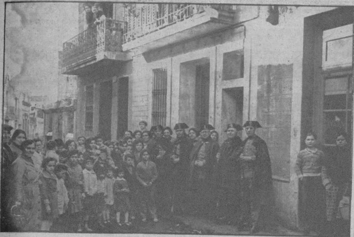
Barcelona.—Hallazgo de un depósito de bombas en la calle del Milagro, de la barriada de Sans