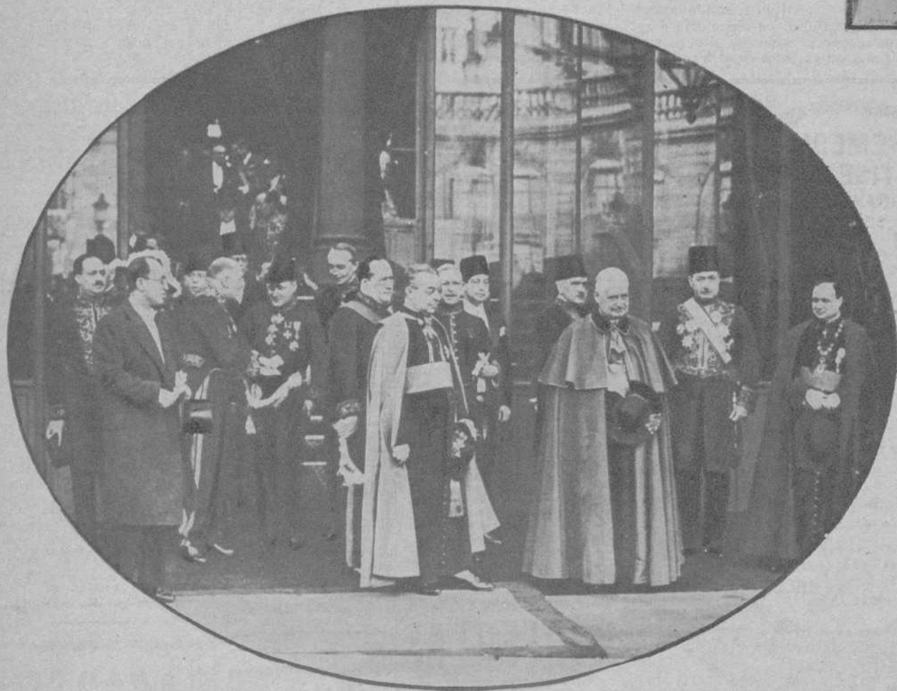
Paris.—Grupo de diplomáticos, al salir de la recepción celebrada en el Palacio del Elíseo, con motivo del Primero de Año.