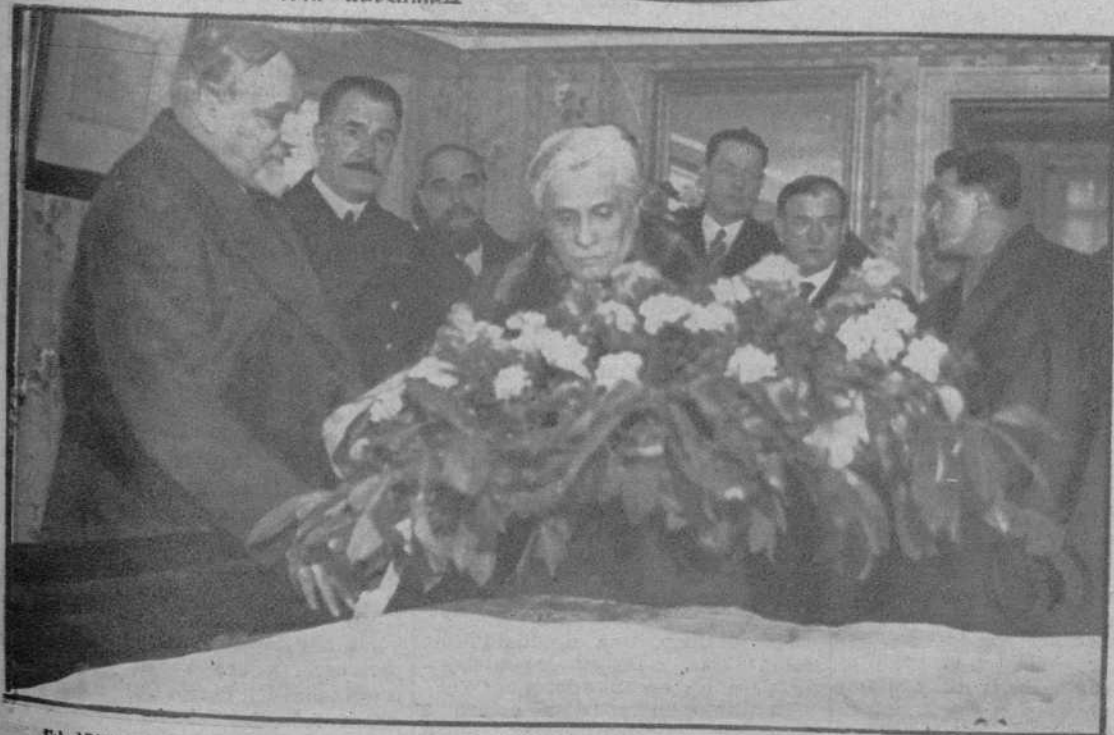
El jefe del gobierno francés, deposita un ramo de flores en el lecho en que murió Leon Gambetta.