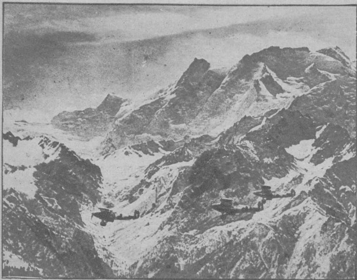
Una escuadrilla inglesa, vuela por encima del Himalaya, a 8.000 metros de altura.