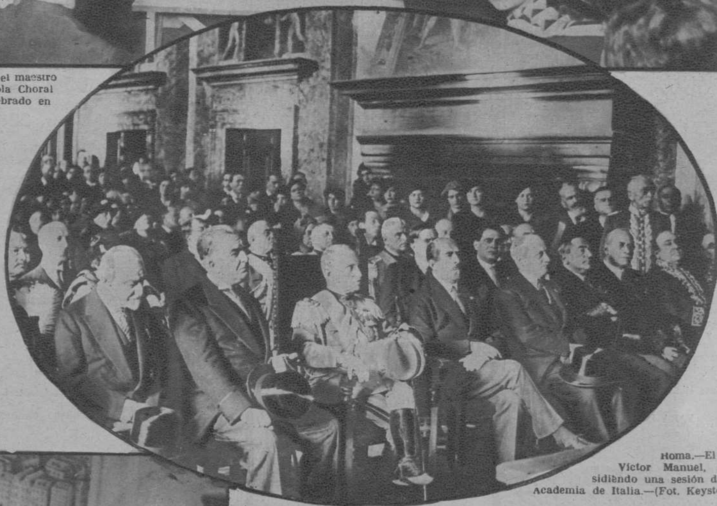
Roma.—El rey Víctor Manuel, presidiendo una sesión de la Academia de Italia.