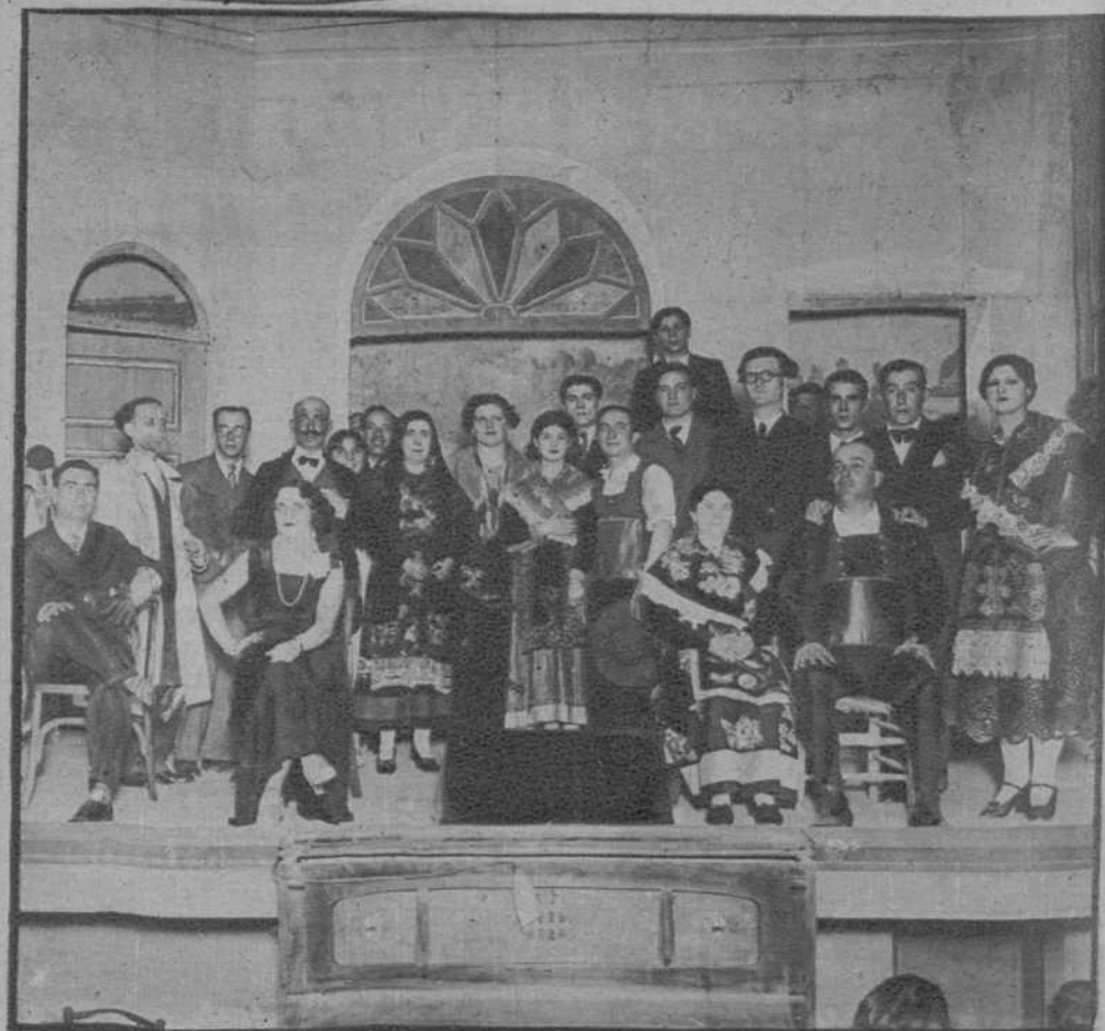
Lérida.—Festival a beneficio del internado de ancianos ferroviarios, en el que tomó parte el cuadro artístico ferroviario.