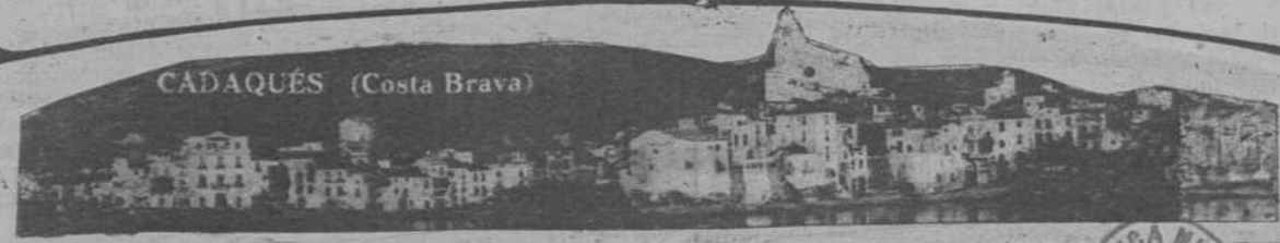
CADAQUÉS (Costa Brava)

REDACCIÓN DIRECCIÓN COMERCIAL Y ANUNCIOS Plaza de Cataluña, 9 - Tel. 14160 IMPRESA Y TALLERES MUNTANER, 49 ENTRADA: Pasaje de la Merced, núm. 3 Teléfono 31518