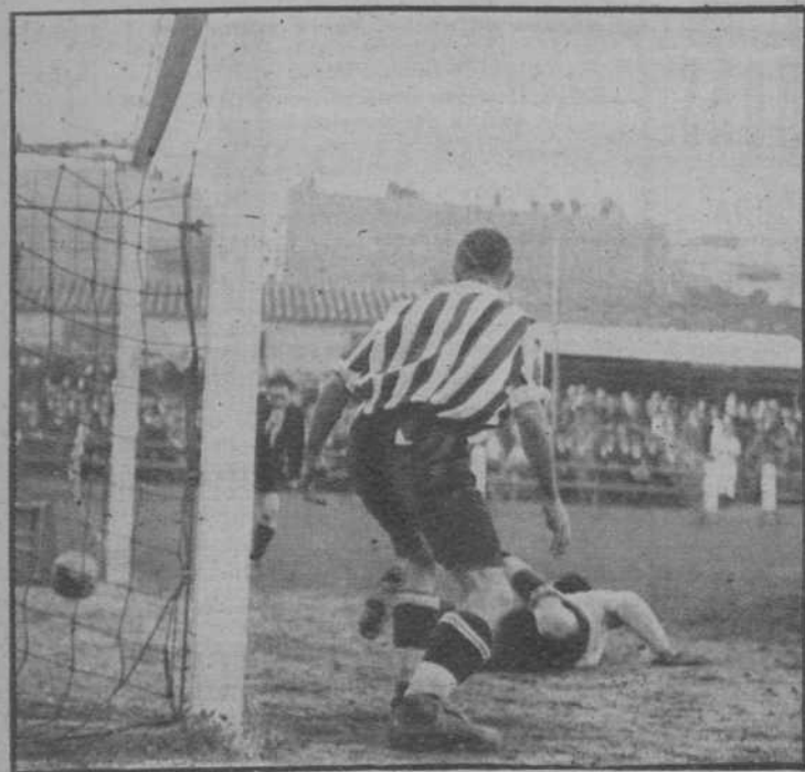
Barcelona.—Partido Martinen c-Barcelona. El primer goal del Barcelona.—(Fot. Florit)