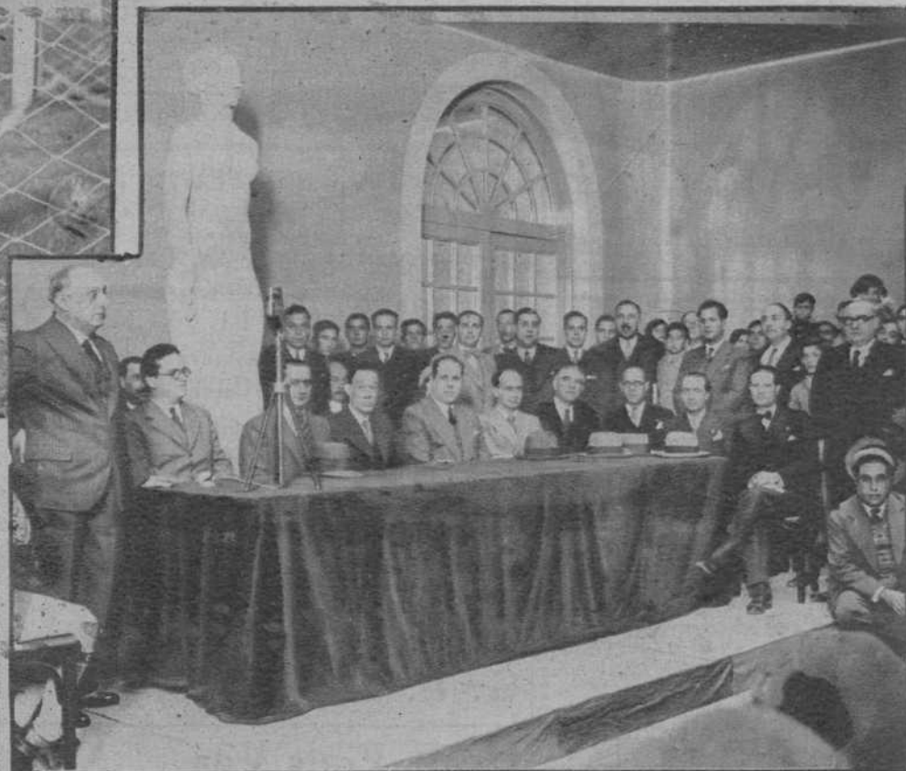
Barcelona.—Presidencia del acto de inauguración del Grupo Escolar instalado en los edificios de la Plaza de España.