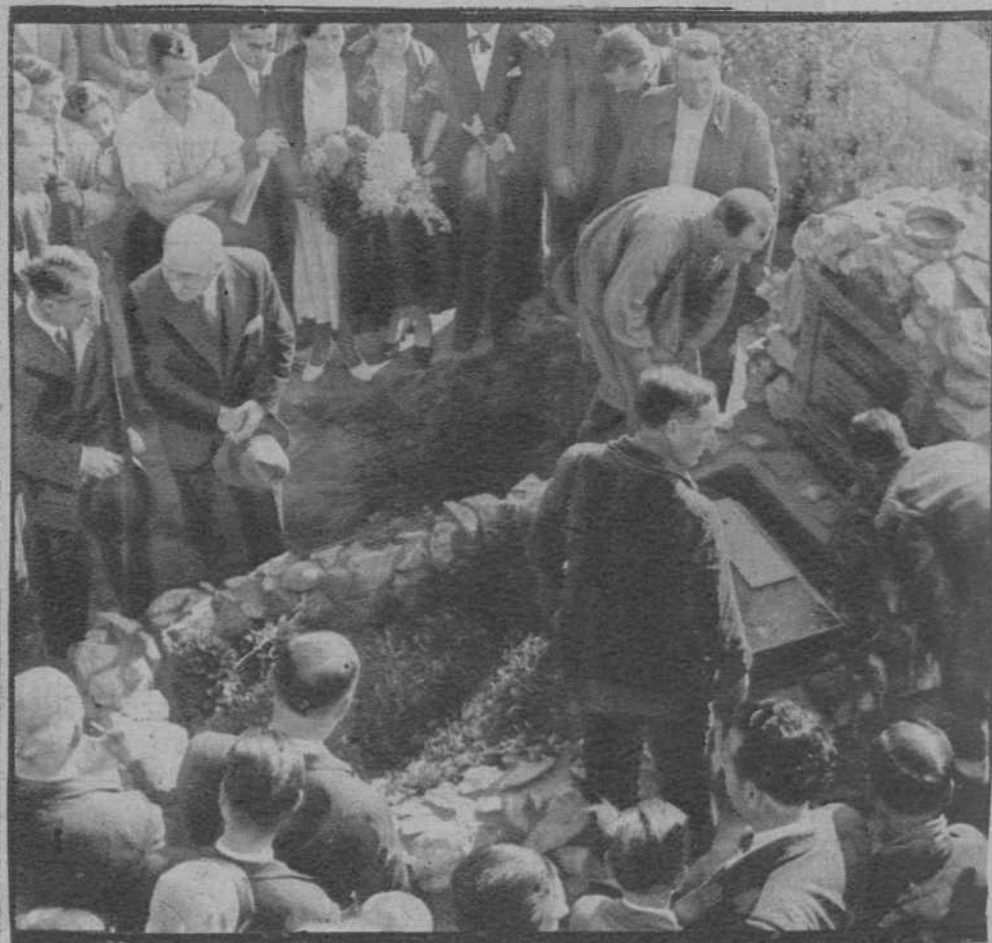
Barcelona.—Acto de trasladar los restos de Francisco Ferrer a la tumba que el Ayuntamiento ha donado a la hija de Ferrer. La urna, al ser colocada en la nueva tumba.

"SAL DE FRUTA" ENO ("FRUIT SALT") MARCAS REGIST.