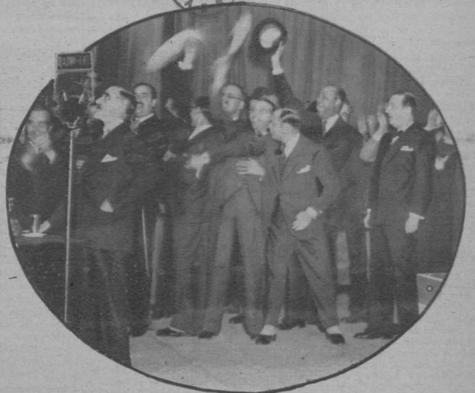
Don Francisco Cambó, hablando ante el micrófono, en el teatro Olympia