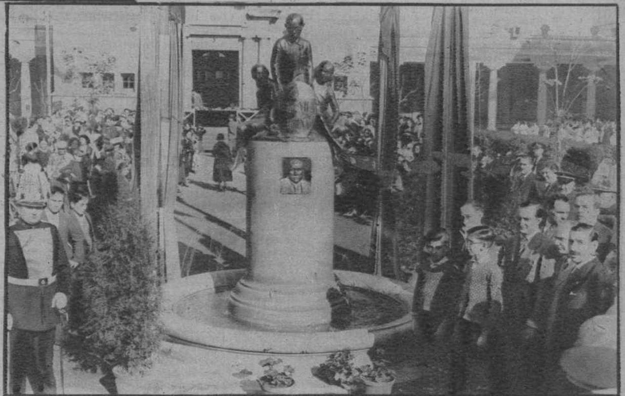
Inauguración del Monumento a Pere Vila y Codina, en los jardines de las escuelas del mismo nombre.