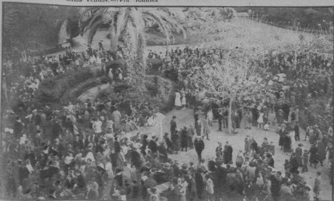
Un aspecto de la fiesta infantil, en las que fueron Escuelas-Plas