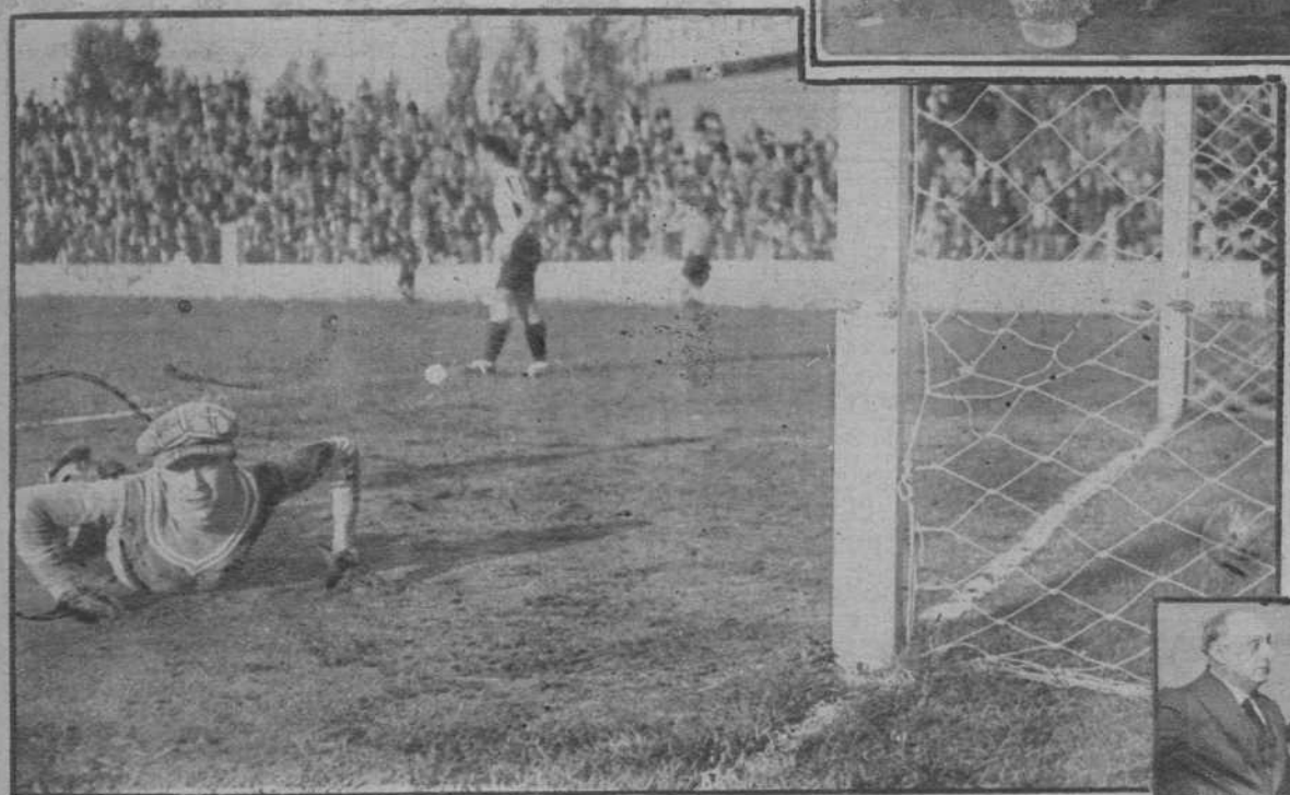
Barcelona.—Uno de los seis goals del Español en el partido Español-Palafrugell.

El Embajador de España, don José Rocha, con la Comisión organizadora de la gran fiesta a beneficio de los pobres de la colonia, que se celebró en el majestuoso Palacio Maxim's, y que rindió una suma bastante considerable