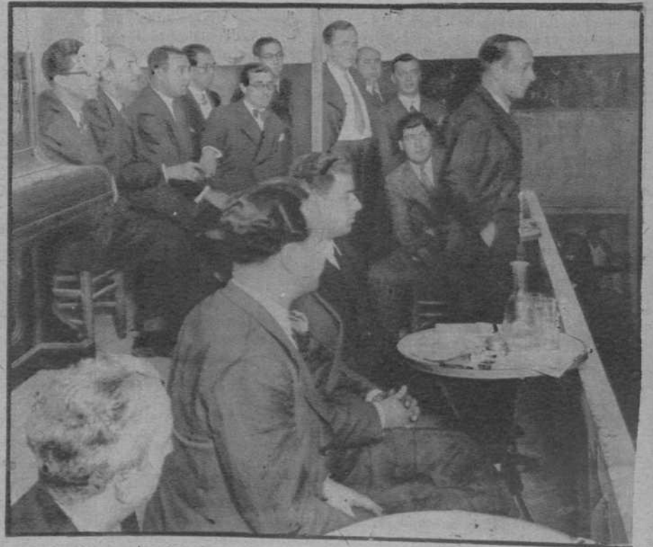
Oradores que tomaron parte en el mitin de empleados de Banca y Bolsa, celebrado en el Iris Park.