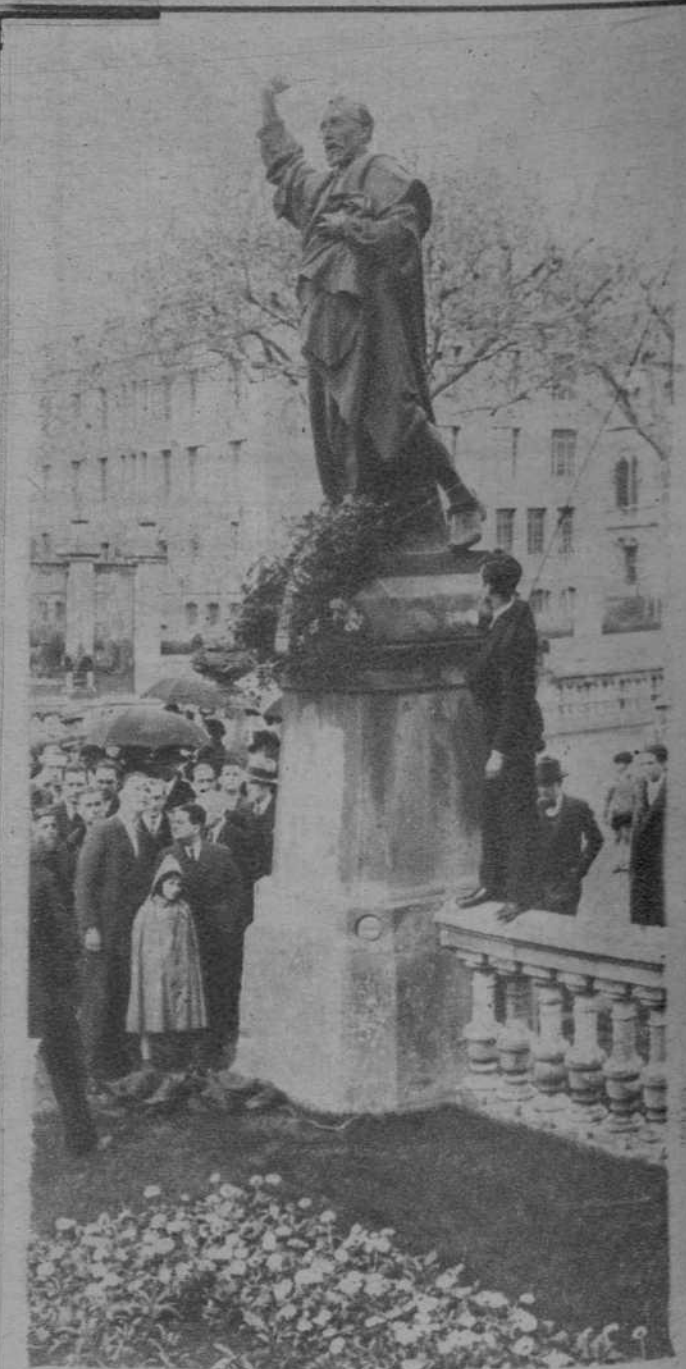
Varias entidades ciudadanas, depositaron el domingo, coronas de flores en la estatua de Pau Claris.— He aquí un momento del sencillo homenaje.