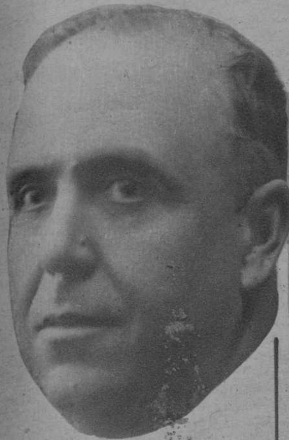
Don José Rocha, dignísimo Embajador de España en Lisboa, a cuya iniciativa se deben los importantes actos con que la colectividad española de la capital portuguesa, ha conmemorado la gloriosa fecha del 14 de Abril

En la Embajada y en las entidades españolas de Lisboa, se celebró brillantemente la fiesta nacional del 14 de Abril