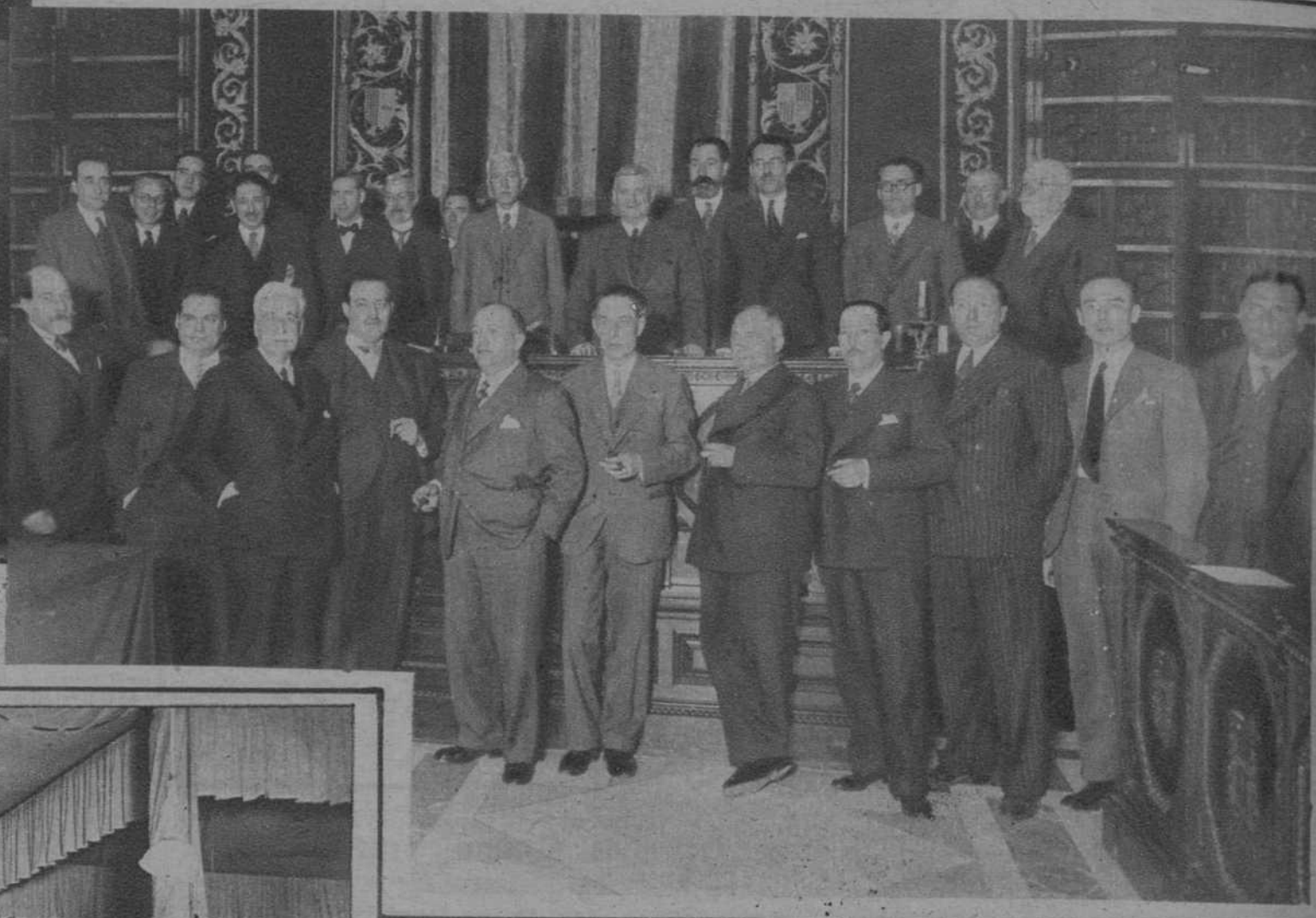
El Presidente de la Generalidad, don Francisco Maciá, presidiendo la reunión que celebraron los parlamentarios catalanes, para fijar su actitud ante la discusión del Estatuto de Cataluña en las Cortes