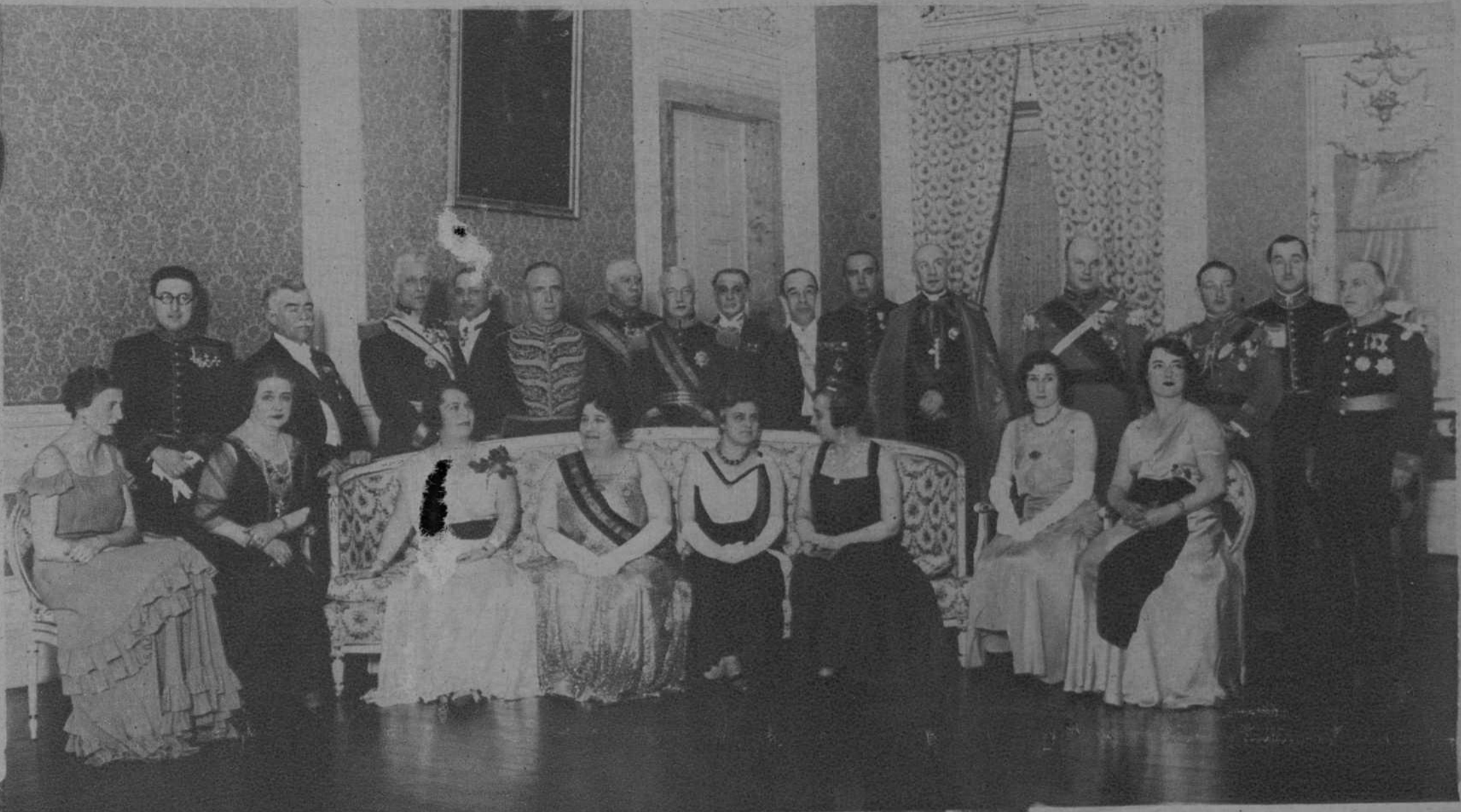
Asistentes a la comida de gala celebrada en los salones de la Embajada, en honor de S. E. el Sr. Presidente de la República