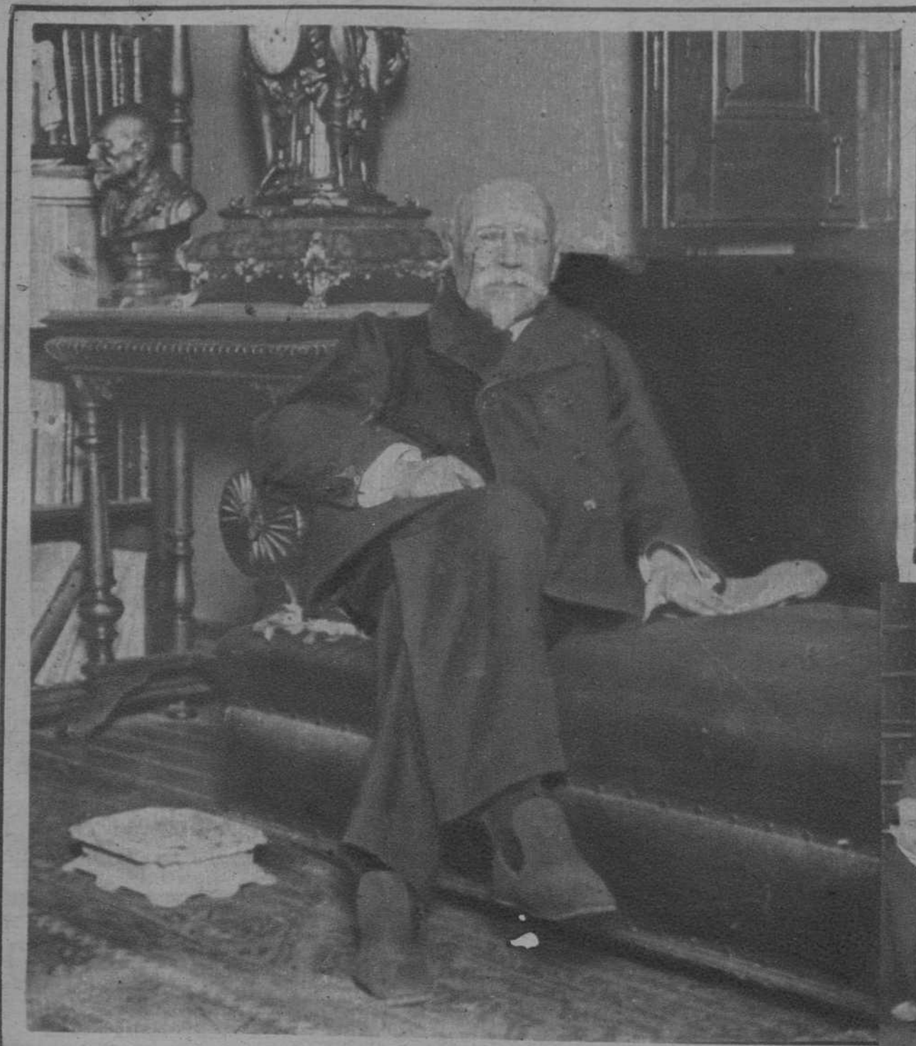
Uno de los últimos retratos de don José Echegaray, el centenario de cuyo nacimiento cumplióse ayer.