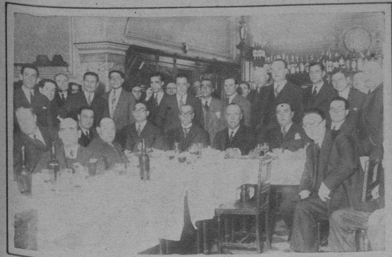
Comida en que se reunieron los antiguos republicanos.