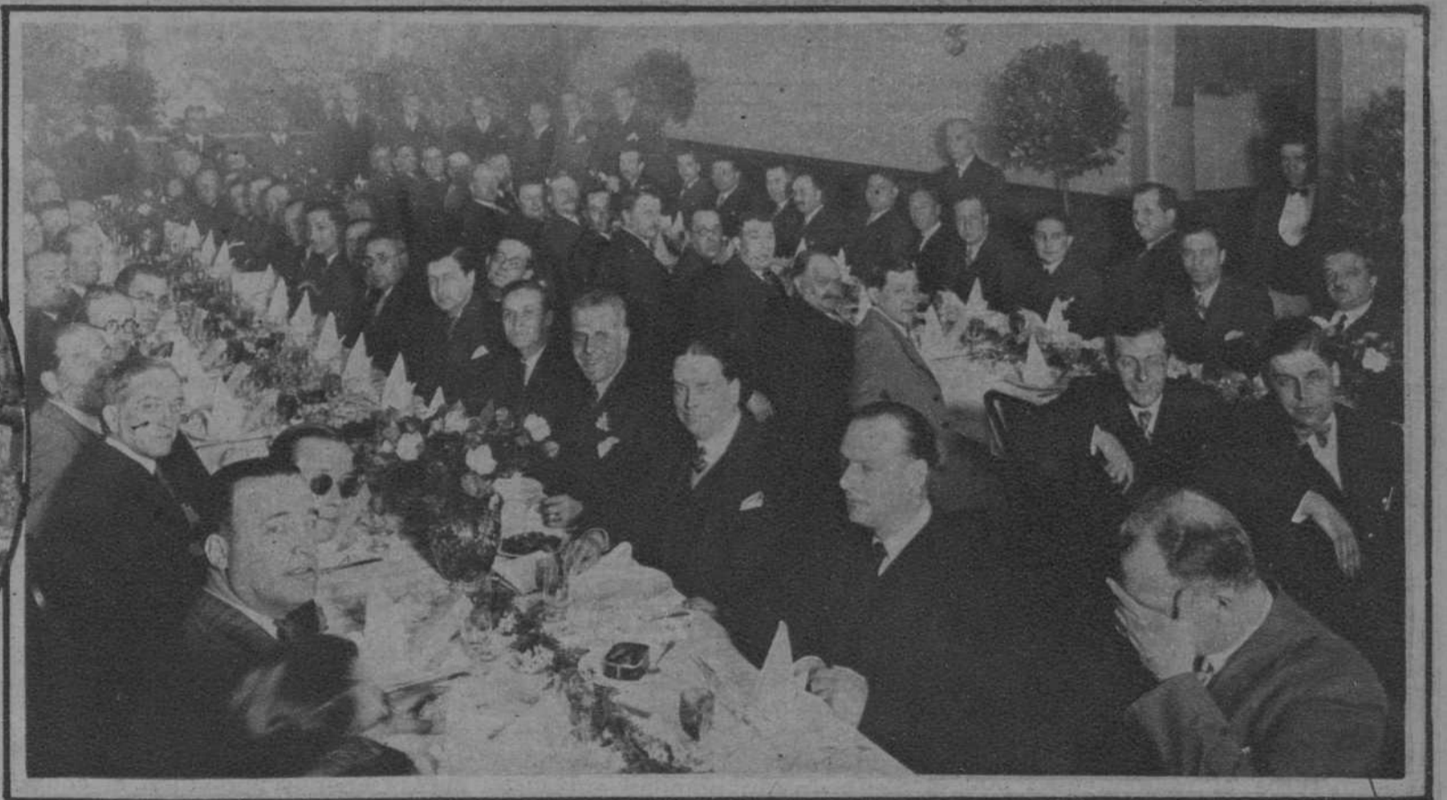
INAUGURACION DEL NUEVO LOCAL SOCIAL DE LA «ASOCIACION DE INDUSTRIALES ELECTRICISTAS Y ANEXOS DE CATALUÑA».

Los asociados, reunidos en fraternal banquete, en el restaurant Joanet, de la Brceloneta