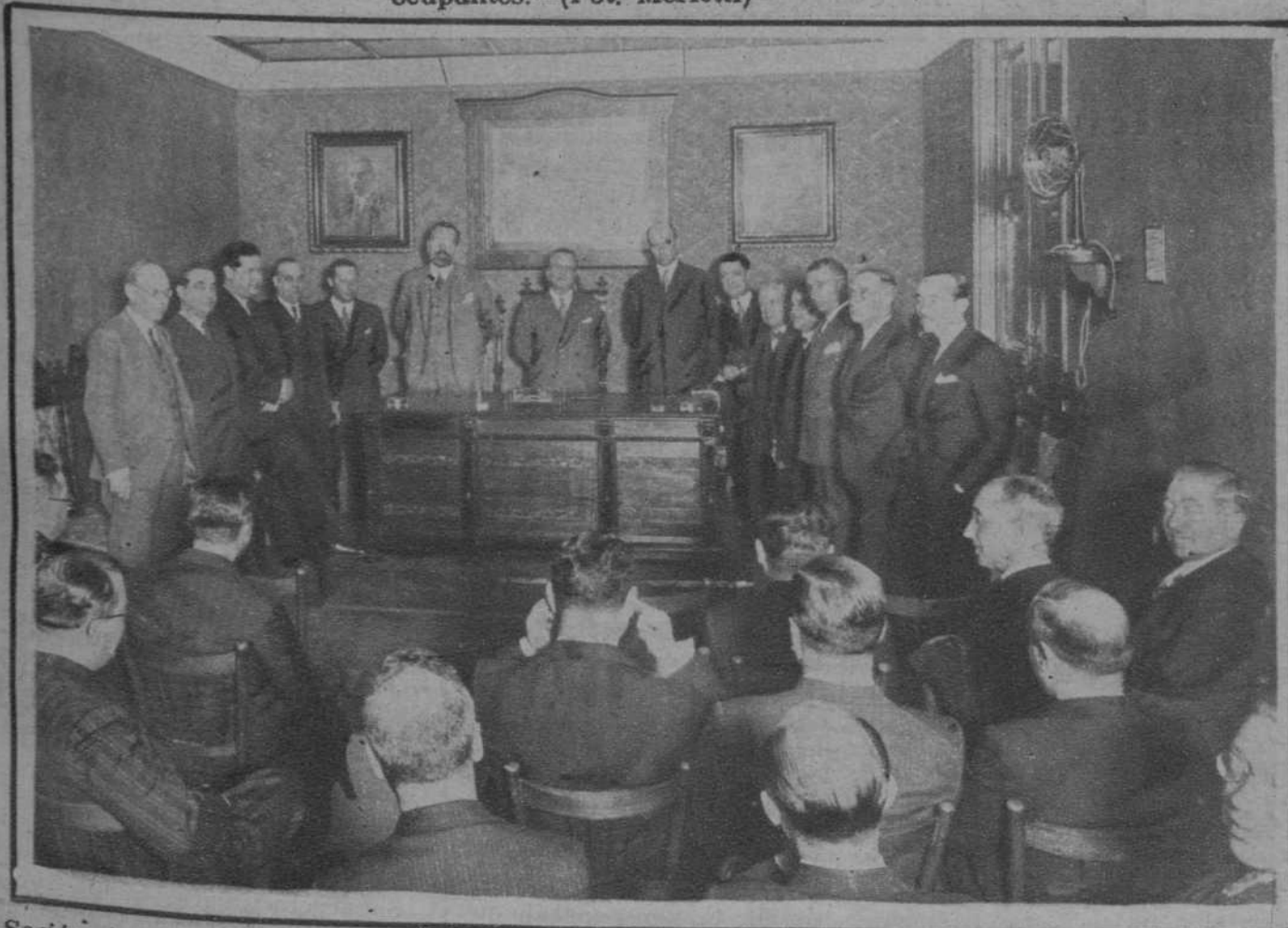
Sesión inaugural, en el nuevo local de la «Asociación de Industriales Electricistas y Anexos de Cataluña».

Los asociados, reunidos en fraternal banquete, en el restaurant Joanet, de la Brceloneta