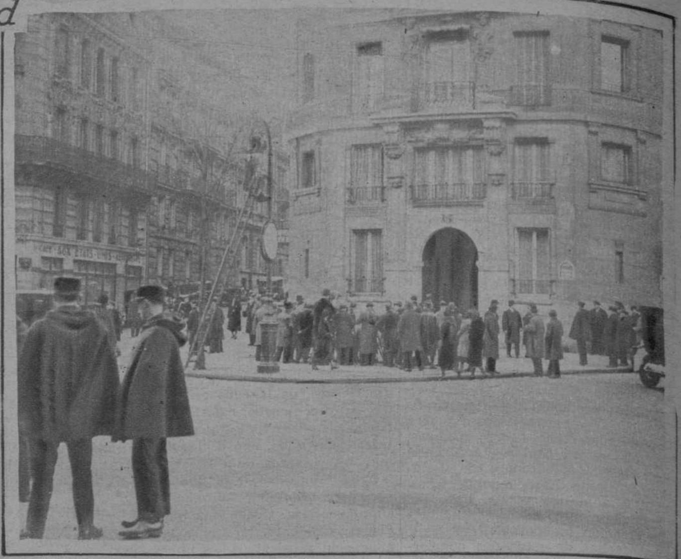
Grupo de periodistas, ante la casa mortuoria, esperando la llegada de las personalidades que acudieron a la capilla ardiente