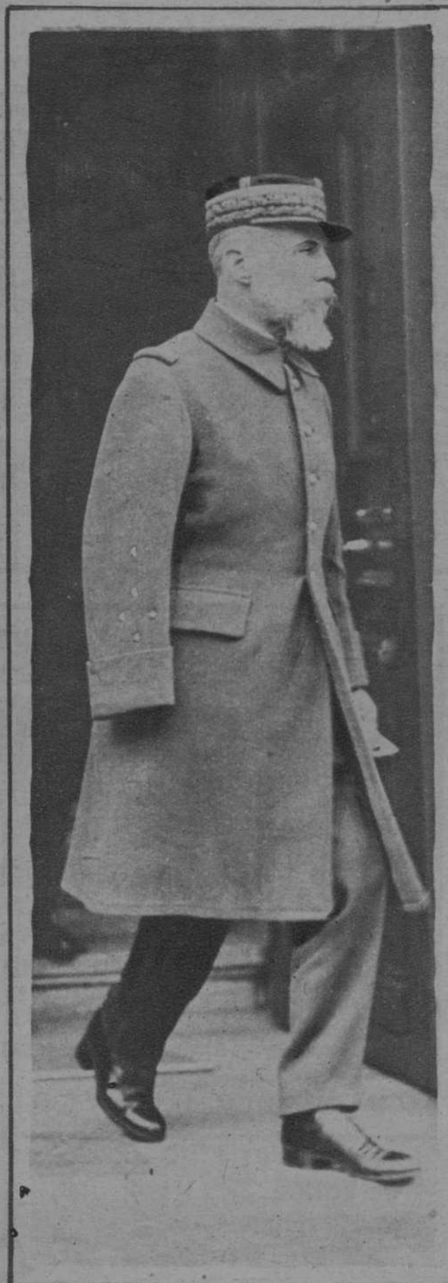
El general Gouraud, saliendo de visitar el cadáver del señor Briand