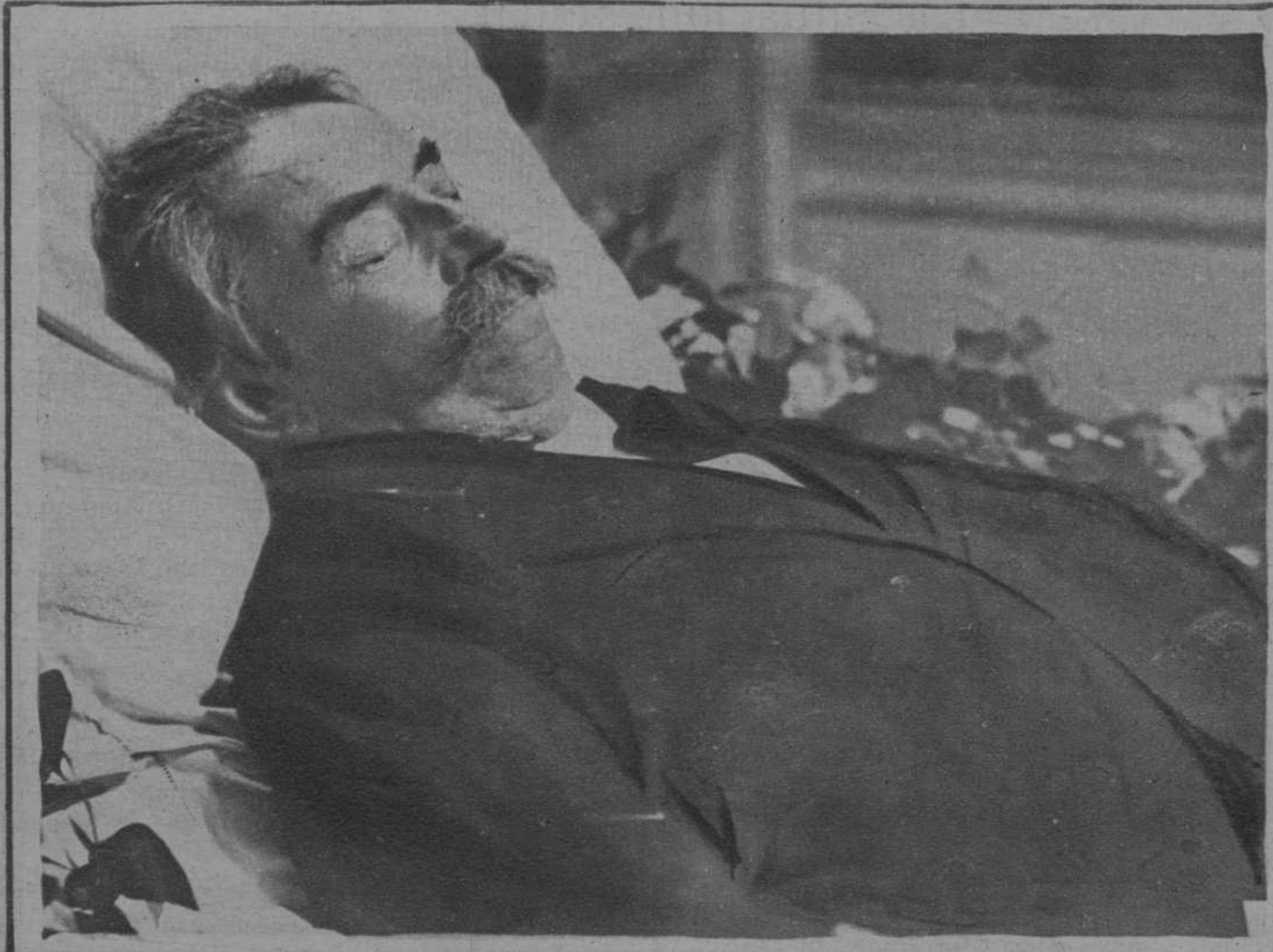
El cadáver del gran estadista, en el lecho mortuario