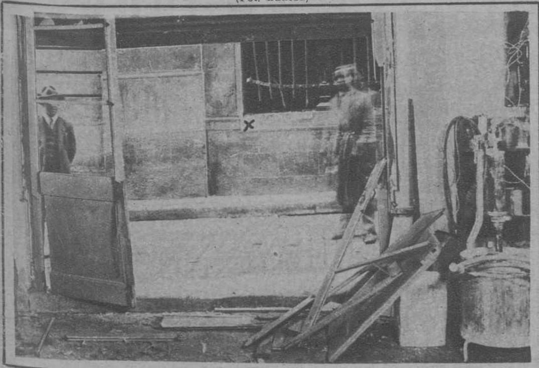
Tienda frontera a la ventana (X) donde estaba colocado el explosivo, y que también sufrió importantes desperfectos.