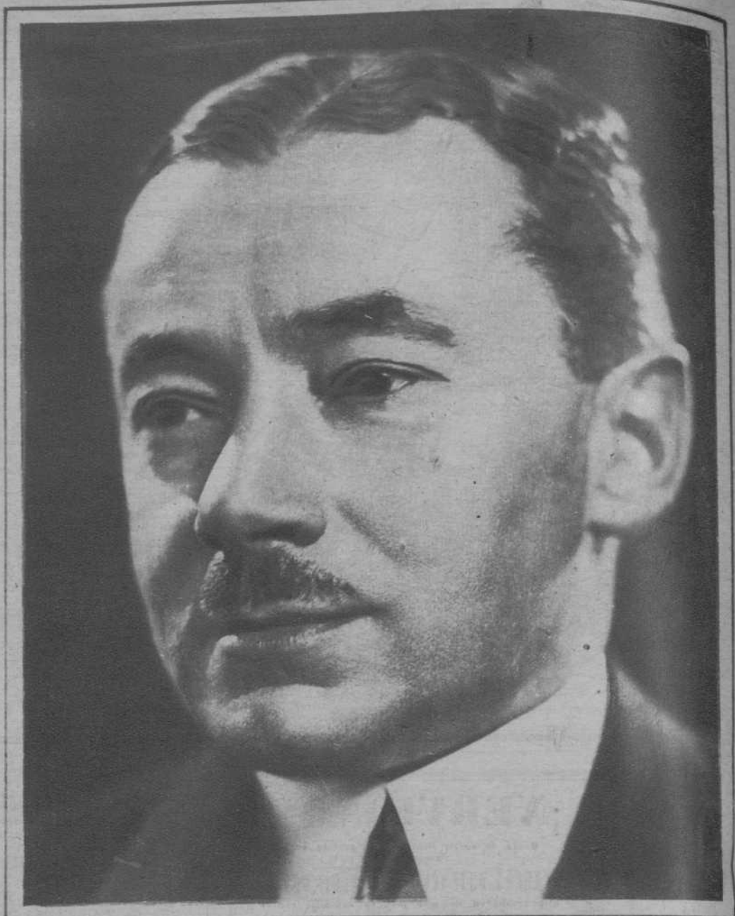
M. Paul Reynaud, ministro francés de Colonias, que formará parte de la Delegación de su país en la Conferencia del Desarme, que ha de reunirse en Ginebra