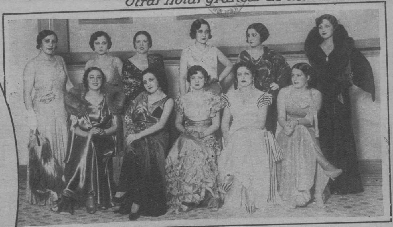
Madrid.—He aquí a las once señoritas—el más gentil «equipo» del torneo más galano—, entre las cuales tuvo que elegir el Jurado la que ha de representar en París a la belleza española.