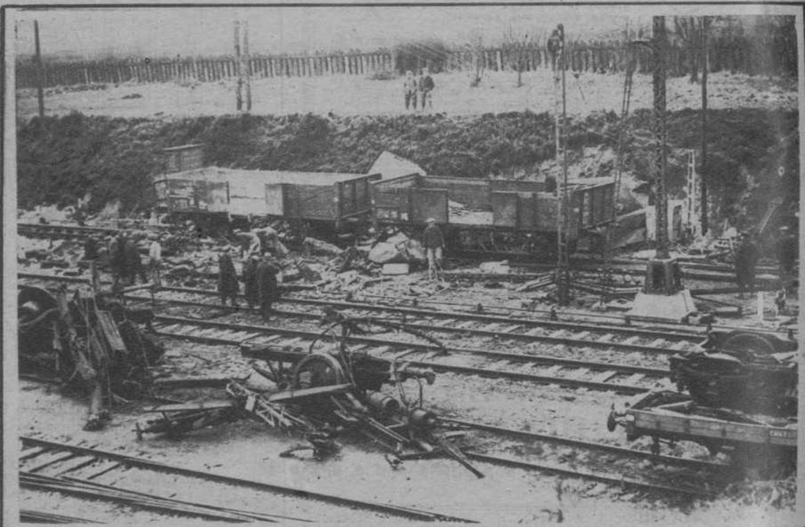
Después de la catástrofe ferroviaria de St. Just-en-Chansée (Oise). Vista general del lugar del suceso.