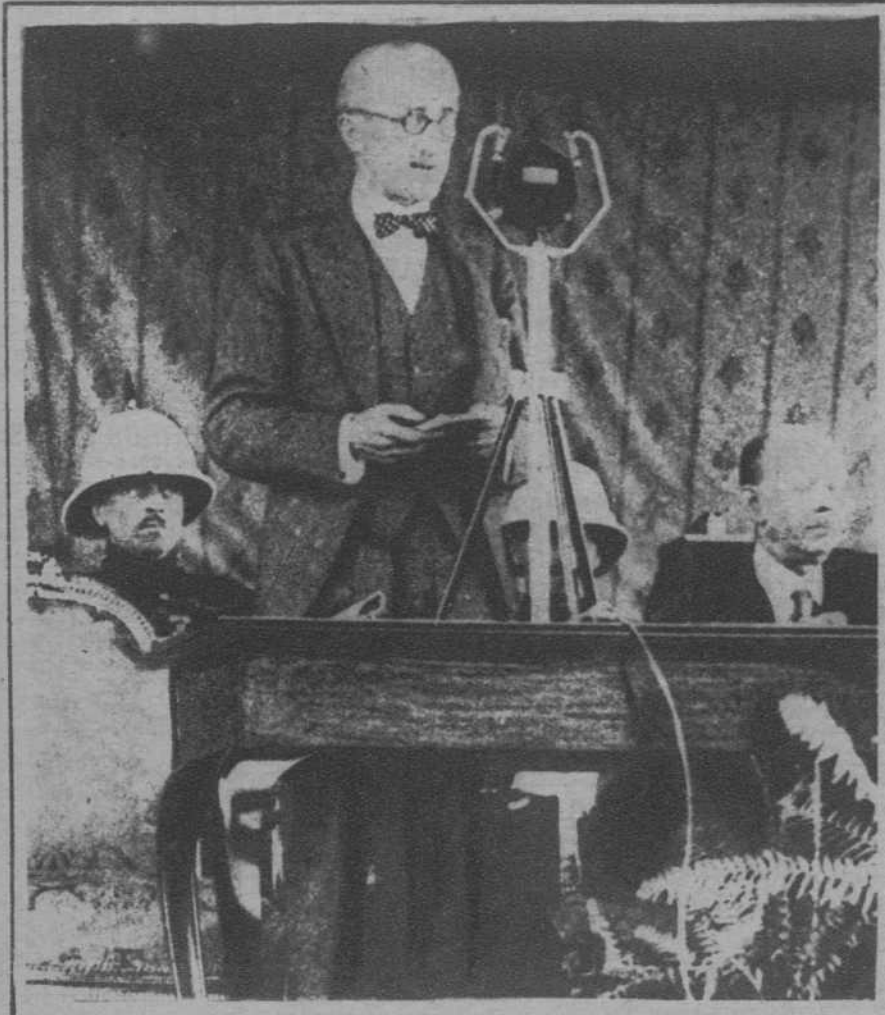
Calcuta.—Lord Wellington, virrey de las Indias, pronunciando un discurso ante el micrófono, en la inauguración del nuevo puente de ferrocarril que lleva su nombre, sobre el río Hooghly.