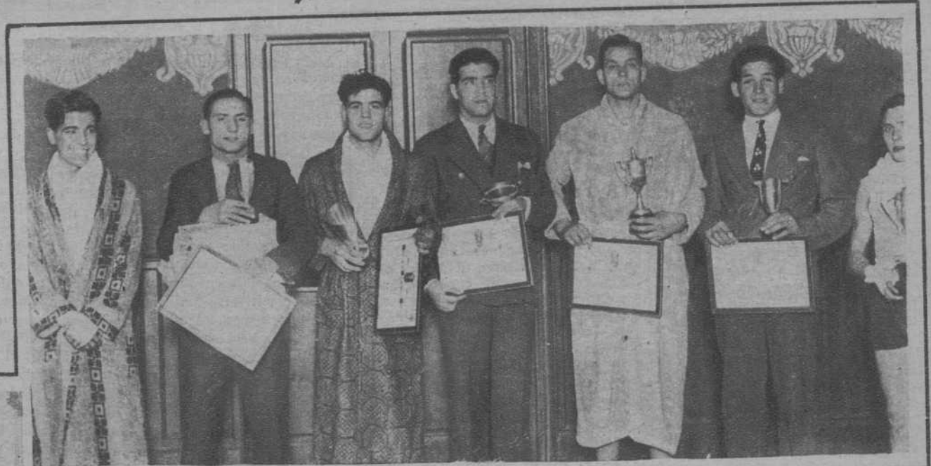
Los campeones «amateurs» de boxeo participantes en los Campeonatos de Cataluña, después de recibir los trofeos y premios que ganaron en los mismos.