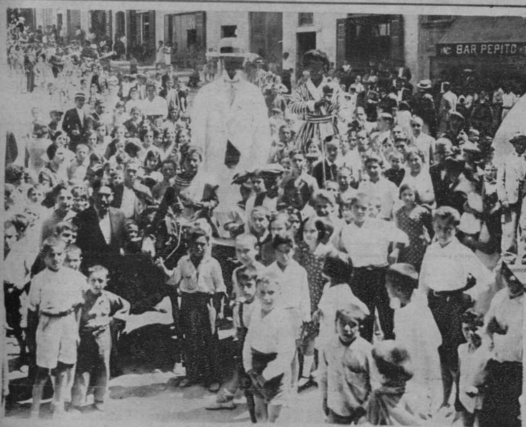
Tarragona.—Los "negritos", durante la fiesta del Patrono de la barriada del Cos del Bou, San Roque.