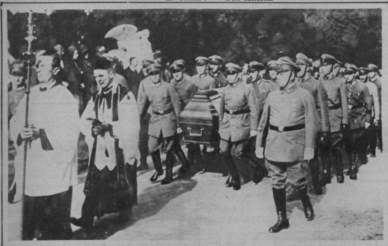
Colonia.—Entierro de un afiliado a los "Cascos de Acero", que resultó muerto en el encuentro con los comunistas.