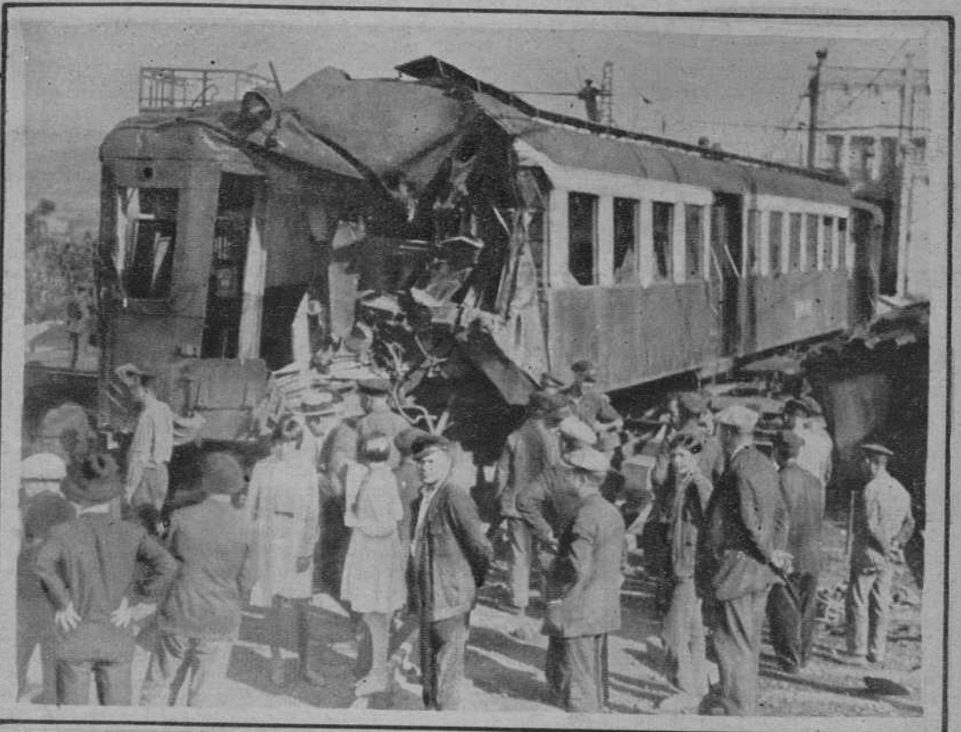
San Vicente de Castellet.—Estado en que quedó el tren-tranvía que, al entrar en esta estación, chocó con una locomotora, resultando un muerto y 22 heridos.