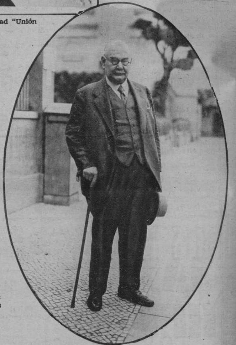
Edin.—M. Thomas Shaw, ministro de la Guerra, de Inglaterra, que ha llegado a esta ciudad.