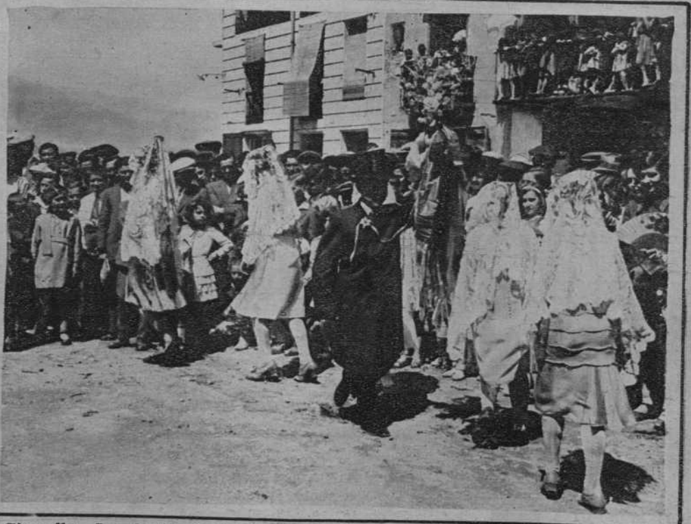
Gironella.—Los bailes de "Las Morratxas", durante la Fiesta Mayor.