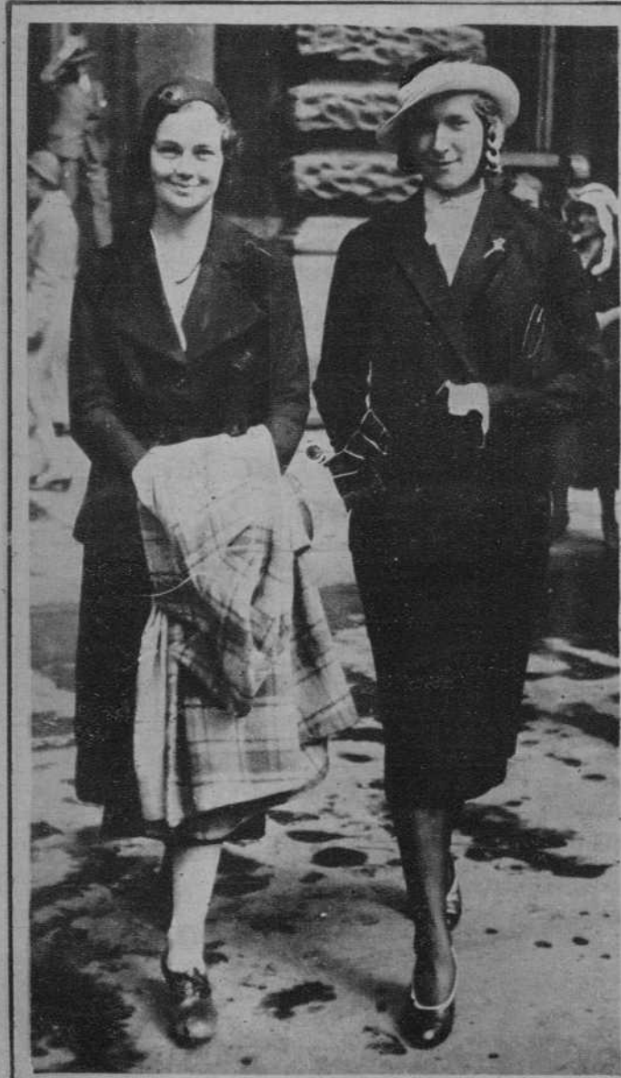
Hamburgo.—Llegada de la campeona americana de esgrima, señorita Marión Lloyd (a la derecha).