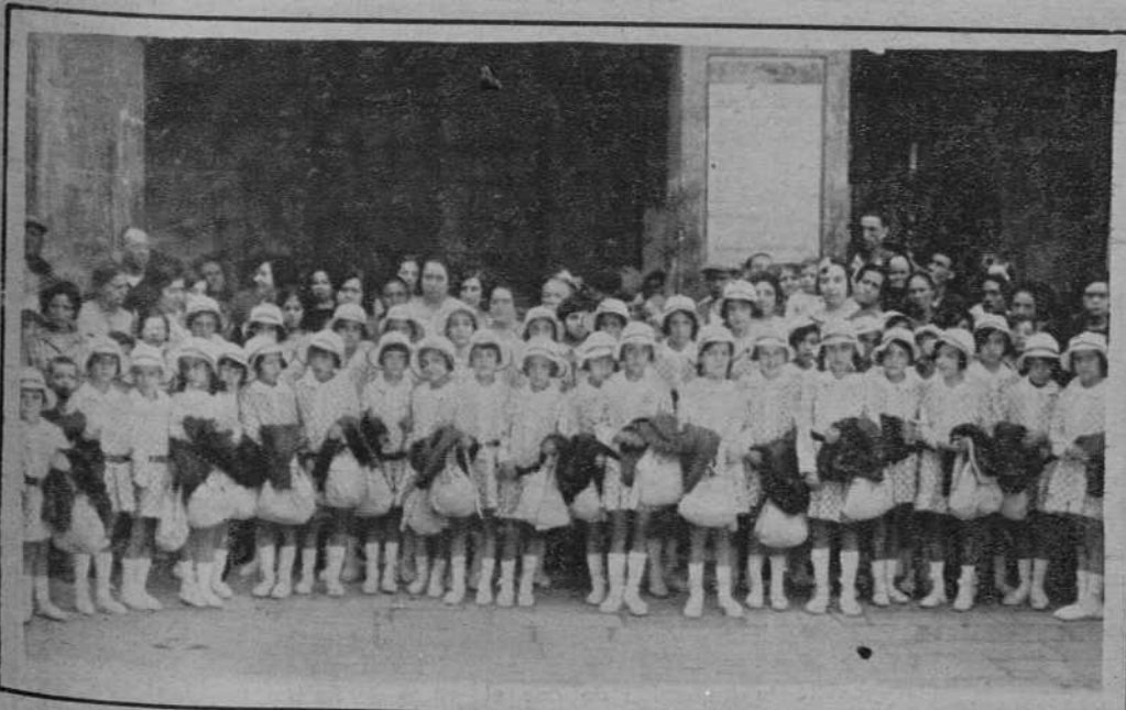
Manresa.—Salida de una nueva colonia escolar para veranear en Moyá