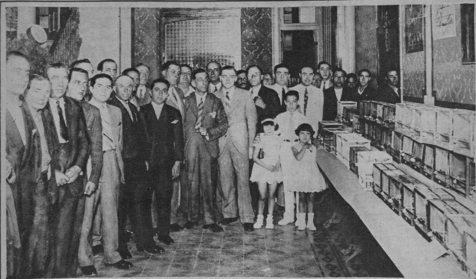
Grupo de concurrentes al acto inaugural de la interesante Exposición de Canarias, organizada por la Sociedad "Unión de Gracia".