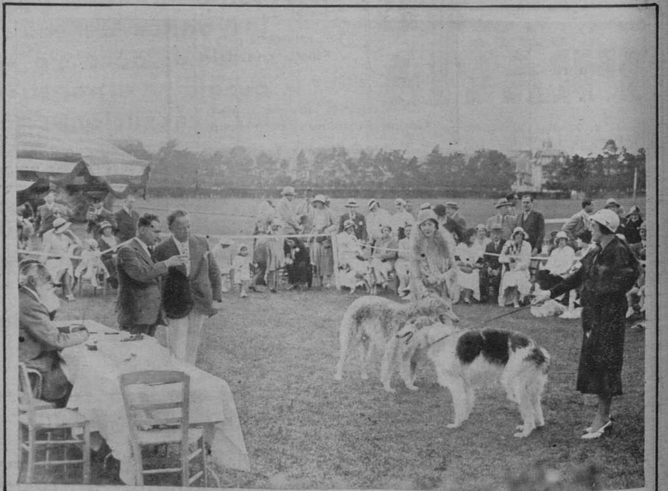
Deauville.—Concurso canino. El Jurado, examinando los ejemplares presentados.