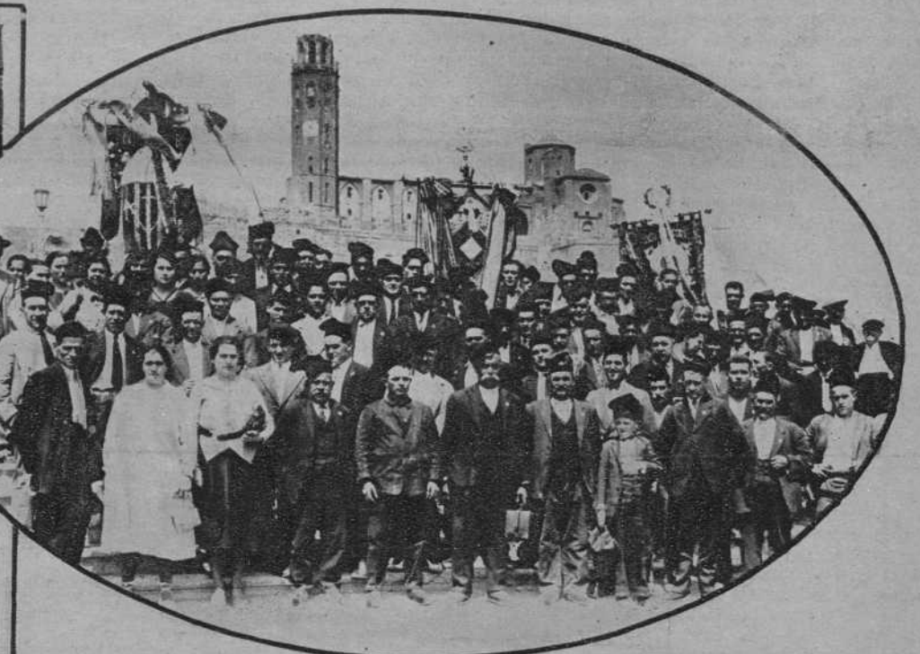
Lérida.—La masa coral "Los Obreros Rubinense", de Rubí, durante su visita a esta ciudad.