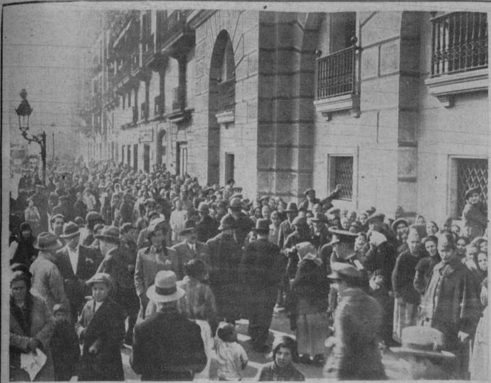
CON MOTIVO DEL SANTO DEL REY

Tuvo lugar ayer, en Capitanía, el reparto de: un duro, un pan de dos kilos y un bote de leche, a los pobres de Barcelona, acto que fué presidido por el obispo de la diócesis, doctor Irurita, y capitán general. Véase a los pobres estacionados ante la puerta de Capitanía, esperando que les llegue el turno.