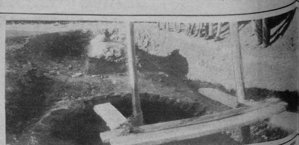
Badajoz.—En el parque de Castelar ha sido descubierta una gran galería, en la que se han hallado muchas monedas romanas.