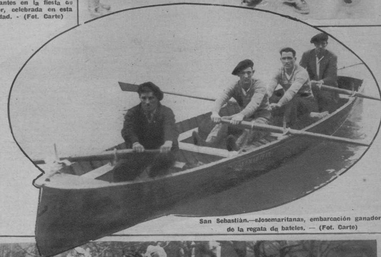
San Sebastián.—«Josemaritana», embarcación ganadora de la regata de bateles.