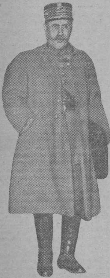
EL MARISCAL FOCH

(Publicación exclusiva de EL DIA GRAFICO)