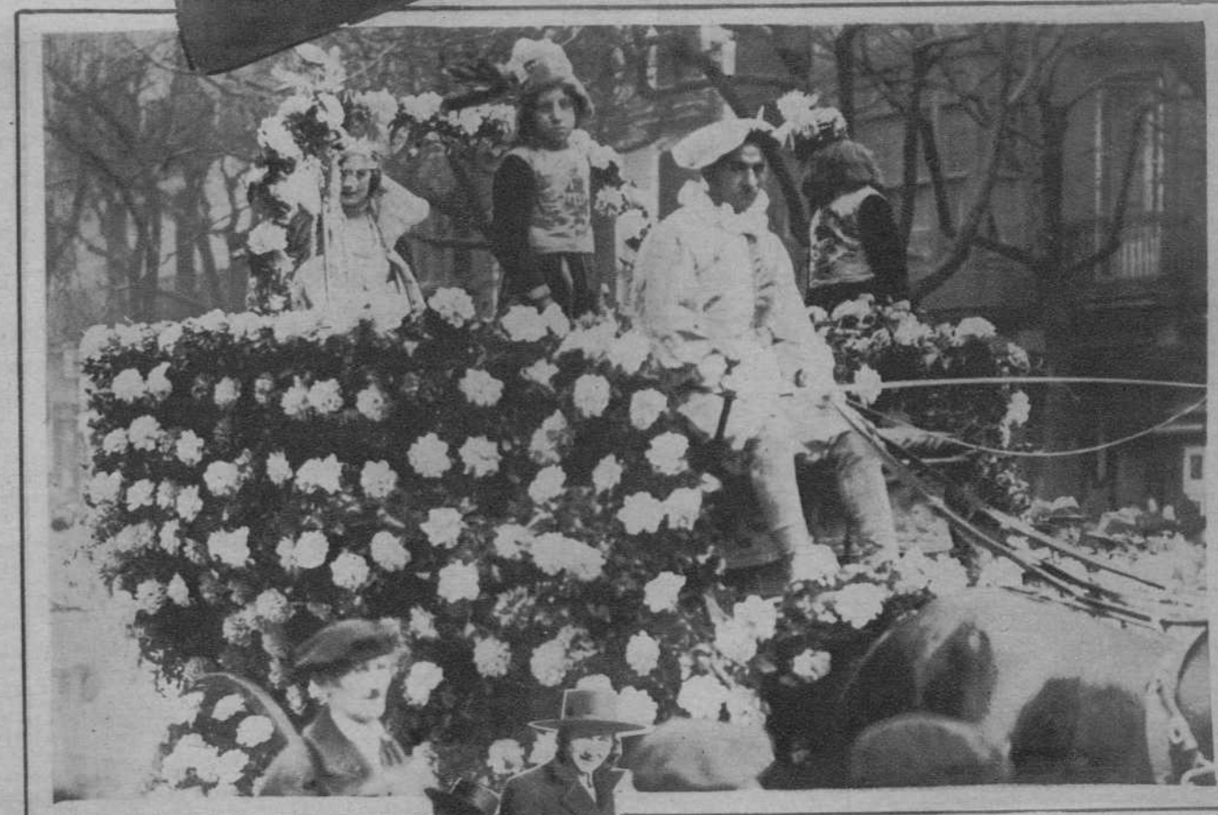
San Sebastián.—La «Bella Esosa», carroza de la Euskál Billena, ganadora del primer premio del concurso de carrozas celebrado en esta ciudad.