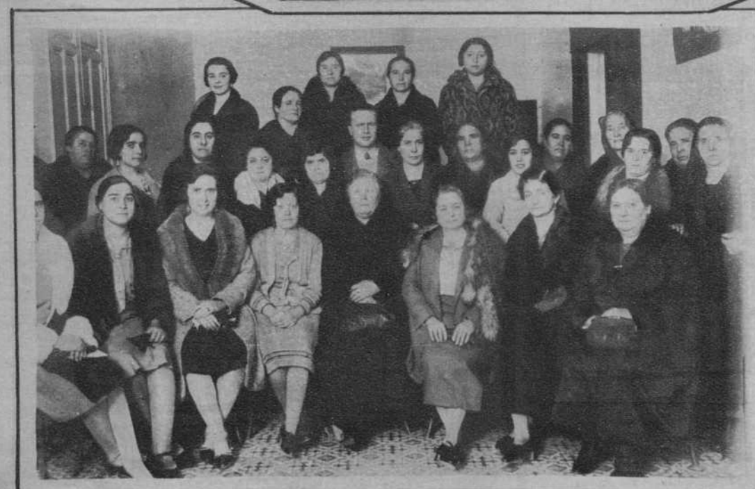
Córdoba.—Representantes que asistieron a la Asamblea Provincial de Matronas, que actualmente se celebra en esta ciudad.