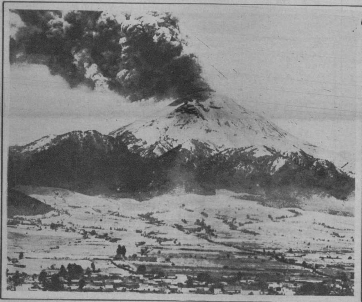
Vista del volcán Popocatepetl, en Méjico, situado en el macizo de Anahuac, a 3.452 metros de altura, que actualmente se halla en erupción.