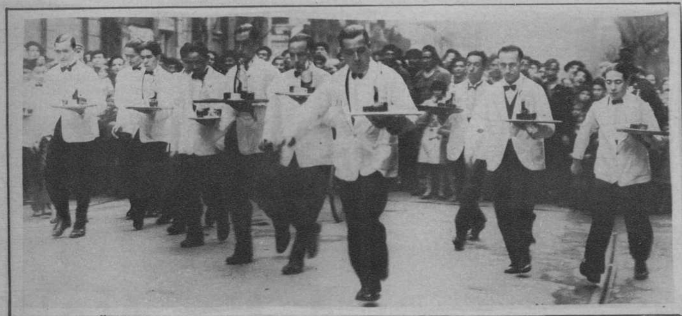
San Sebastián.—Se ha celebrado en esta ciudad una carrera de camareros de café, acto que fué presenciado por numerosísimo público