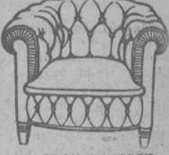
EL GRAN CONFORT Baños Nuevos, 12. Teléfono. 23441

CONDUCCION NAVARRO Buena enseñanza. Seriedad ROCAFORT, 66 DISECCION de animales, e. Unión, núm. 18, 8º