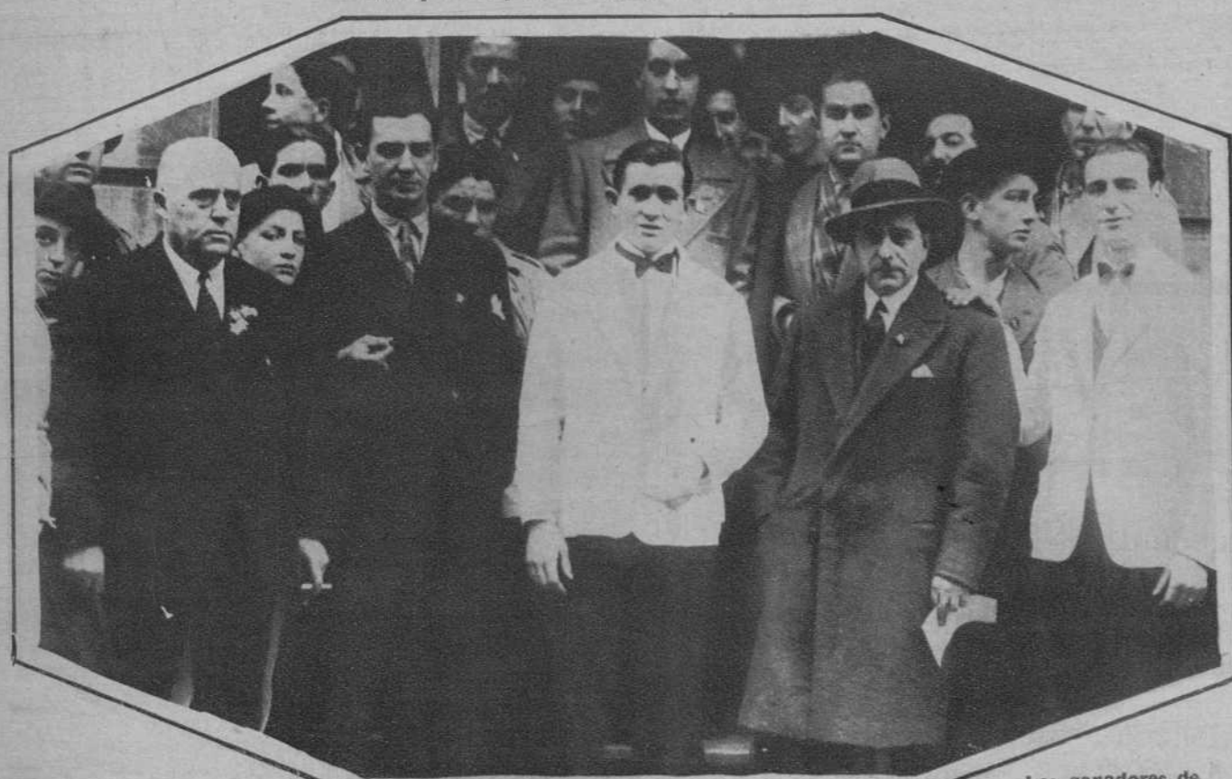
Los ganadores de la carrera