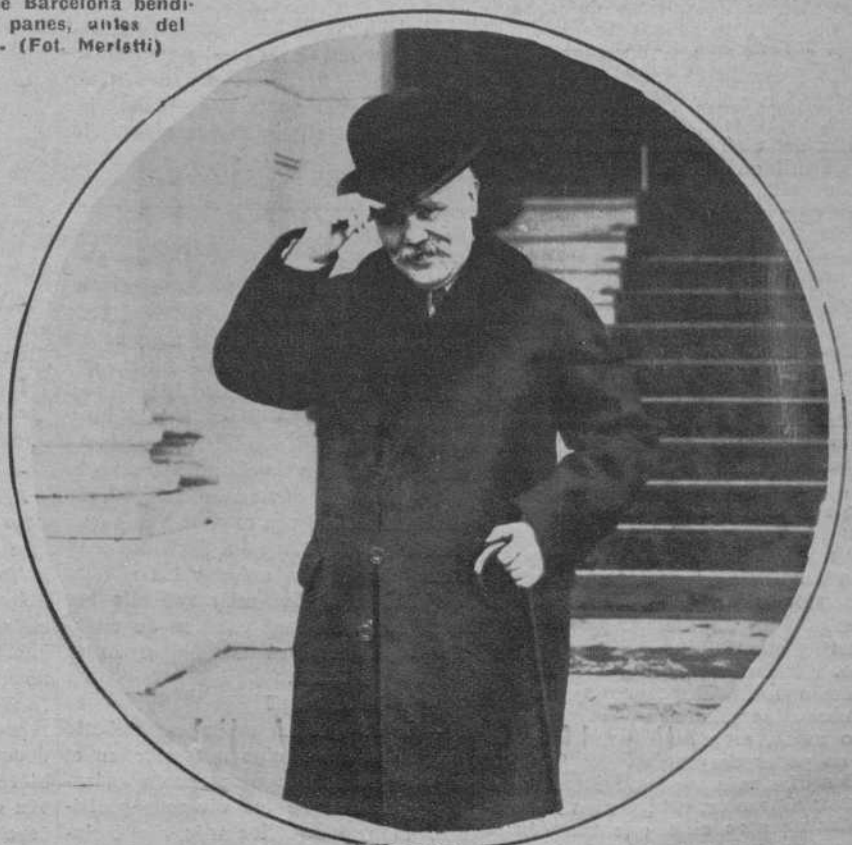
Monsieur Loucheur, ministro francés de Economía, que ha celebrado en Ginebra una entrevista con el ministro de Negocios Extranjeros de Inglaterra, Mr. Henderson, relacionada con la Unión Europea.