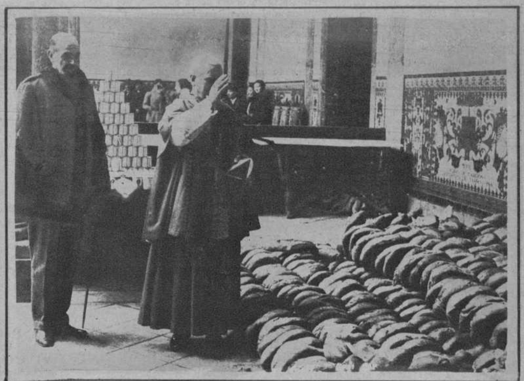
El obispo de Barcelona bendiciendo los panes, antes del reparto.