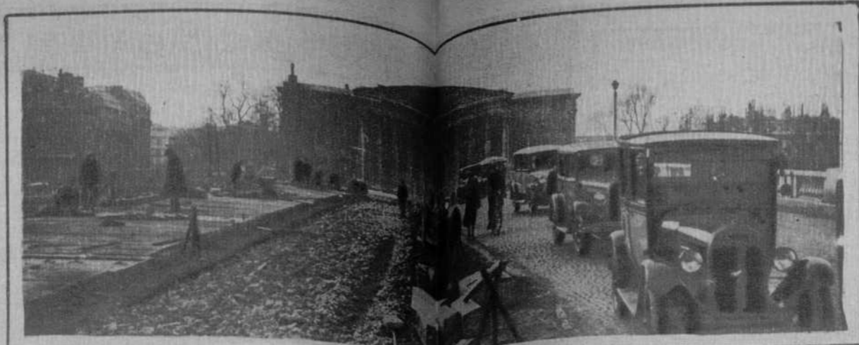
Paris.—Trabajos de pavimentación que se está haciendo en el puente de la Concordia