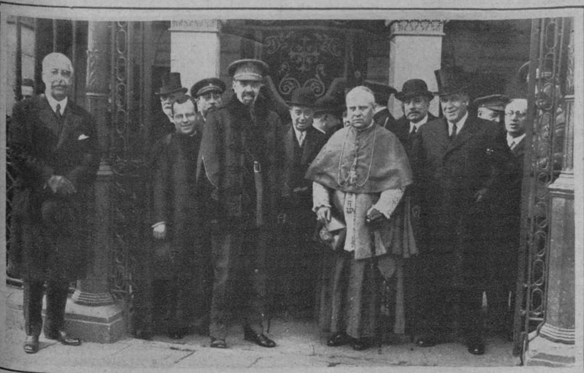
El obispo y autoridades, al salir de la iglesia de Santa Mónica, donde se celebraron ayer los funerales por el alma del general Las Heras.