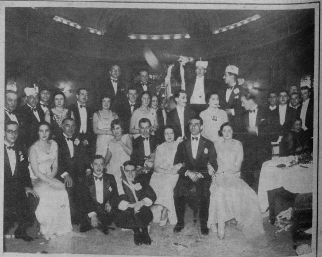
Bilbao.—En el Hotel Carlton, la aristocrática sociedad bilbaína ha empezado a organizar cenas de gala, a las que concurre lo más distinguido de ella. Dos aspectos del hall del hotel, durante la fiesta.