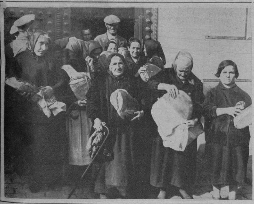
Grupo de pobres, después de recibir su ración correspondiente.