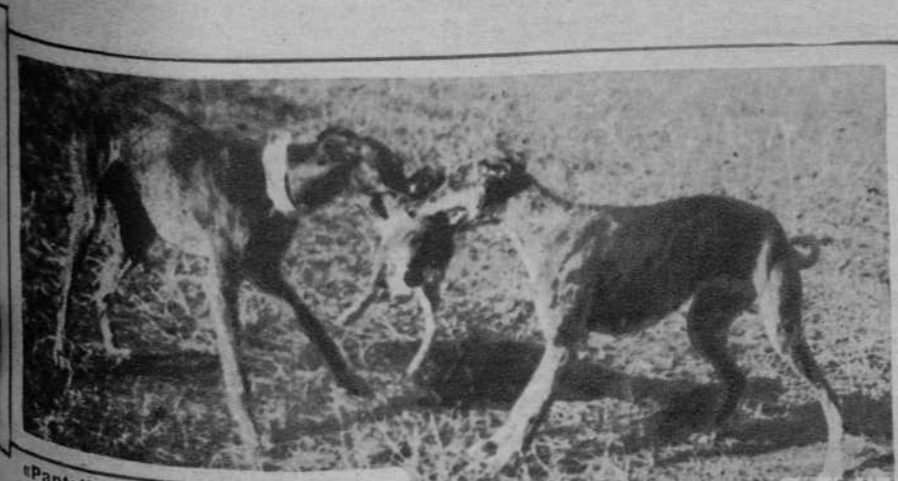
«Pantallas» y «Baquillas», disputándose una pieza.