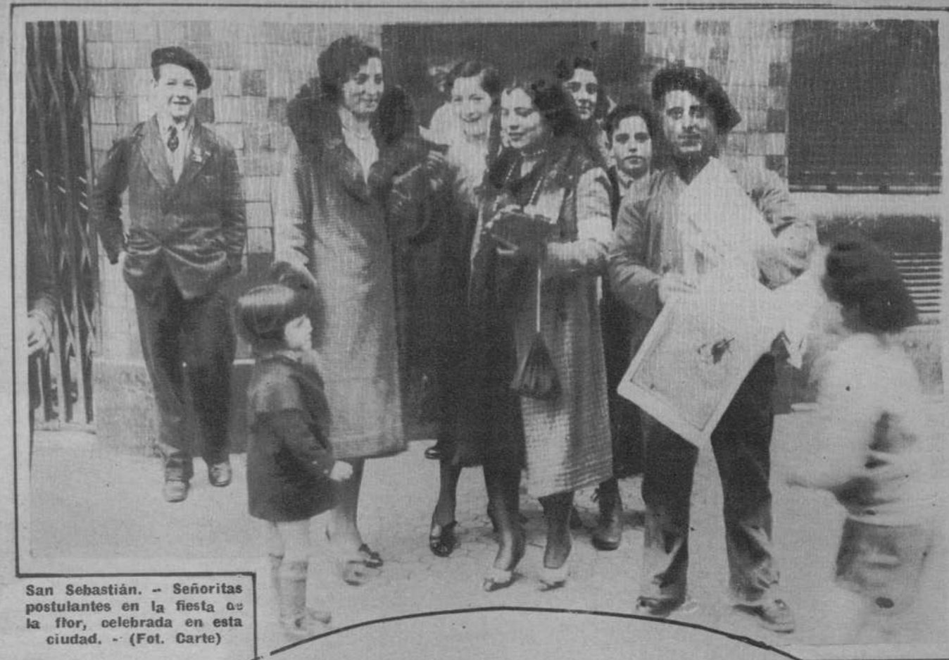
San Sebastián.—Señoritas postulantes en la fiesta de la flor, celebrada en esta ciudad.