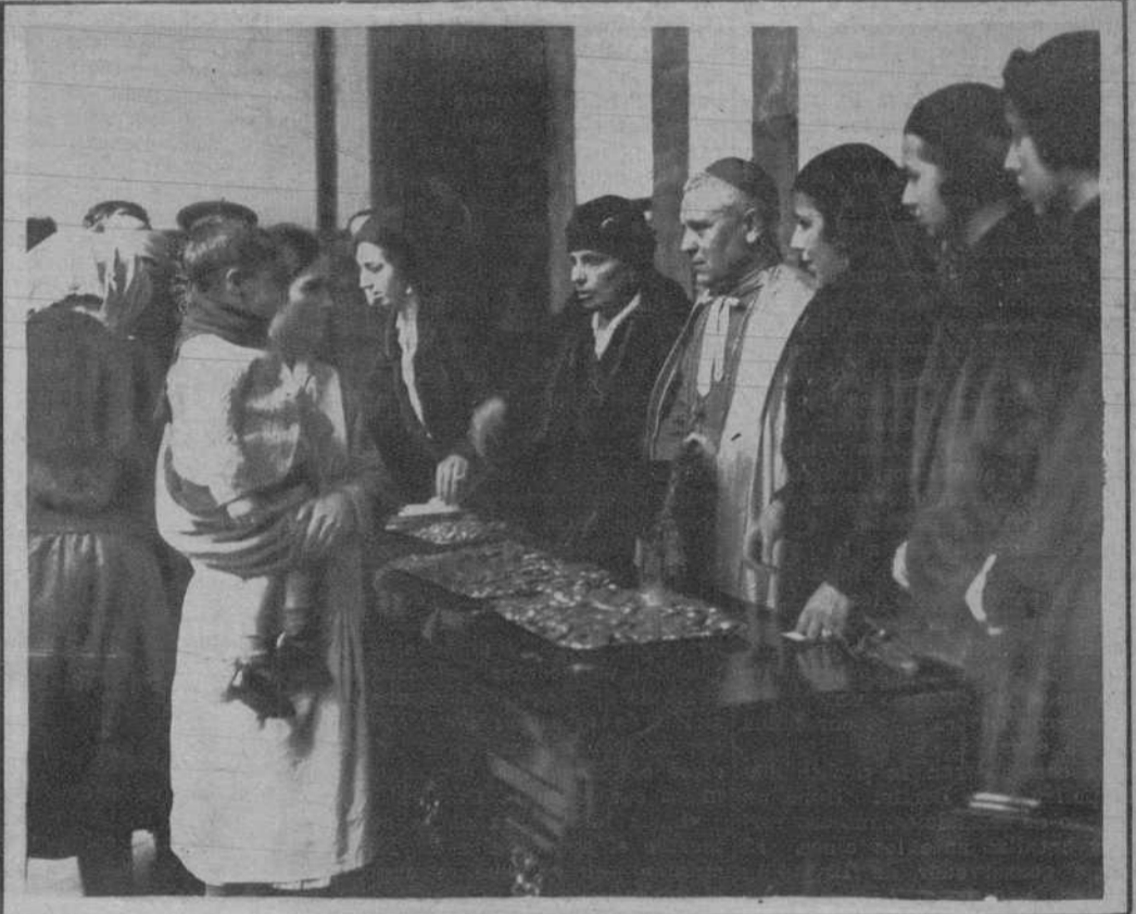
Un momento durante el reparto.

Tuvo lugar ayer, en Capitanía, el reparto de: un duro, un pan de dos kilos y un bote de leche, a los pobres de Barcelona, acto que fué presidido por el obispo de la diócesis, doctor Irurita, y capitán general. Véase a los pobres estacionados ante la puerta de Capitanía, esperando que les llegue el turno.