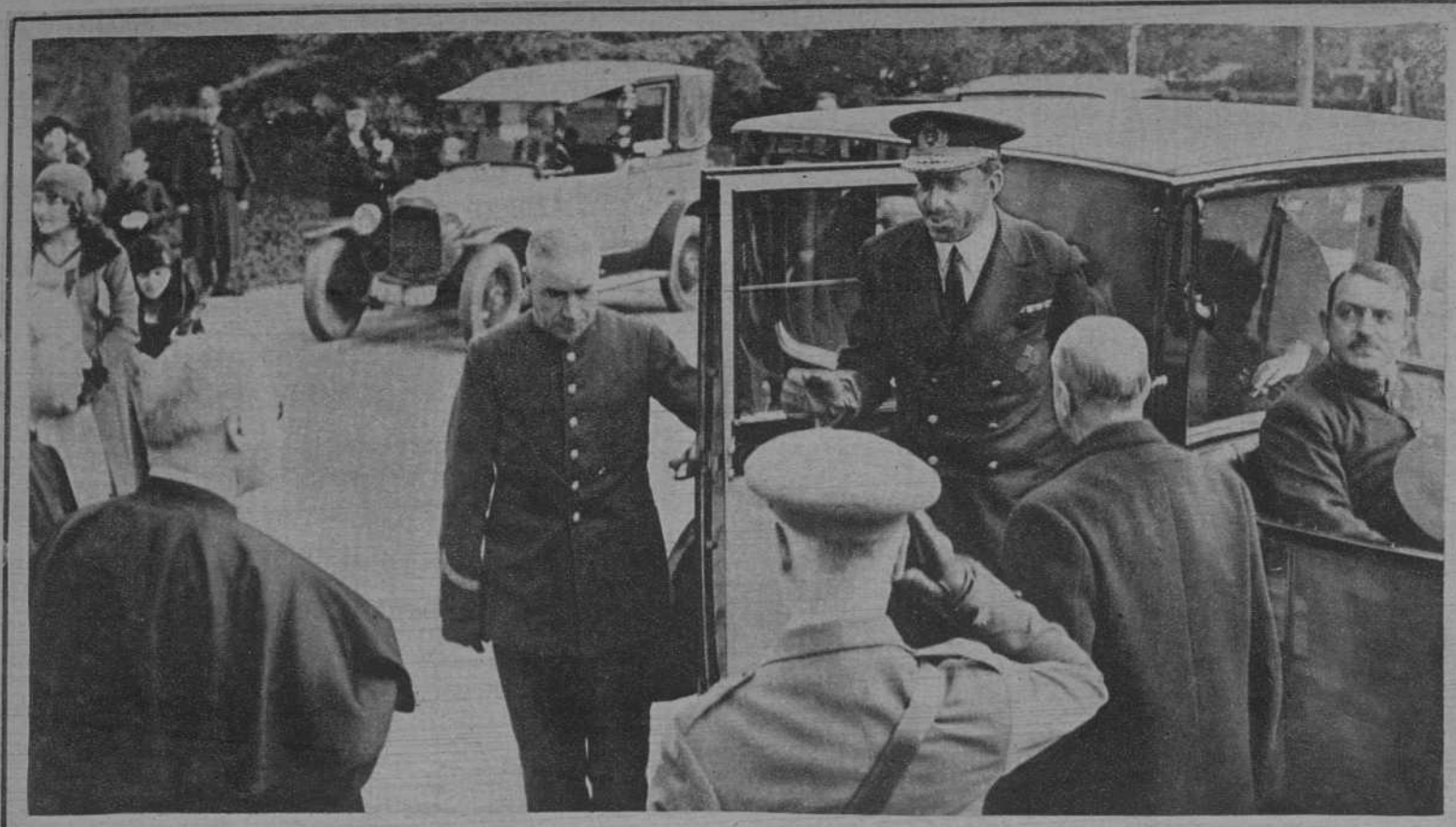
El Rey visitó ayer mañana el edificio que en Sarriá tienen las Escuelas Pías destinado a Colegio. De dicha visita publicamos las siguientes notas gráficas, que reproducen al Rey al llegar al pensionado, donde fué recibido por los directores del mismo; a Don Alfonso al abandonar el edificio; contemplando los jardines desde la terraza del Colegio; S. M. durante la bendición de la bandera que ha donado al batallón infantil del Colegio, y recorriendo las instalaciones científicas del mismo, acompañado del P. Superior y del gobernador civil de la provincia.