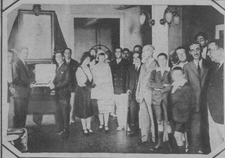
BARCELONA.—El comandante de Marina, recibiendo del presidente del R. C. Náutico, la placa conmemorativa de la regata Nueva York-Santander