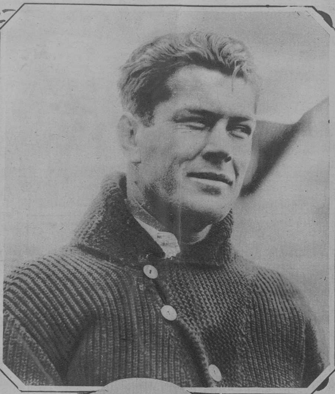
El boxeador Gene Tunney, que al vencer a Tom Heeney, continúa en posesión del Campeonato del mundo