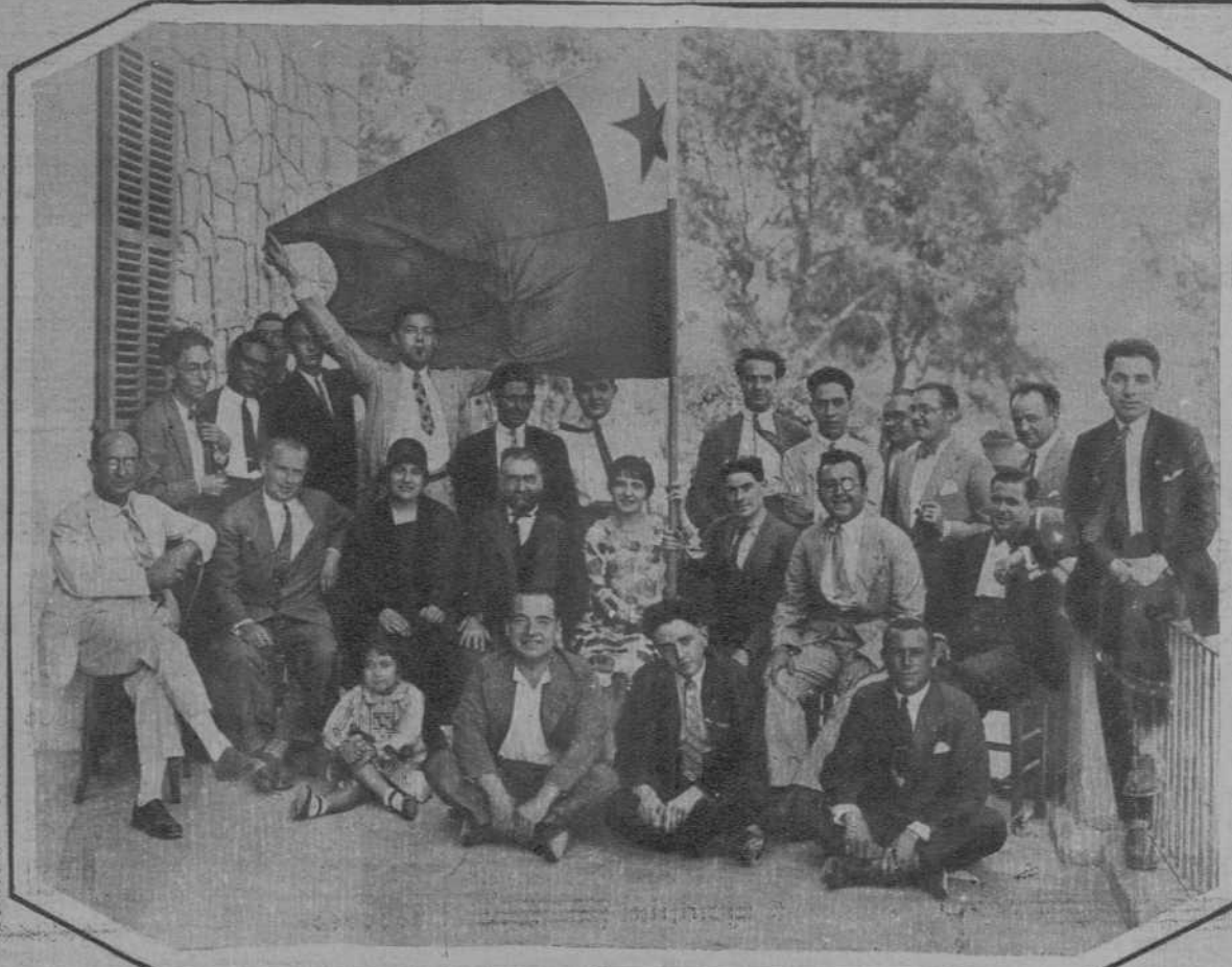
PALMA DE MALLORCA.—Grupo de socios del Esperanto Klub Palma, celebrando el XXI aniversario de la fundación de la entidad