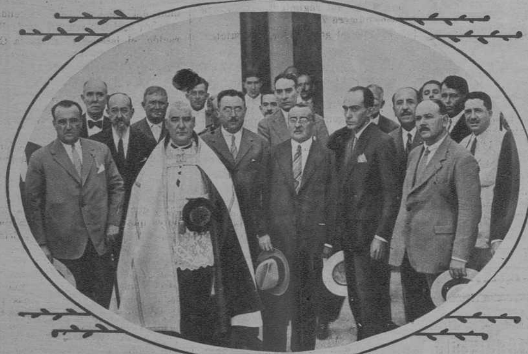
SEVILLA.—Inauguración en Gerena, del grupo escotar de niñas «García de Leánis»