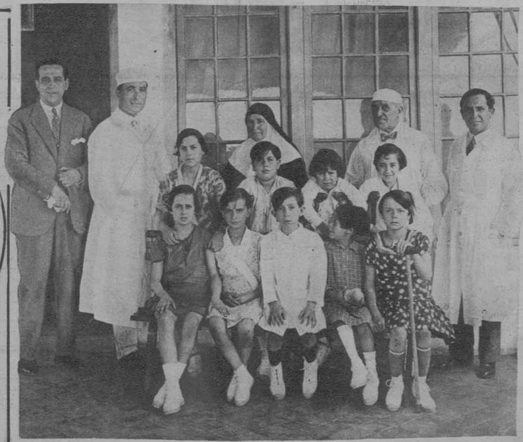
BARCELONA.—Niñas enviadas al Sanatorio Marítimo de Barcelona por el Real Patronato Antituberculoso de España