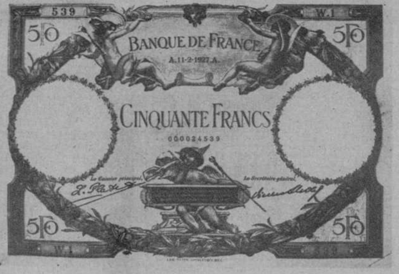
PARIS.—El nuevo billete de cincuenta francos puesto recientemente en circulación. (Fot. Consorcio).