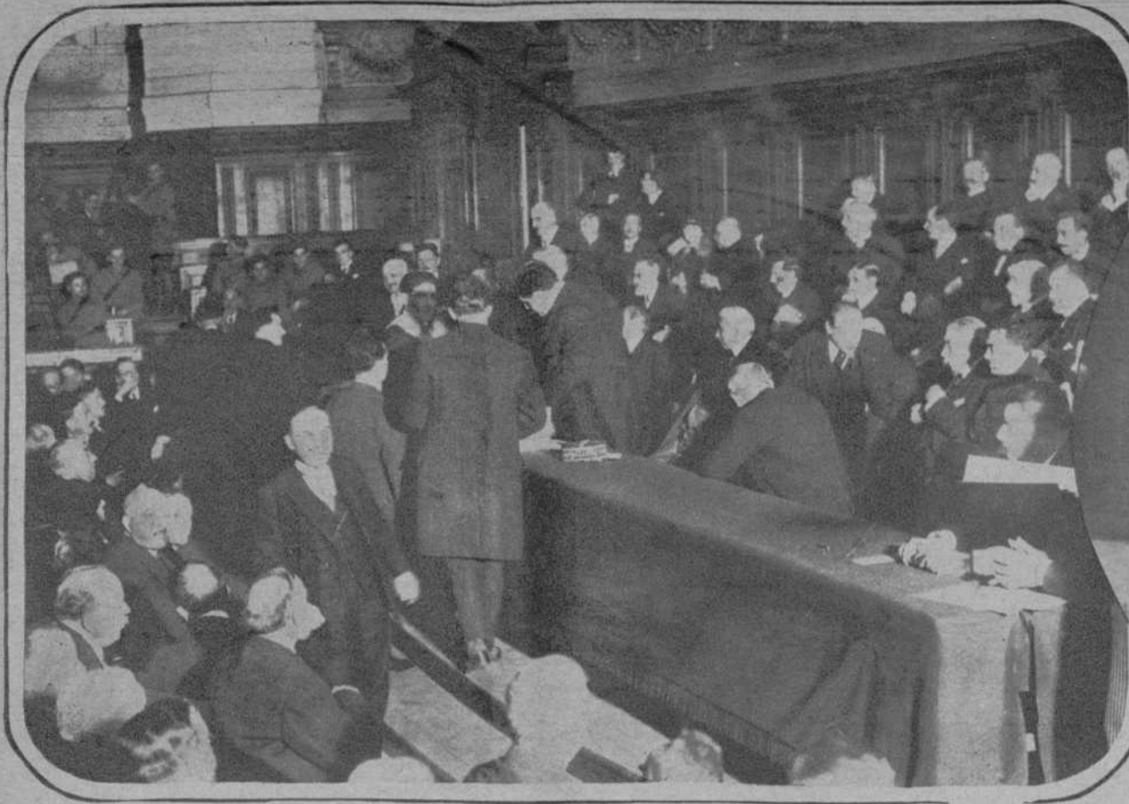
PARIS.—Reparto de recompensas en la Exposición nacional de los mejores obreros y los mejores aprendices de Francia.