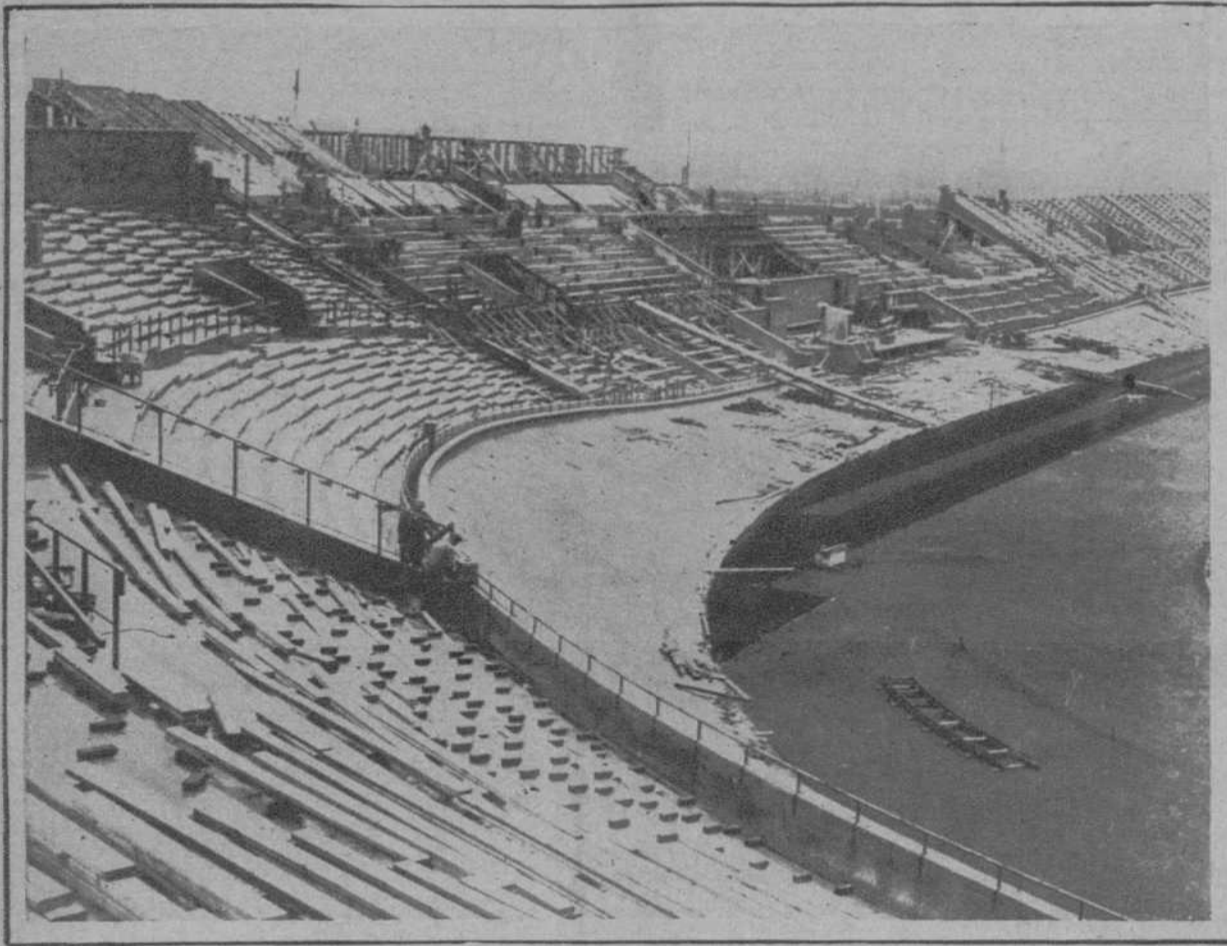
AMSTERDAM.—Un aspecto del estadio que se construye para los juegos olímpicos.