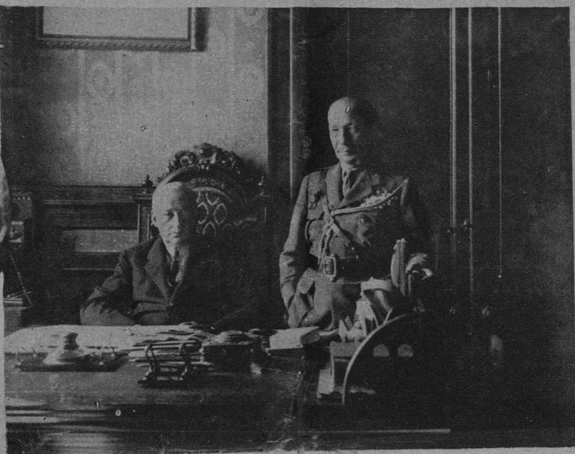
BARCELONA.—El marqués de Estella en Capitanía General, acompañado del general Barrera.