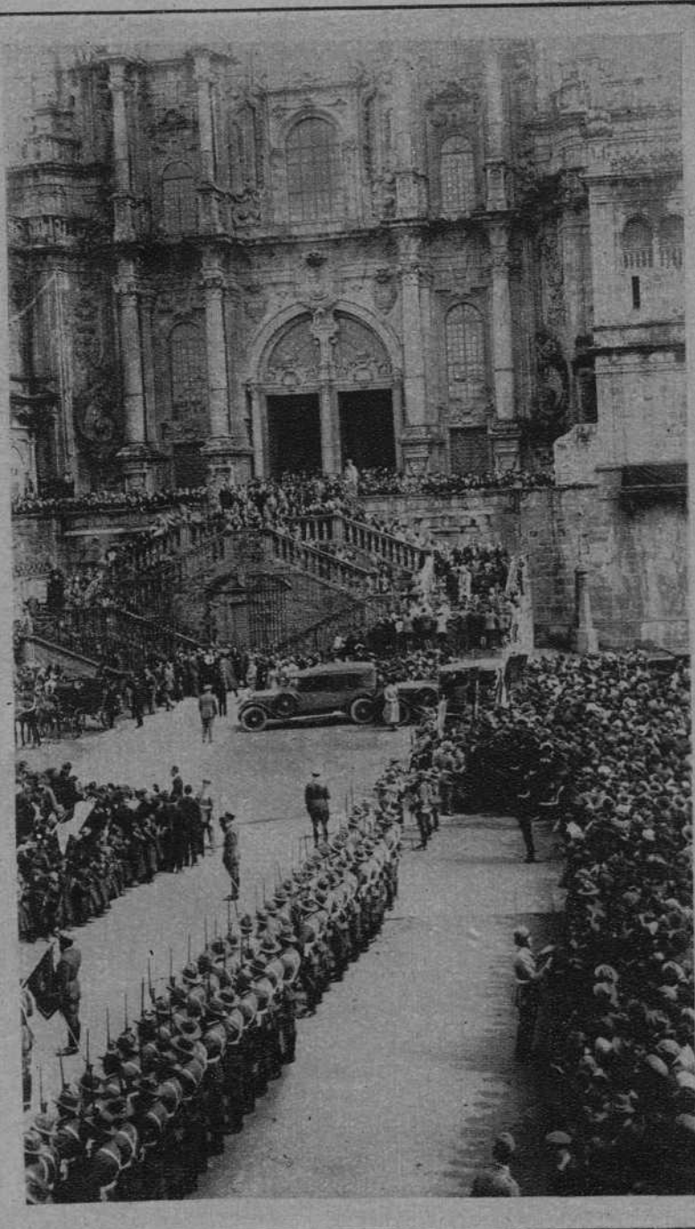
SANTIAGO (Galicia).—Aspecto de la Plaza de la Catedral a la salida de Sus Majestades.