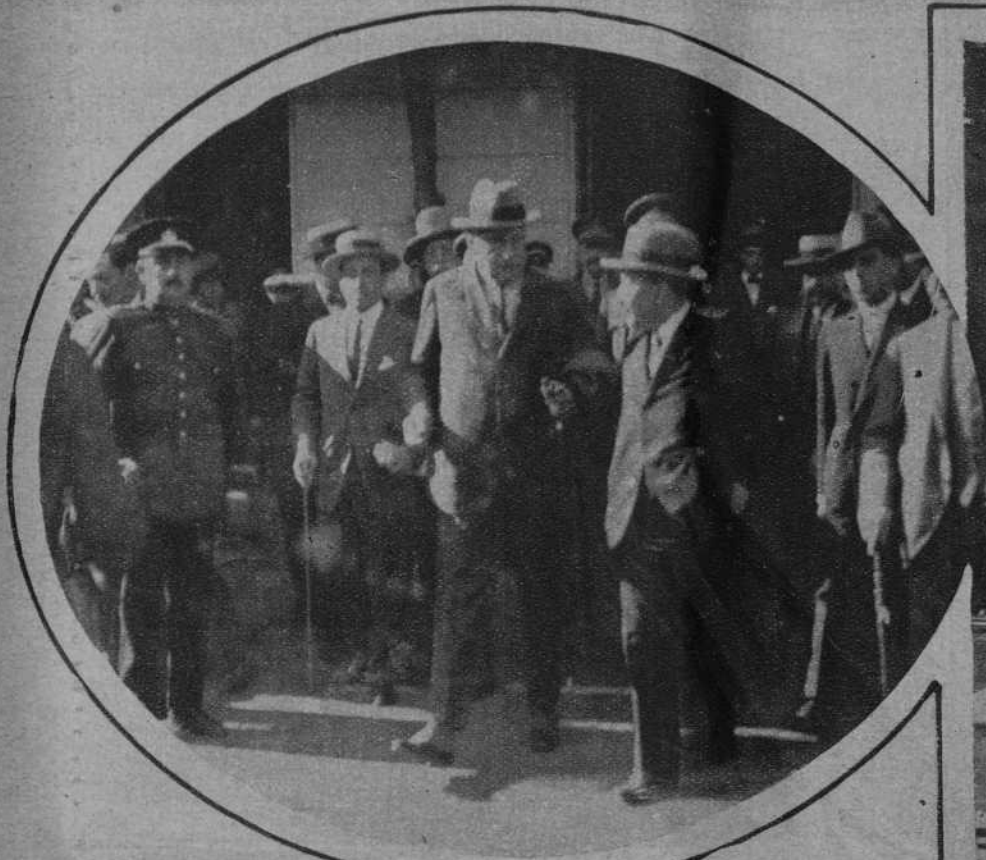
BARCELONA.—Llegada del general Primo de Rivera.

Barcelona, viernes 30 de Septiembre de 1927