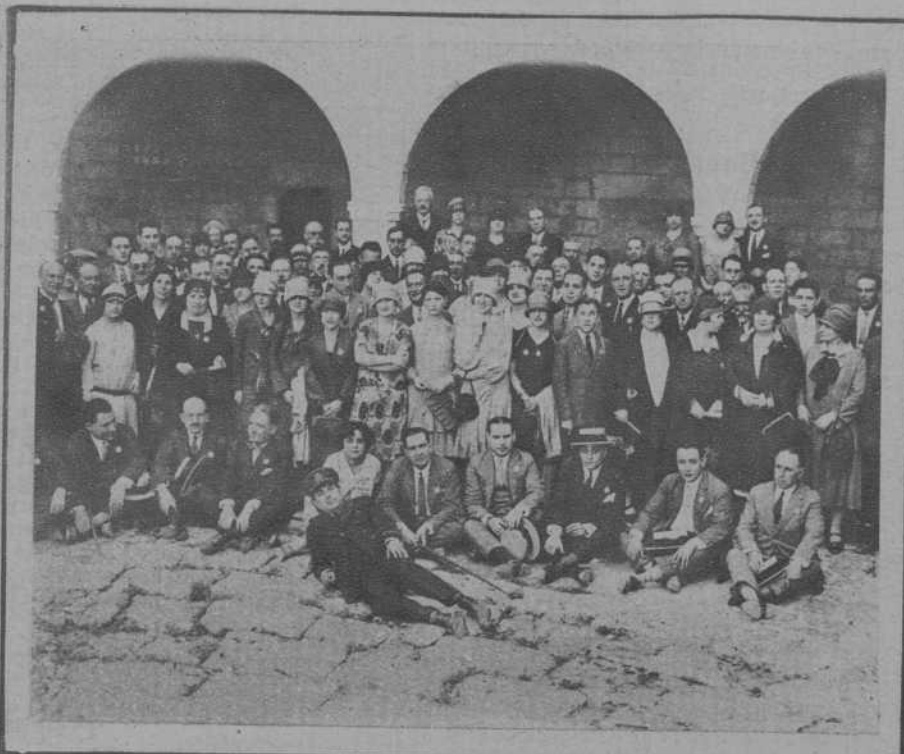
PALMA DE MALLORCA.—Grupo de concurrentes a la Asamblea de la Mancomunidad Farmacéutica Catalano-Balear, en el Patio de Armas del Castillo de Bellver. (Fot. Soler).