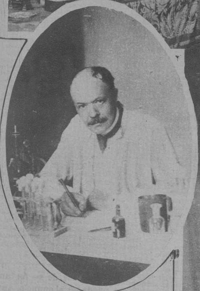
PARIS.—Mr Charles Nicolle, profesor del Instituto Pasteur, agraciado con el premio Osiris.