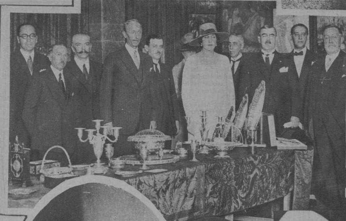
MADRID.—La Reina doña Victoria durante su visita a la Exposición de orfebrería portuguesa.