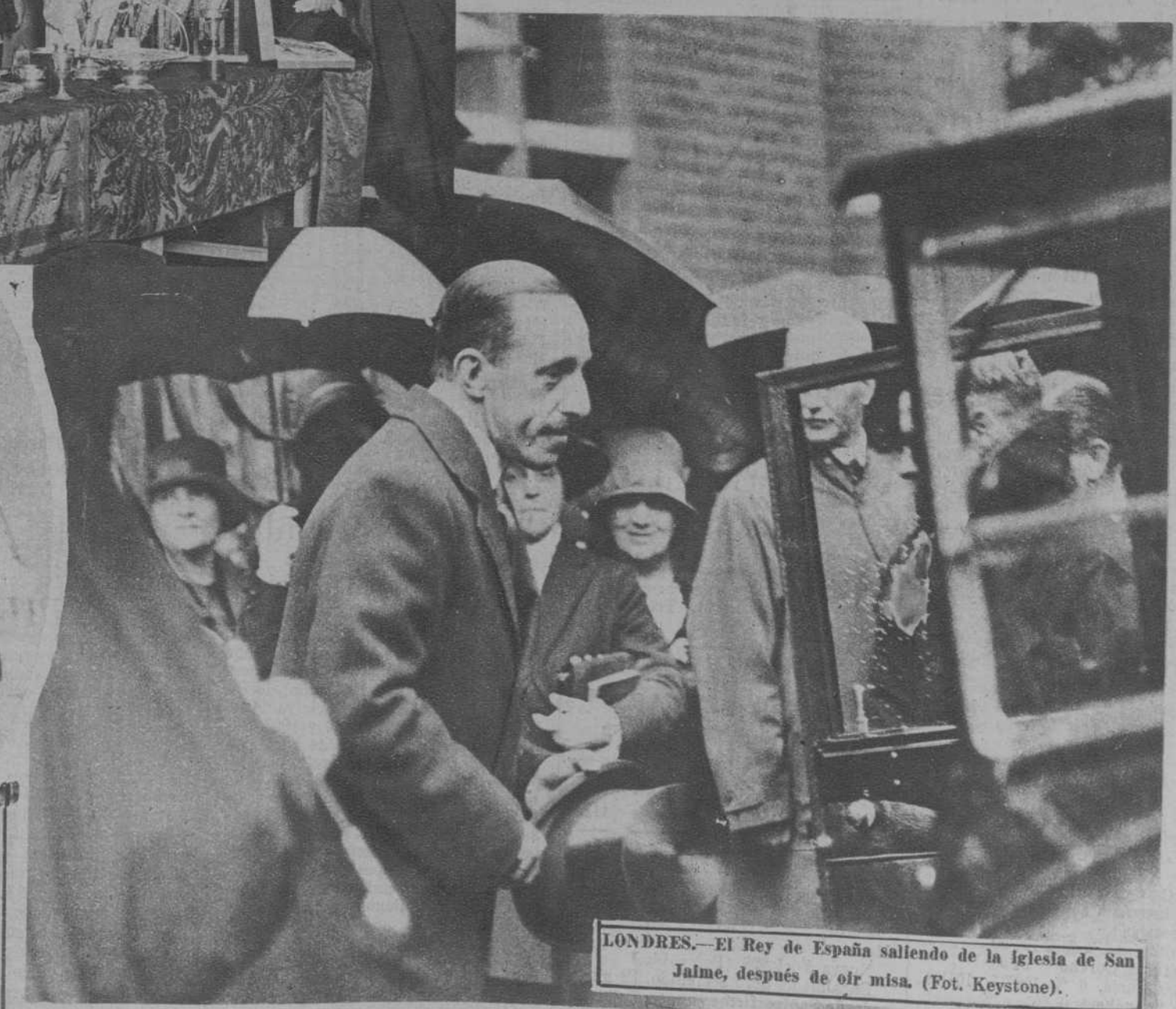
LONDRES.—El Rey de España saliendo de la Iglesia de San Jaime, después de oír misa. (Fot. Keystone).