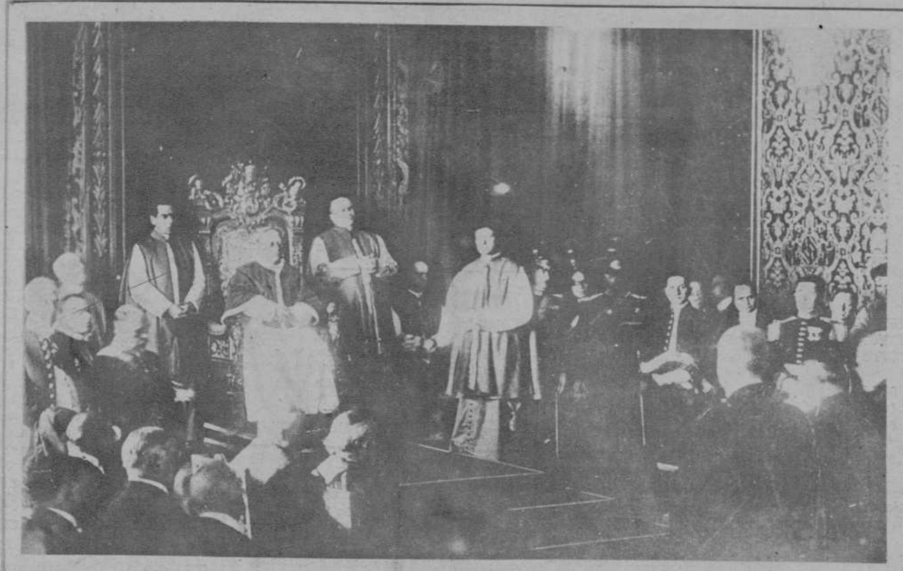
ROMA.—Recepción con motivo del séptimo aniversario del Sumo Pontífice).