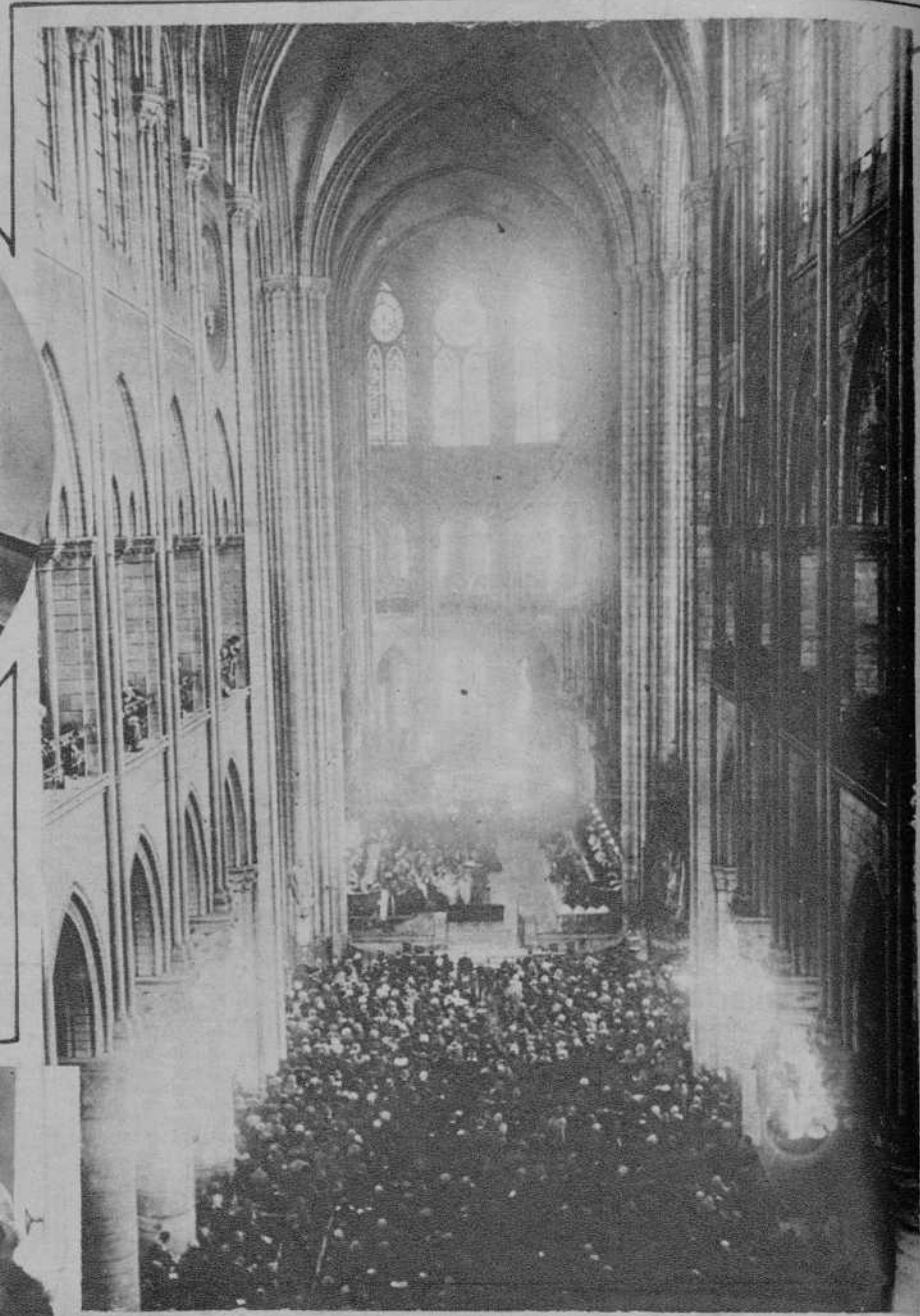
PARIS.—La misa en re de Beethoven fué cantada hace pocos días en la iglesia de la Magdalena en presencia del Nuncio y del Cuerpo diplomático. Vista de la nave durante el canto.