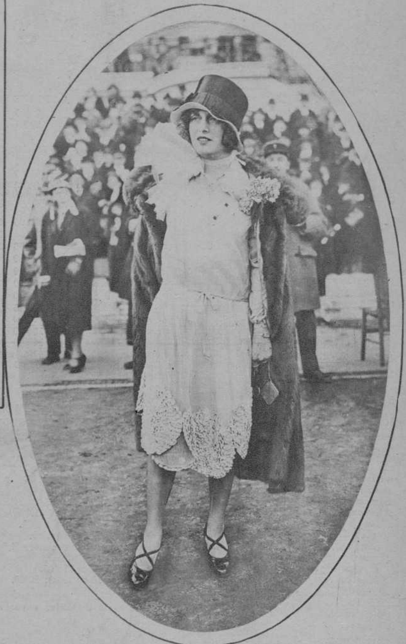
PARIS.—Las tolletes de verano han hecho su aparición en las carreras de Auteuil.