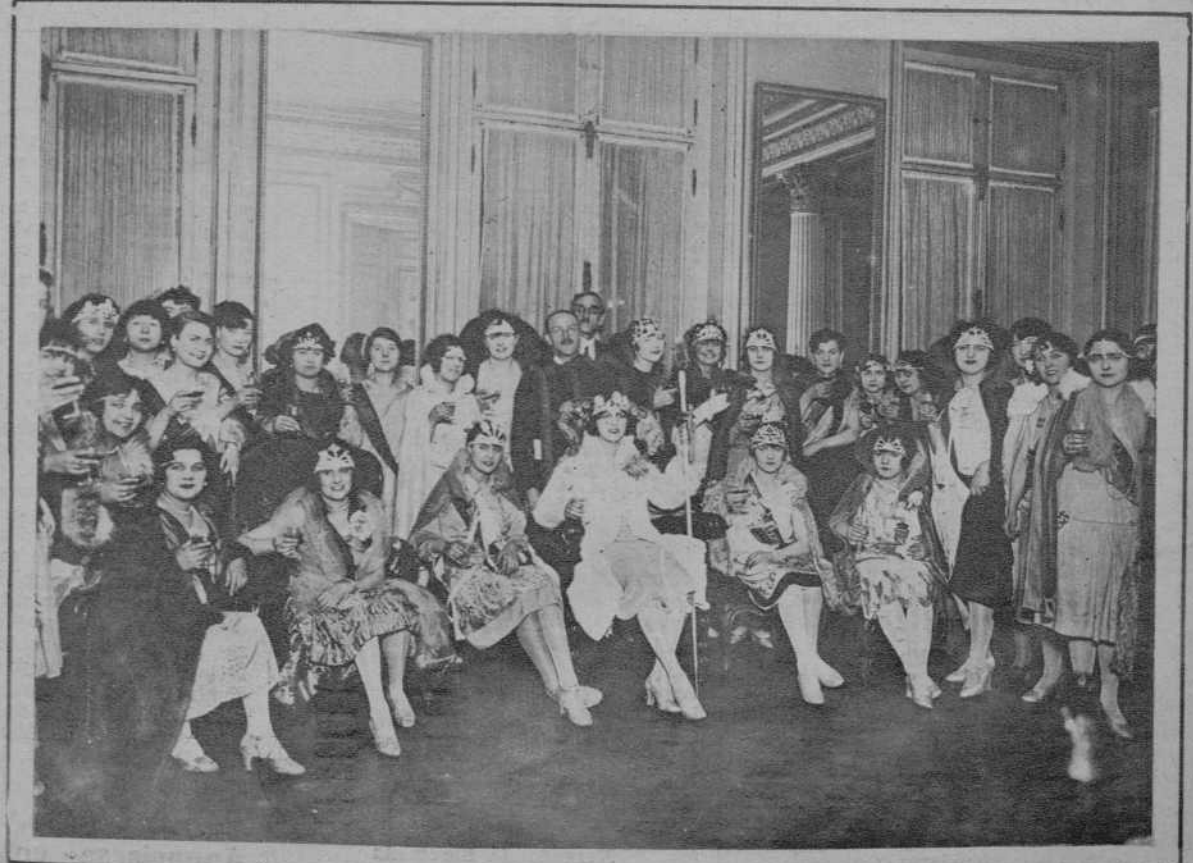
PARIS.—Todas las reinas de París reunidas en un grupo.