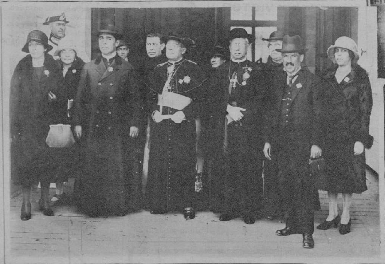
MADRID.—El obispo de Cuzco y el Vicario apostólico de Ucayali, acompañados de una representación de la peregrinación peruana que se encuentra en Madrid, al salir de Palacio después de haber sido recibidos por la Reina Cristina.