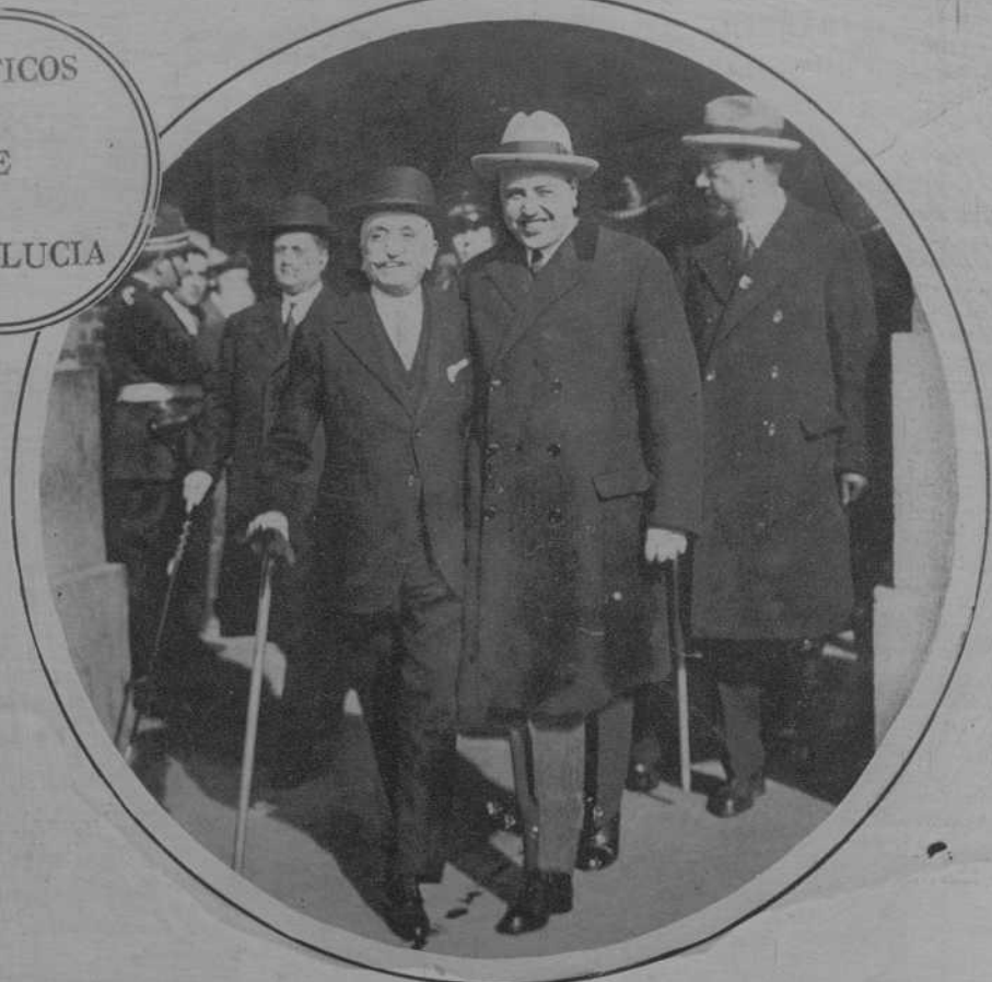
SEVILLA.—El ministro del Trabajo, señor Aunós, saliendo de la estación acompañado del ministro de Marina.