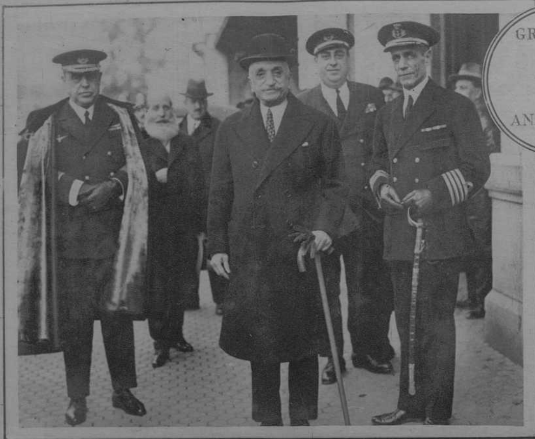
SEVILLA.—El ministro de Marina, señor Cornejo, con el comandante del Puerto de Sevilla, durante su visita a las obras del Canal de Alfonso XIII.