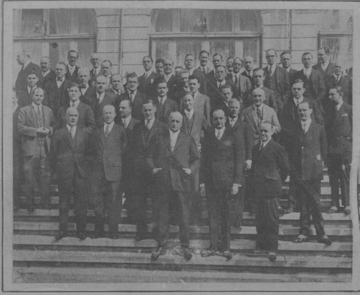
MADRID.—Concurrentes al banquete ofrecido por el «Club Americano» a su embajador Mr. Odgen Hammond. :: El general Primo de Rivera aparece a la derecha del embajador