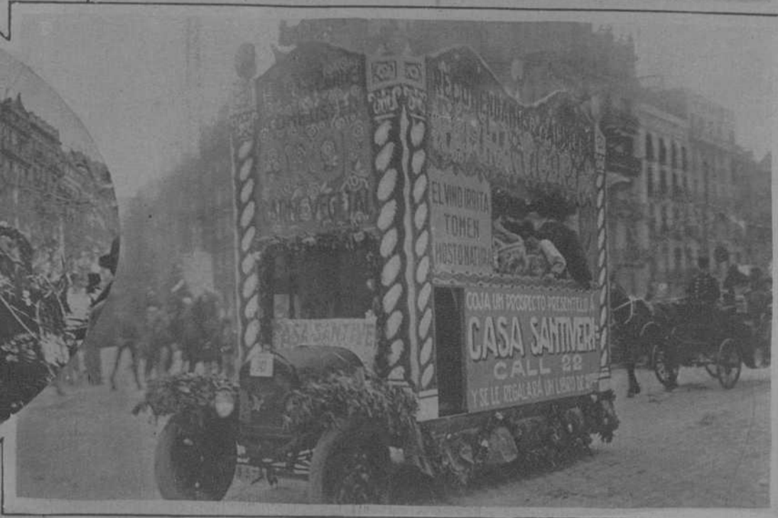
Artística carroza formada por atributos del famoso producto «ORON», sustituto de la carne, y los innumerables productos alimenticios Dietéticos y de Régimen, que produce la Casa SANTIVERI (Call, 22), la que ofrece medical y científicamente el apostolado de una verdadera institución.