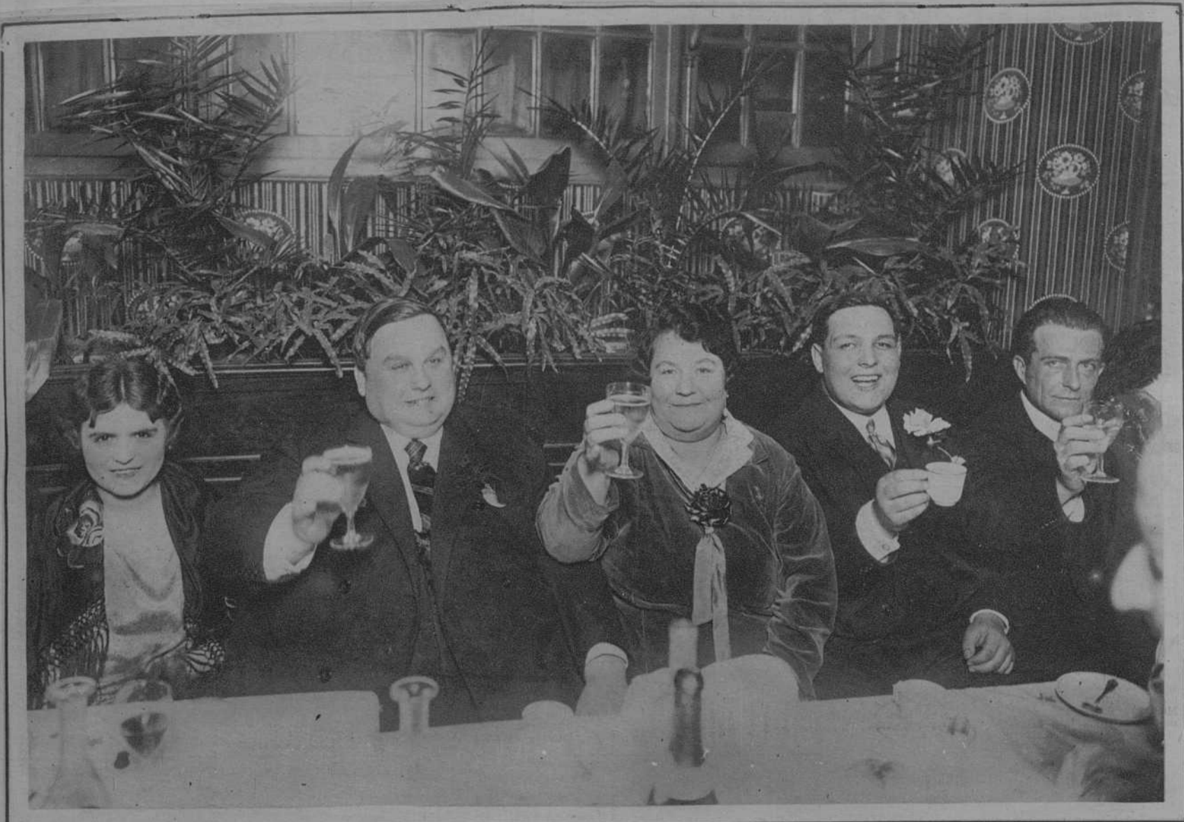
♦ ♦ ♦ PARIS.—PRESIDENCIA DEL BANQUETE DE «LOS CIEN KILOGRAMOS» QUE TUVO LUGAR HACE UN PAR DE DIAS EN EL RESTAURANT «FANTASIO» ♦ ♦ ♦