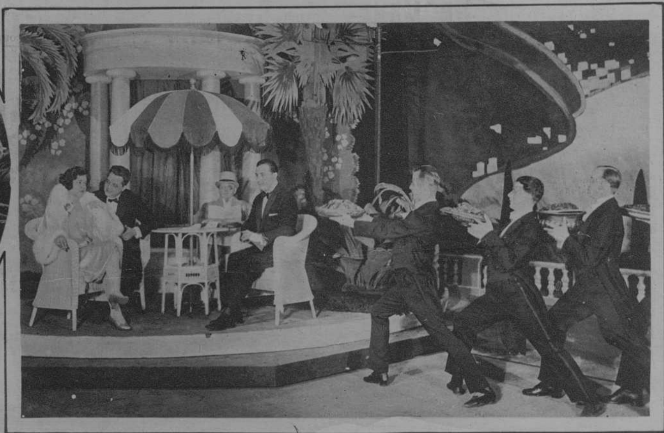
BERLIN.—Una escena de la opereta titulada «Royal Palace», que actualmente alcanza gran éxito en la capital del Reich