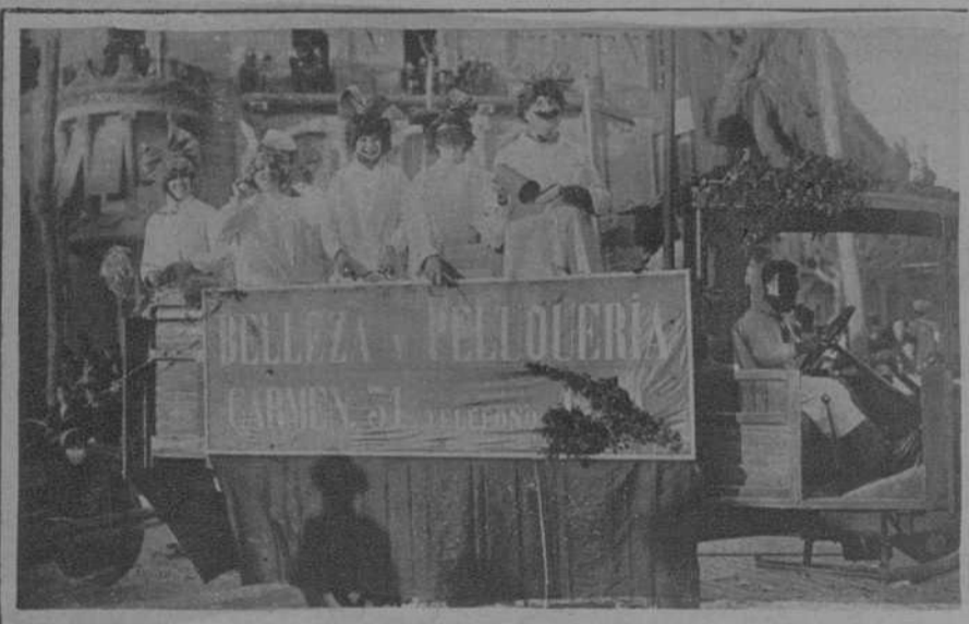
Con el sugestivo título de BELLEZA Y PELUQUERIA, presentó una atrayente carroza el Instituto de Belleza establecido en la calle del Carmen, 31, uno de los más importantes en el orden científico y de perfección mecánica de procedimientos.