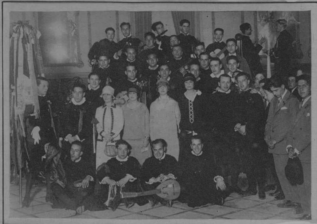
CORDOBA.—Los estudiantes de la Universidad de Salamanca en el acto de imposición de las corbatas donadas a su bandera por sus madrinas, las señoritas Fresneda, Montijano y Kindelán.