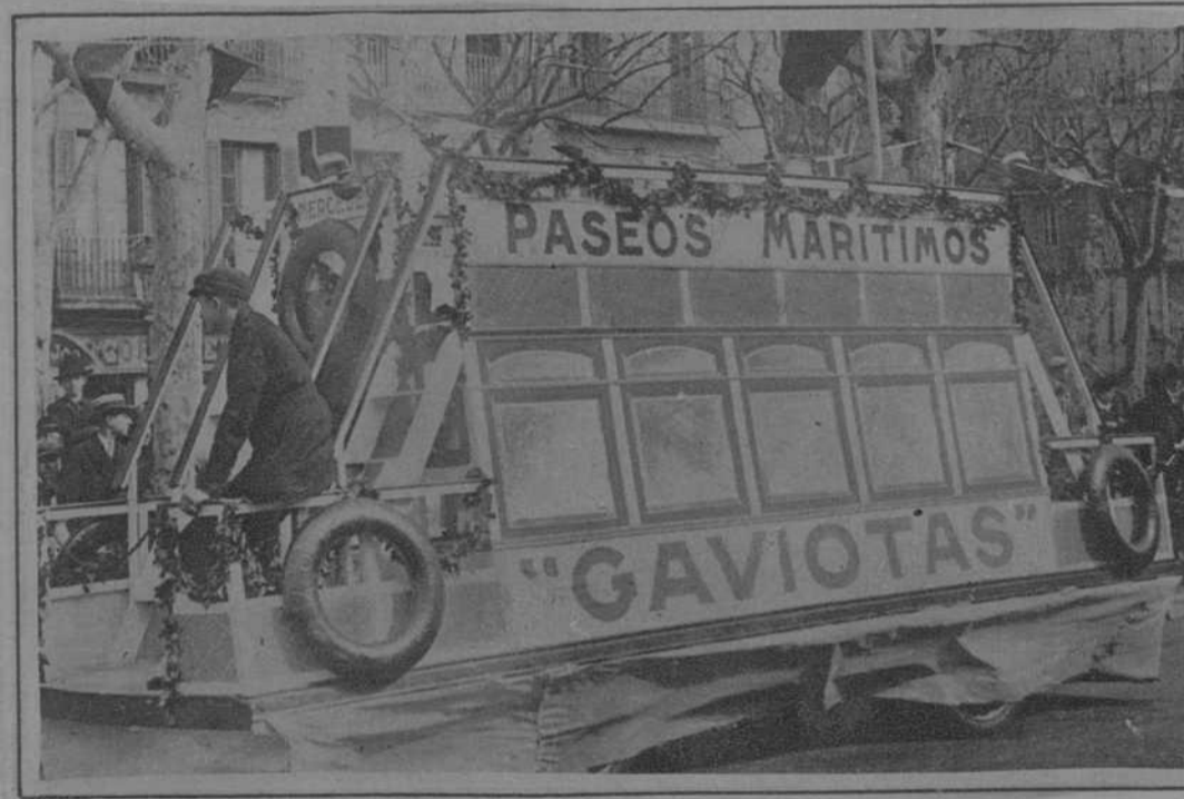
Monumental carroza representando con toda clase de detalles una GAVIOTA de nuestro puerto, presentada por la nueva «Empresa Gaviotas, S. A.», y que llamó poderosamente la atención.