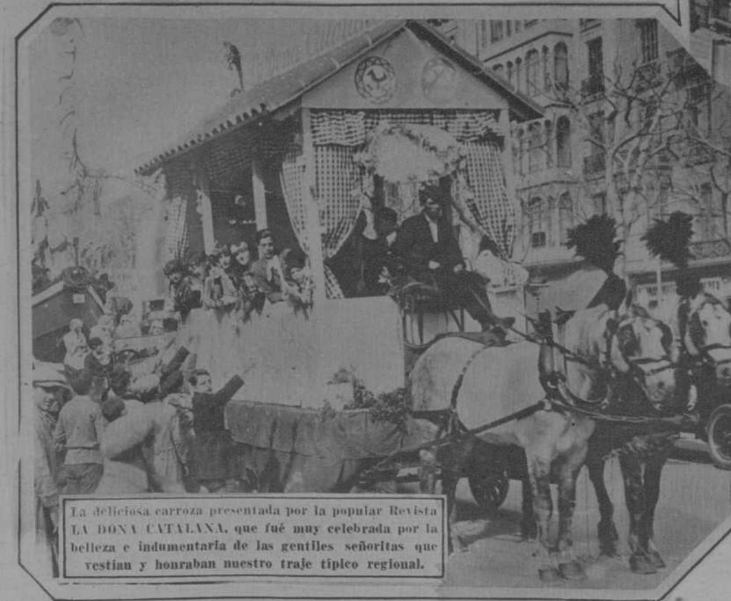
La deliciosa carroza presentada por la popular Revista LA DONA CATALANA, que fué muy celebrada por la belleza e indumentaria de las gentiles señoritas que vestían y honraban nuestro traje típico regional.