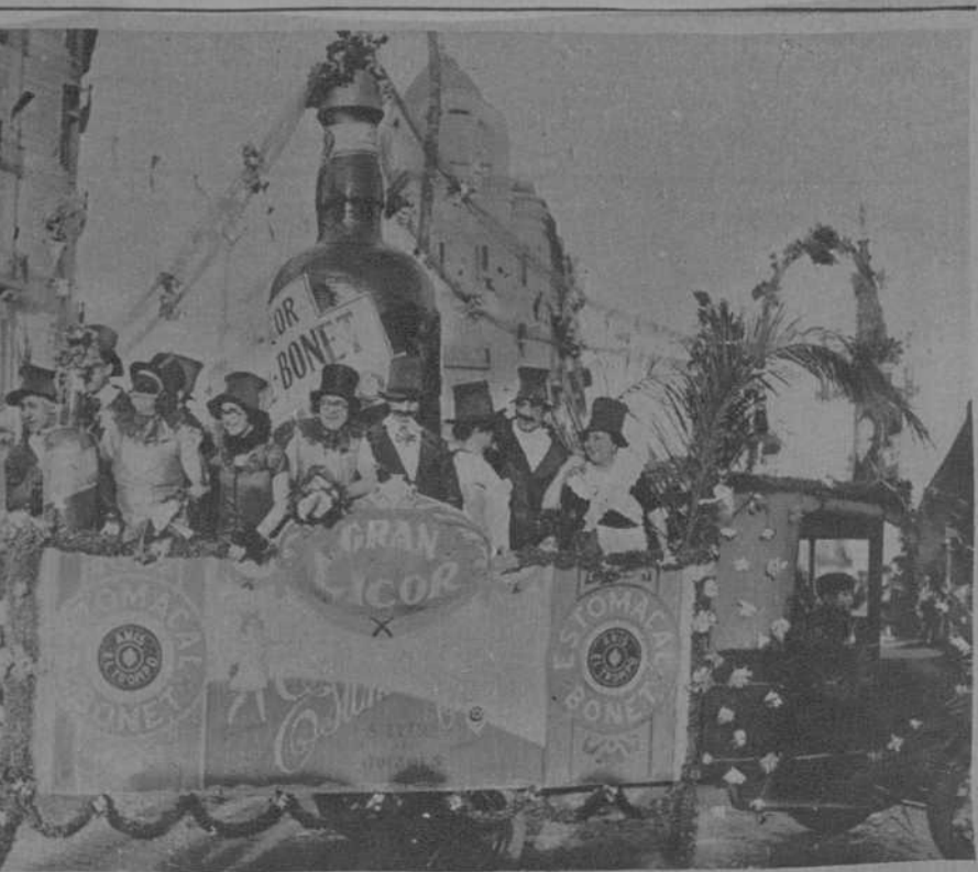
Carroza presentada por la casa productora del delicioso «Estomacal Bonet», en la que figuraba una soberbia botella del licor cuya fama ha batido el record de la supremacía.