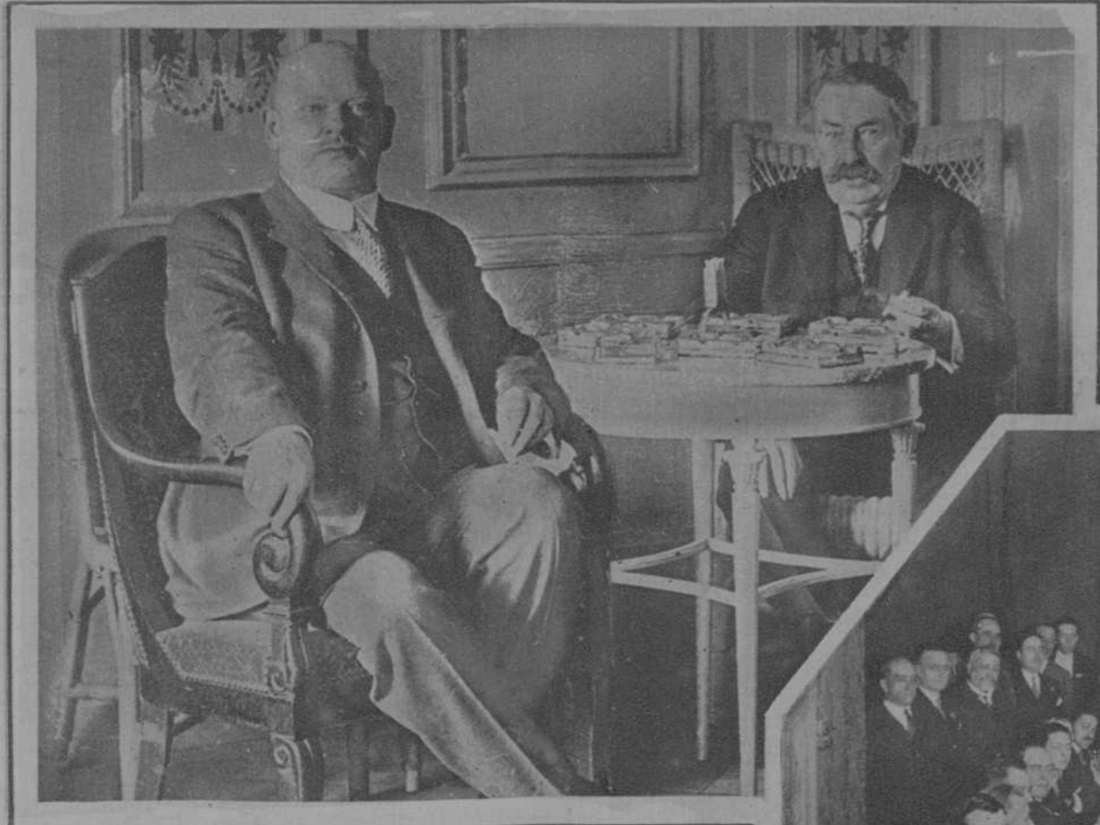
GINEBRA.—M. Briand y Herr Stressemann celebrando una conferencia privada antes de la 44 sesión de la Sociedad de Naciones