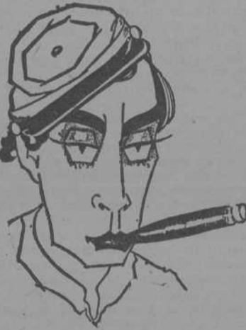
BUSTER KEATON ("Pamplinas")

Hechos históricos llevados a la pantalla en «Tres hombres malos»