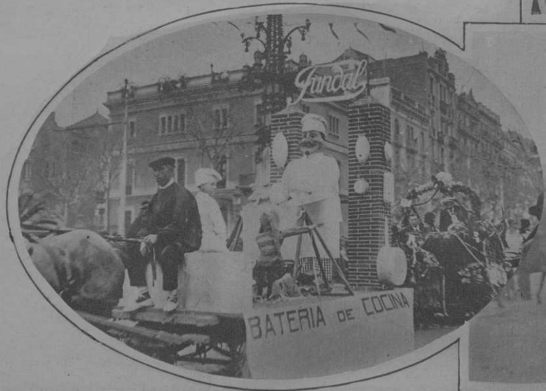
Una de las carrozas que más se distinguieron por su originalidad, fué la presentada por «Fundación y Construcciones Grau, S. A.», anunciando los artículos de aluminio fundido marca FUNDAL, únicos fabricantes en Europa de dichos artículos.