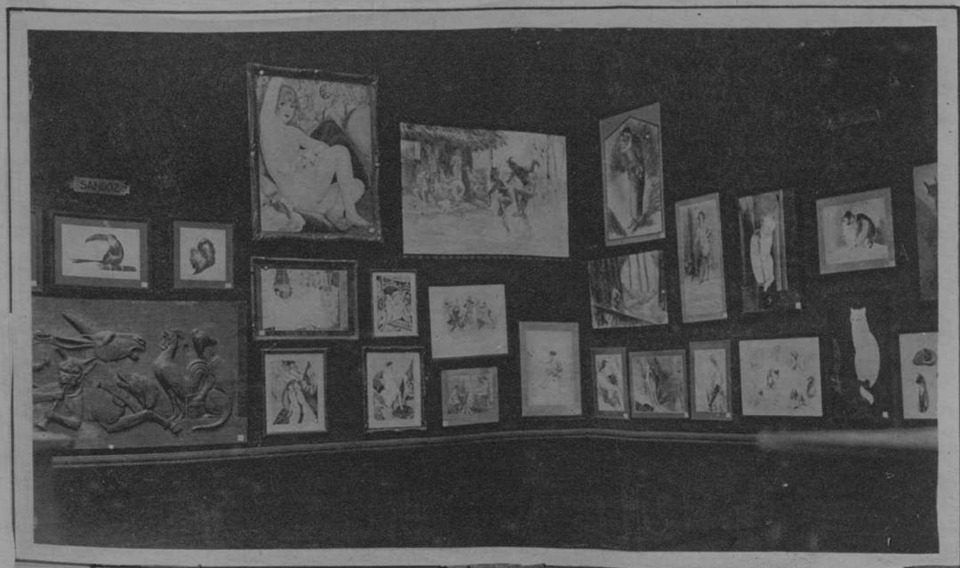
♦ ♦ ♦ PARIS.—Una de las salas del Salón de Humoristas, cuyas puertas acaban de abrirse en la capital de Francia. ∴ La fantasía y el humorismo se encuentran reunidas en este Salón, que por veinte vez se celebra, con su acostumbrado éxito