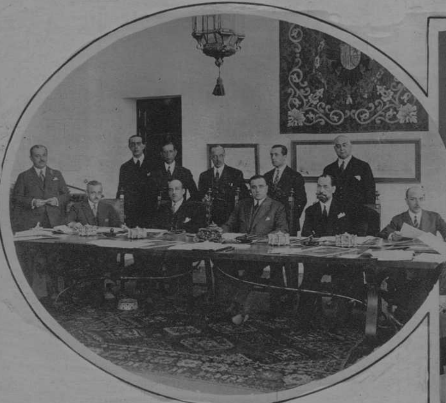
SEVILLA.—El ministro del Trabajo, señor Aunós, presidiendo la primera reunión del Consejo de Enlace de las Exposiciones españolas, en el Gran Hotel Alfonso XIII.