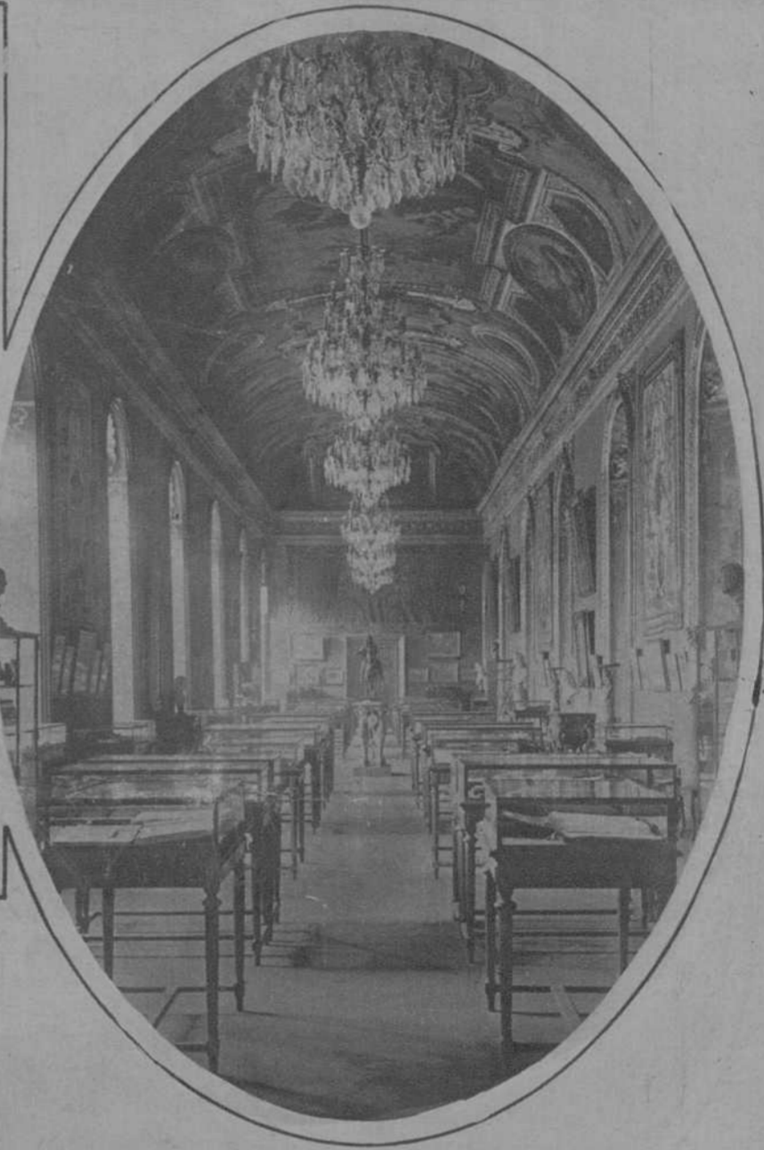
PARIS.—La galería Mazarin, en la Biblioteca Nacional, actualmente convertida en sala de exposición de objetos y curiosidades del siglo XV