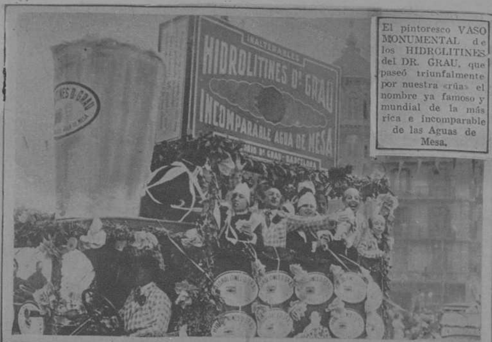
El pintoresco VASO MONUMENTAL de los HIDROLITINES del DR. GRAU, que pasó triunfalmente por nuestra «ría» el nombre ya famoso y mundial de la más rica e incomparable de las Aguas de Mesa.