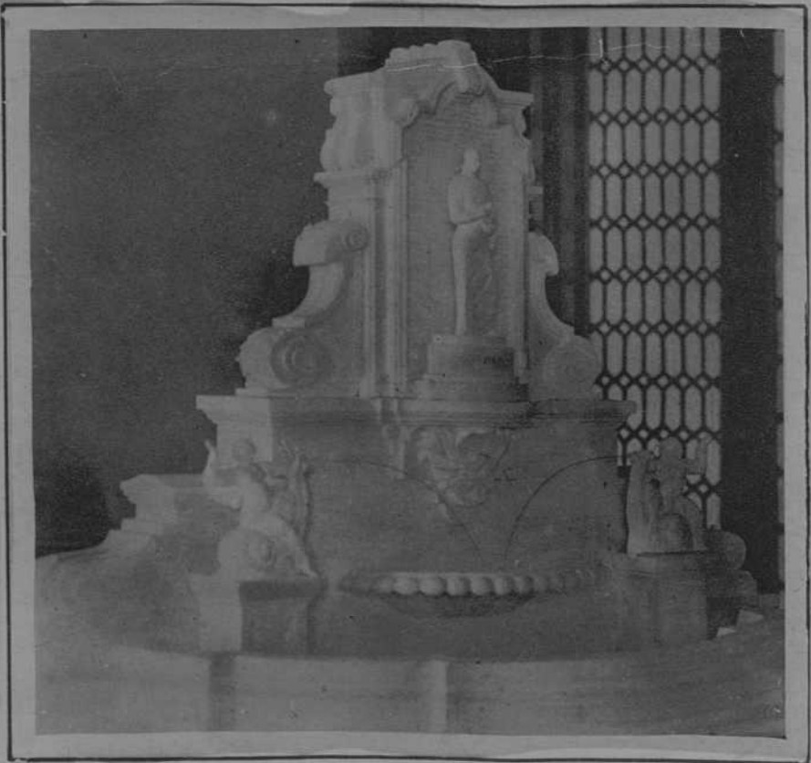
CORDOBA.—Proyecto de monumento al gran poeta cordobés don Luis de Góngora, cuyo centenario se conmemorará en el próximo mes de mayo.