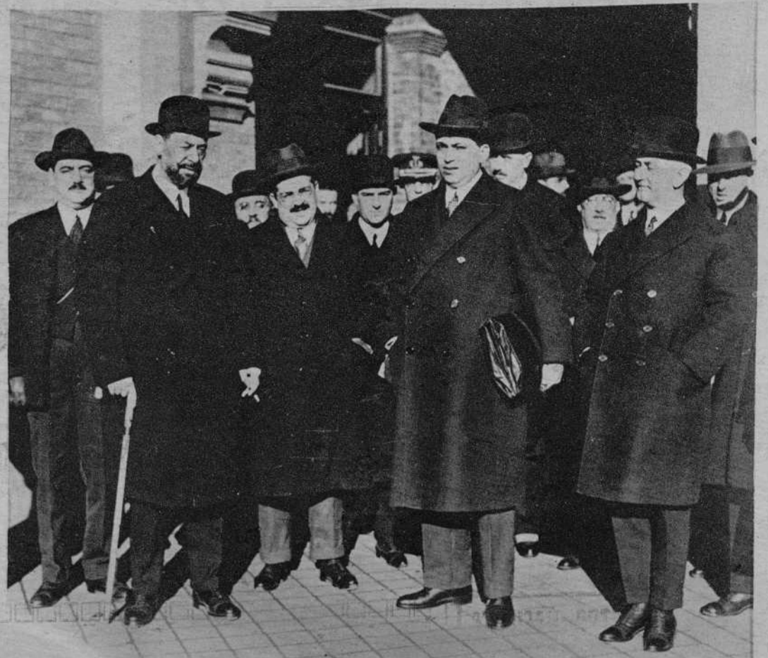
SEVILLA. — El ministro de Hacienda señor Calvo Sotelo saliendo de la estación acompañado del alcalde señor conde del Bustillo