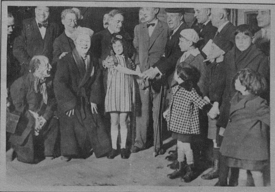
PARIS. Fiesta organizada por la República de Montmartre en honor de los petits Poulbots. Se reconocen en el grabado el artista Branem, con su sombrero negro y los dos Fratellinis, en sus trajes de clown