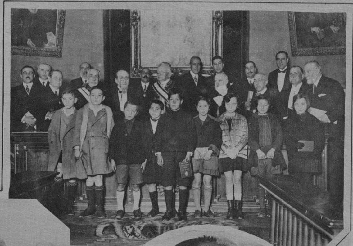
MADRID. REPARTO DE PREMIOS A LOS NIÑOS DE LAS ESCUELAS PUBLICAS, CON MOTIVO DE LA APERTURA DE CURSO DE LA REAL ACADEMIA DE MEDICINA