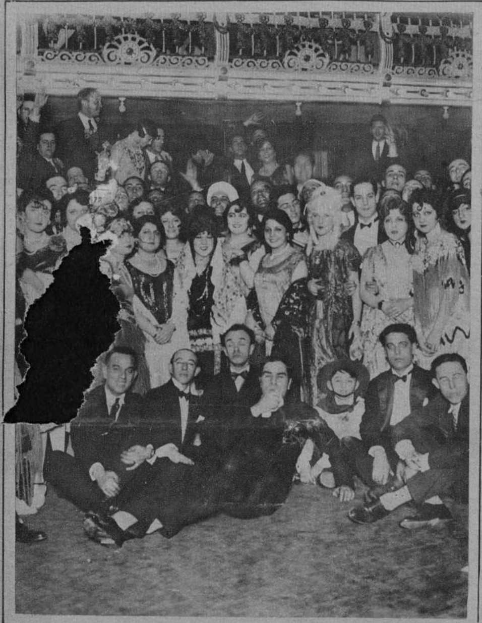
MADRID. UN GRUPO DE CONCURRENTES AL BAILE CELEBRADO EN EL TEATRO DE LA ZARZUELA POR LOS ARTISTAS CINEMATOGRAFICOS