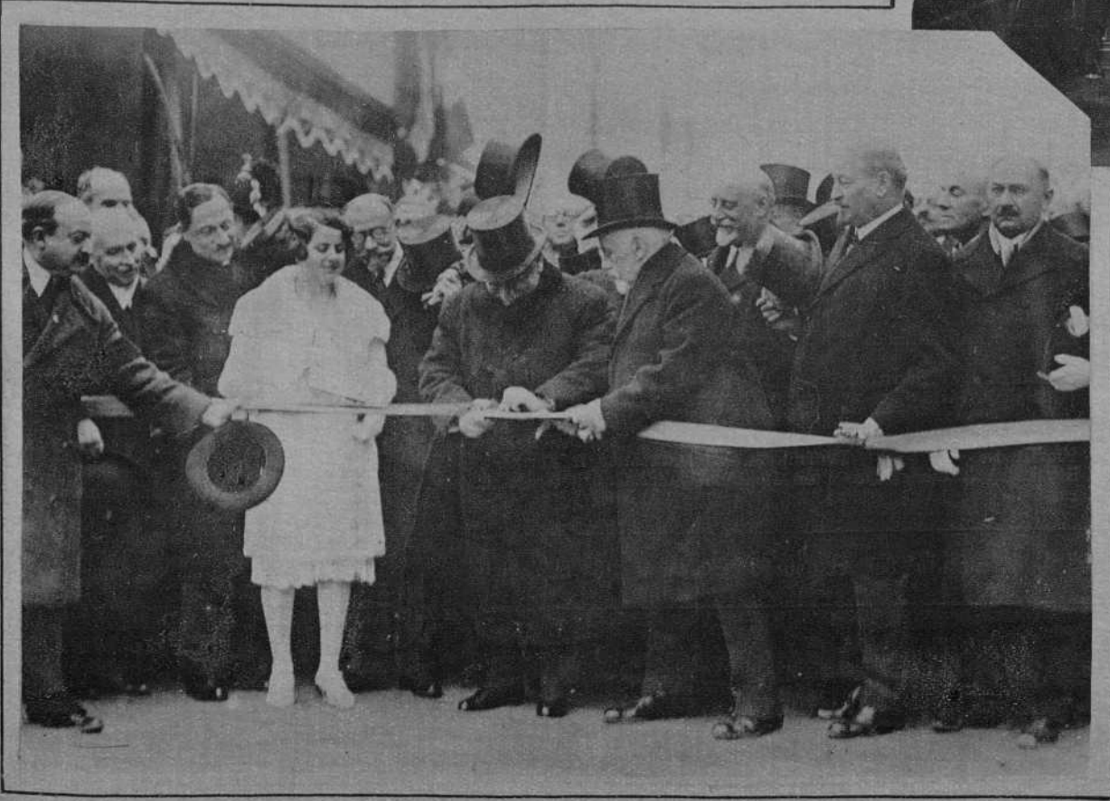
PARIS. EL PRESIDENTE DE LA REPUBLICA CORTANDO LA CINTA SIMBOLICA DEL NUEVO TRAYECTO DEL BOULEVARD HAUSMANN, EN EL ACTO DE SU INAUGURACION