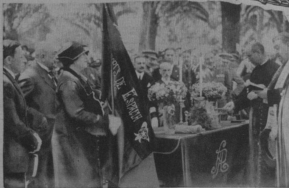
Málaga: El Obispo bendiciendo la bandera de los Exploradores de España. (J. Aguilera)