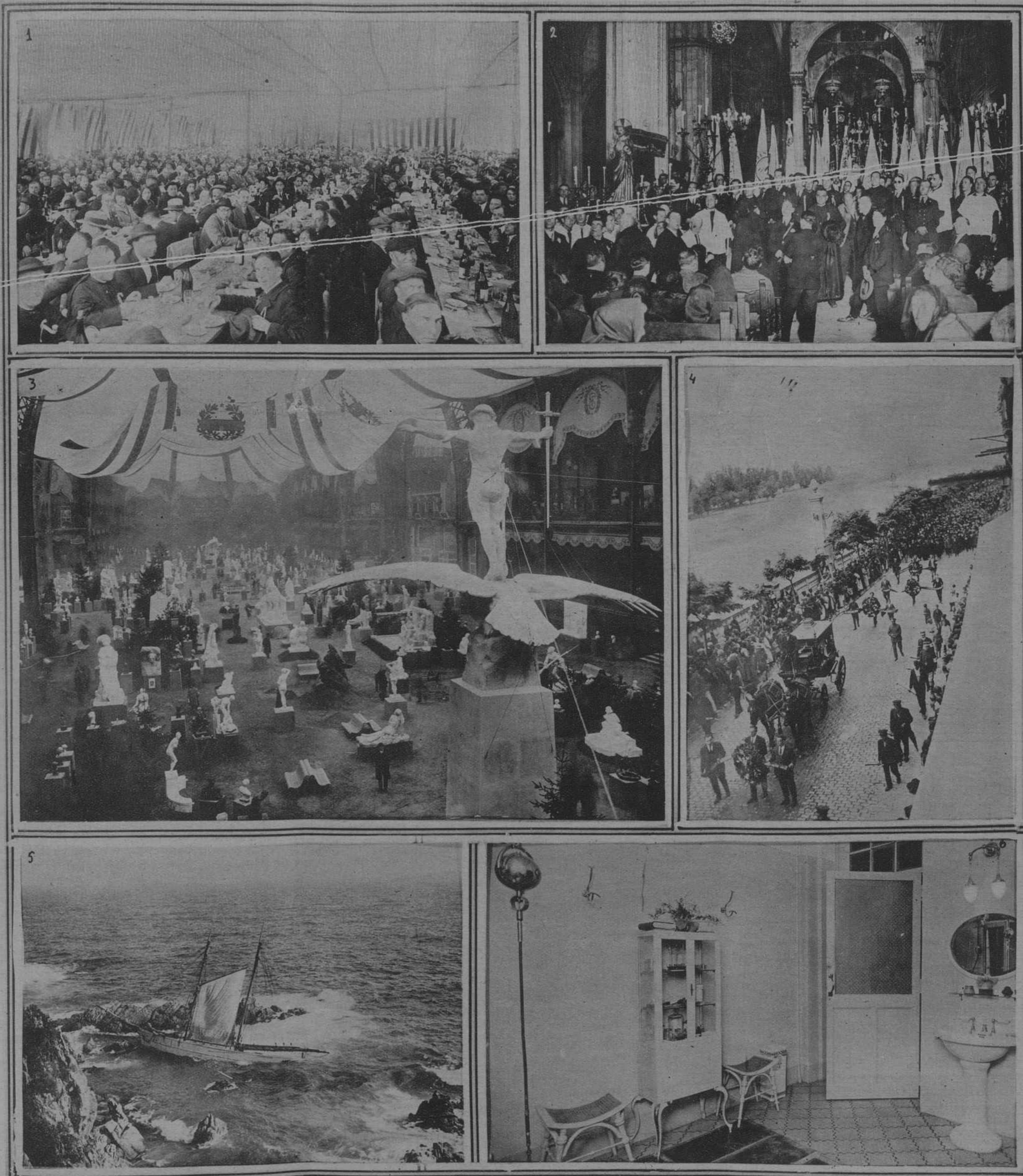
Cervera. II Asamblea de la Obra de ejercicios espirituales. 1. Aspecto del banquete de germanor, en el que asistieron más de 5.000 comensales. - 2. Acto de clausura de la Asamblea. - París. 3. Una vista del Salón de Artistas Franceses, que acaba de inaugurarse. - 4. Cervera. Entierro de los tres desgraciados obreros que perecieron asfixiados en un lagar.. 5. Loreto de Mar. La bañadora "Nuevo Barro" que embarcaron días pasados en la "Gala Bullens".. 6. Barcelona. Un detalle del elegante gabinete de consulta que en la Plaza de Cataluña n.º 9, posee la experta cirujana-callista D.ª V. Solé.