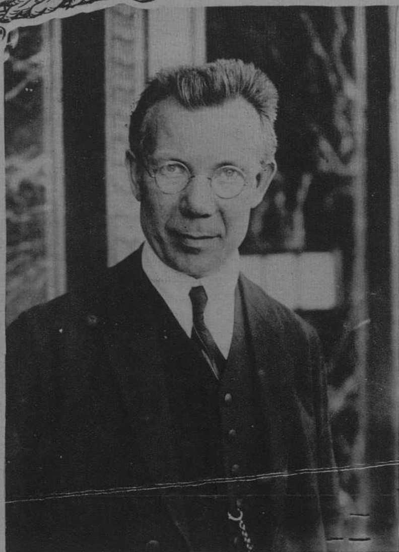
El sabio alemán Neuss, que se encuentra en España realizando importantes estudios históricos. (J. Vidal)