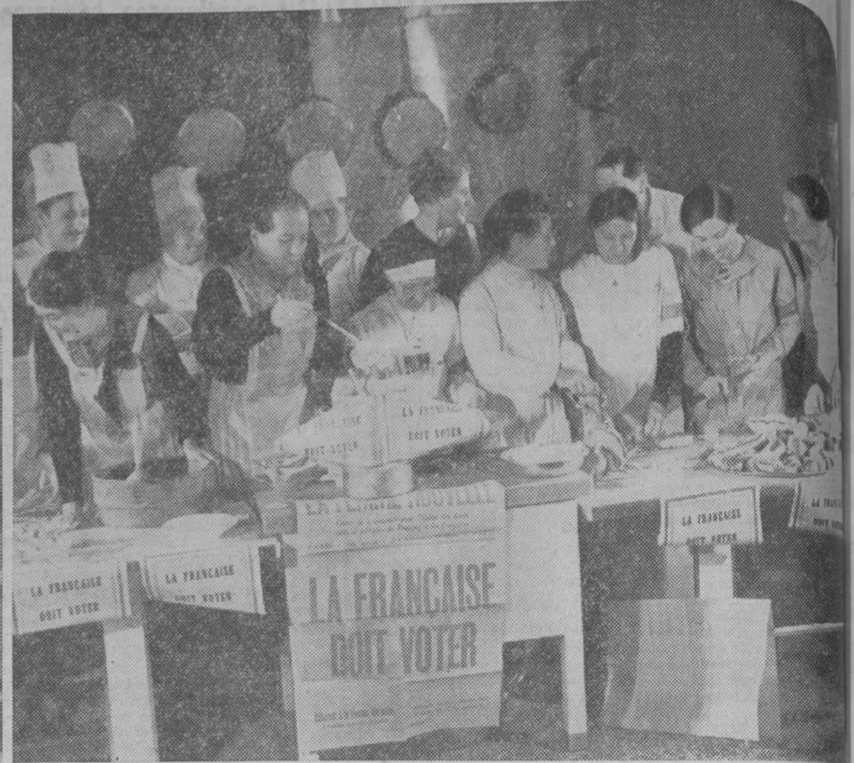
Para demostrar que la actividad política no es incompatible con la buena dirección del hogar, la presidenta y otras afiliadas del partido femenino francés han organizado a los periodistas con una comida preparada por ellas mismas