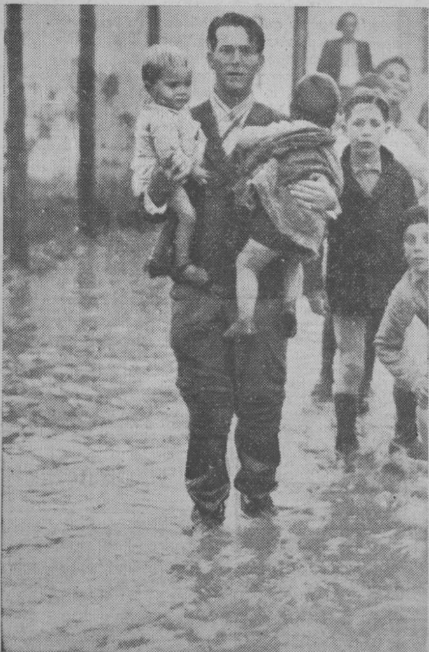
Sobre Sevilla ha descargado un furioso temporal que puso en grave riesgo a numerosos vecinos de los barrios extremos. Arriba, salvamento de unos niños en el barrio del Aguilá. A la derecha y abajo, destrozos causados en San Juan de Aznalfarache, donde el agua derrumbó varias casas y arrasó otras totalmente