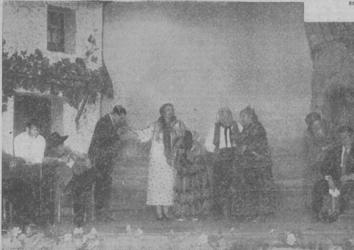
He aquí una escena de la obra «La princesa gitana», cuyo estreno se verificará esta noche en el teatro Chueca