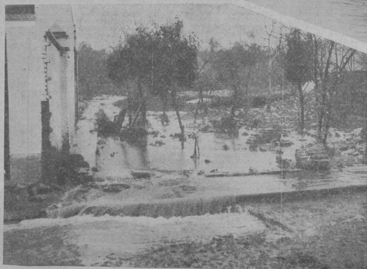
También en Córdoba, y a consecuencia de las lluvias torrenciales, se desbordó el Arroyo de las Piedras. El agua inundó el barrio de Marrubial y cortó la carretera general de Madrid. Las viviendas tuvieron que ser desalojadas