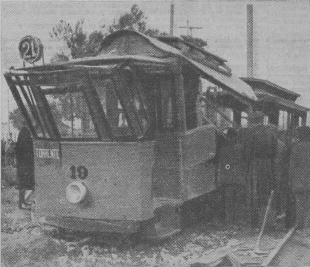
Estado en que quedó el tranvía de la línea de Torrente que fué alcanzado por el tren. A la izquierda, v a r i o s obreros abriéndose paso con sopletes, para extraer los cadáveres de las tres víctimas