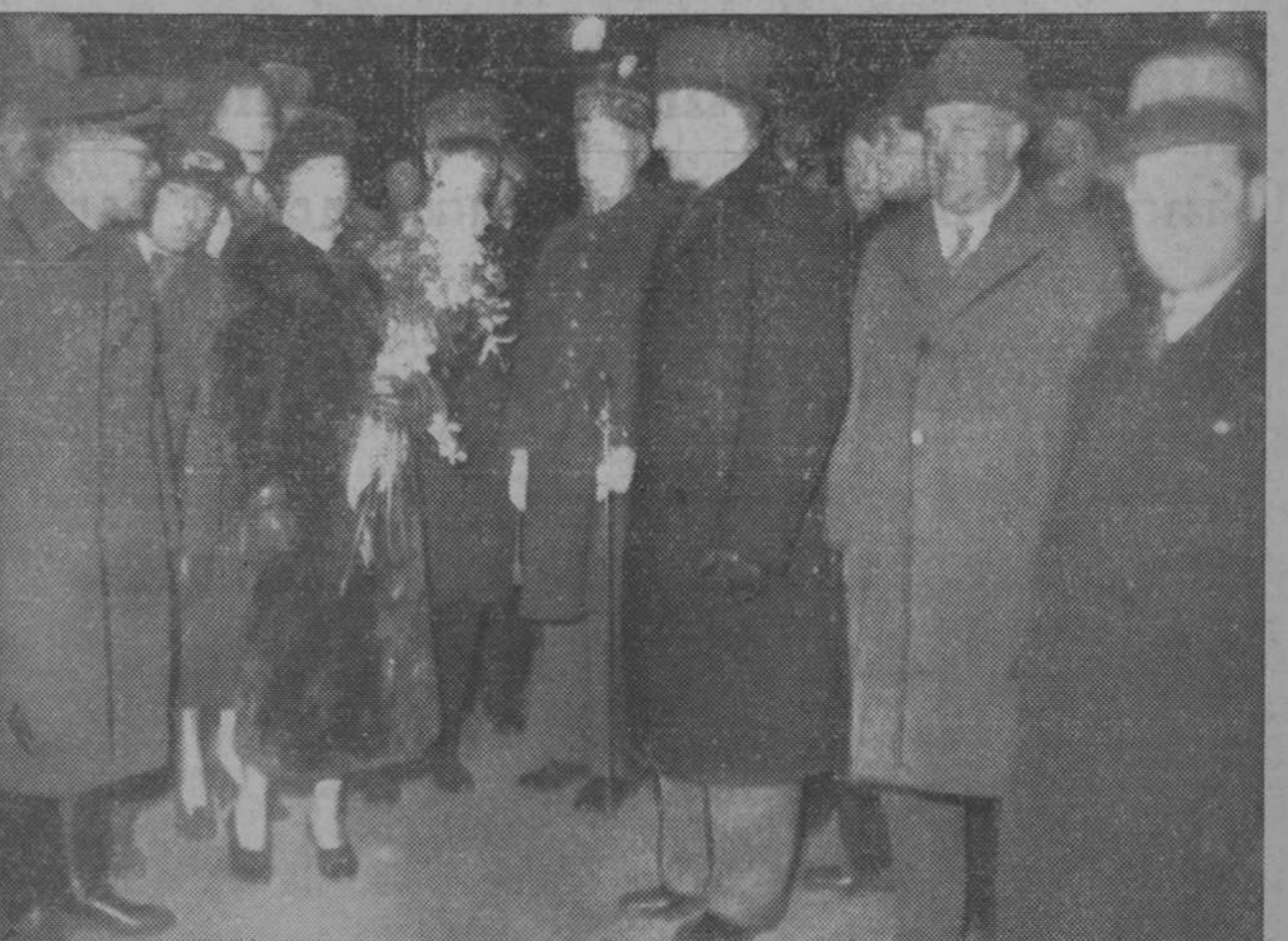
Aquí está Tukhatchewsky, mariscal ruso, uno de los jefes del Ejército rojo, a su llegada a París. Le acompaña su señora, vestida con rico abrigo de pieles. Comparada esta fotografía con el retrato de Stakanov que publicamos días atrás se ve que entre los comunistas tiene mucha cuenta ser mariscal que trabajar a destajo. Para llegar a esta notoria y ruda diferencia de clases, mucho más acentuada que la que se observa en cualquier país burgués moderno, predica el comunismo una sangrienta revolución destructora. Claro que los predicadores pensarán en ser mariscales y los obreros tendrán que hacer el Stakanov. Los pocos obreros a quienes el hambre y la tiranía consistían alguna vez el gozo de contemplar los abrigos de pieles sobre los hombros de las compañeras mariscales