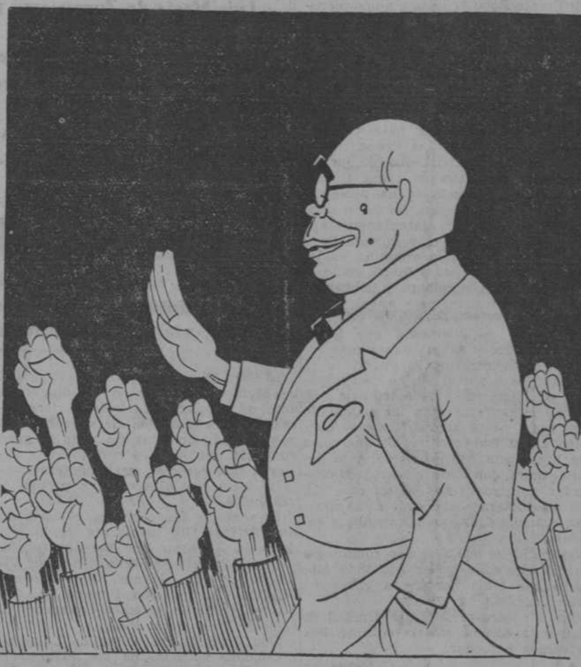
—No seáis así. Olvidad de una vez lo de Casas Viejas.