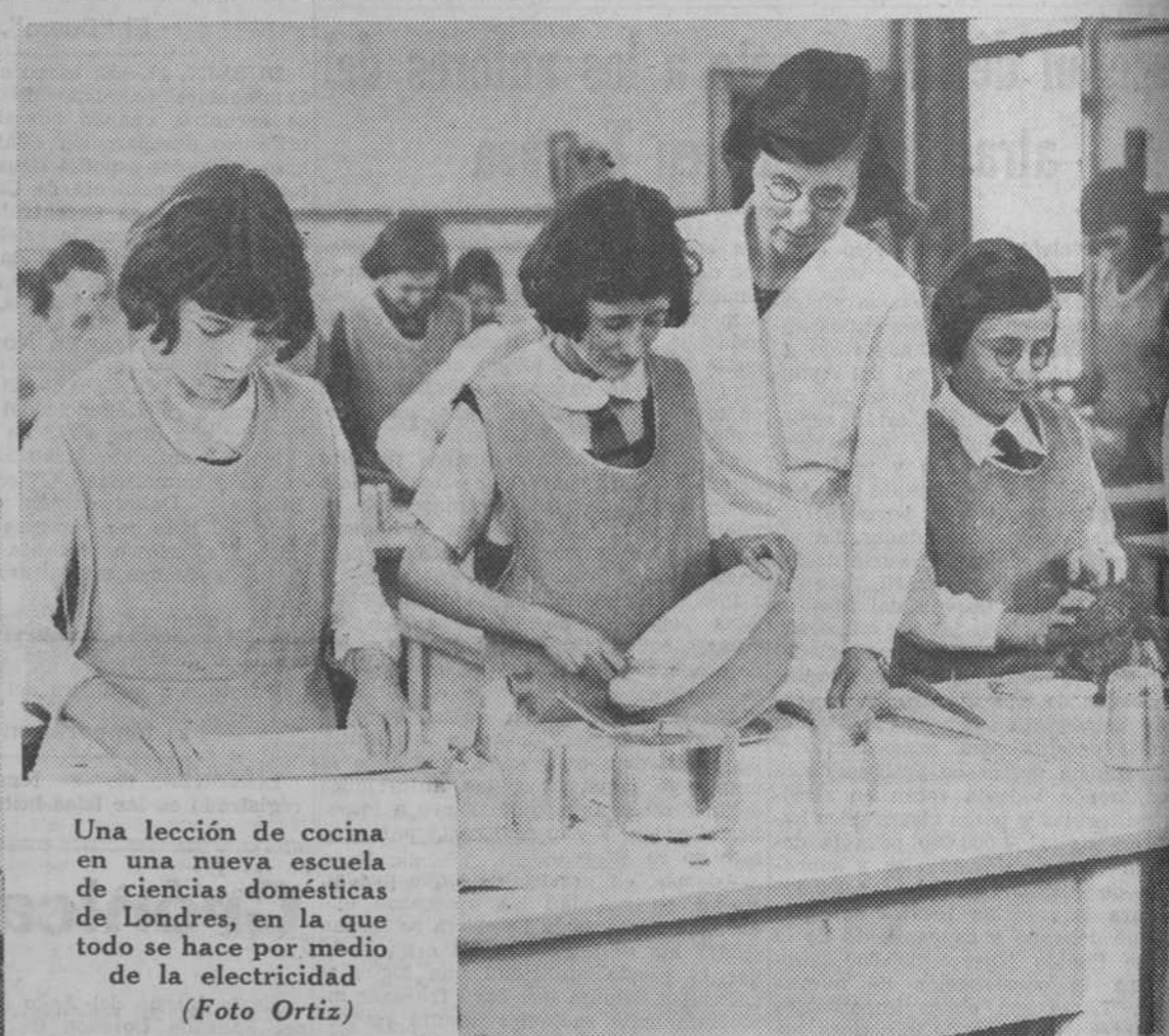
Una lección de cocina en una nueva escuela de ciencias domésticas de Londres, en la que todo se hace por medio de la electricidad