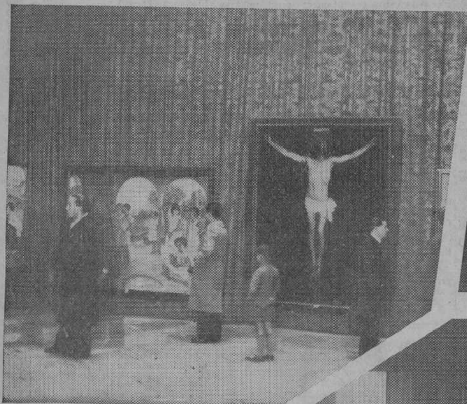
Un rincón de la Exposición nacional de pintura, inaugurado ayer en el ministerio de Instrucción Pública

— o — Concurrentes a la reunión de archiveros y bibliotecarios, celebrada ayer en la Biblioteca Nacional