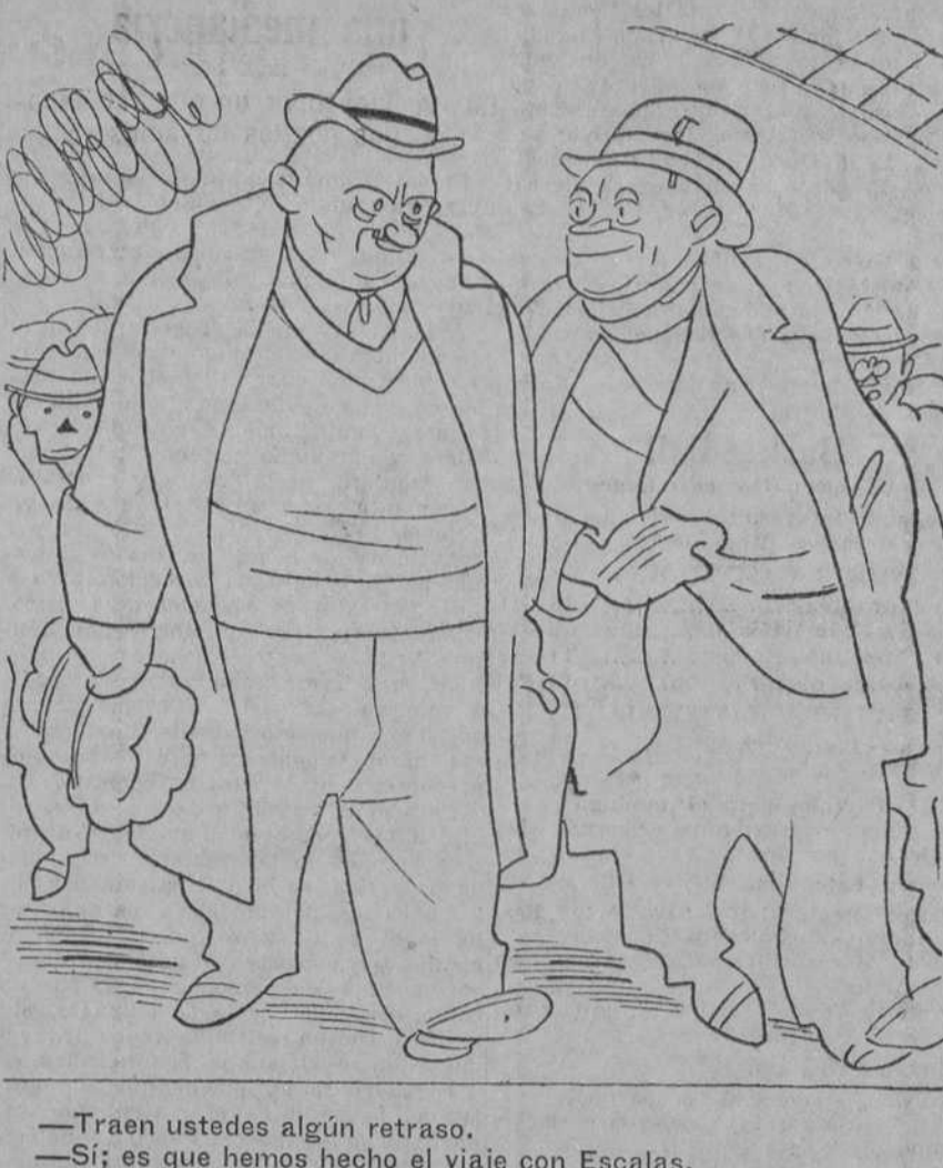
—Traen ustedes algún retraso. —Sí; es que hemos hecho el viaje con Escalas.