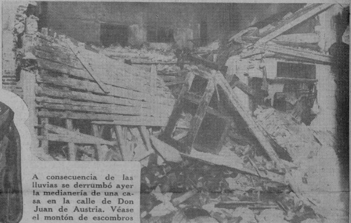
A consecuencia de las lluvias se derrumbó ayer la medianería de una casa en la calle de Don Juan de Austria. Véase el montón de escombros