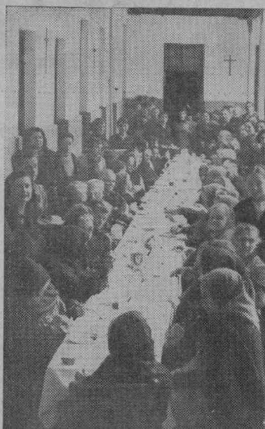
El día de Navidad, las ancianas pobres de Valencia fueron obsequiadas con una comida que les sirvieron distinguidas jóvenes

— o — Siguiendo la costumbre, los industriales valencianos aguzan estos días su ingenio para presentar sus escaparates con gran espectáculo. He ahí «los tres cerditos» jugando a las cartas