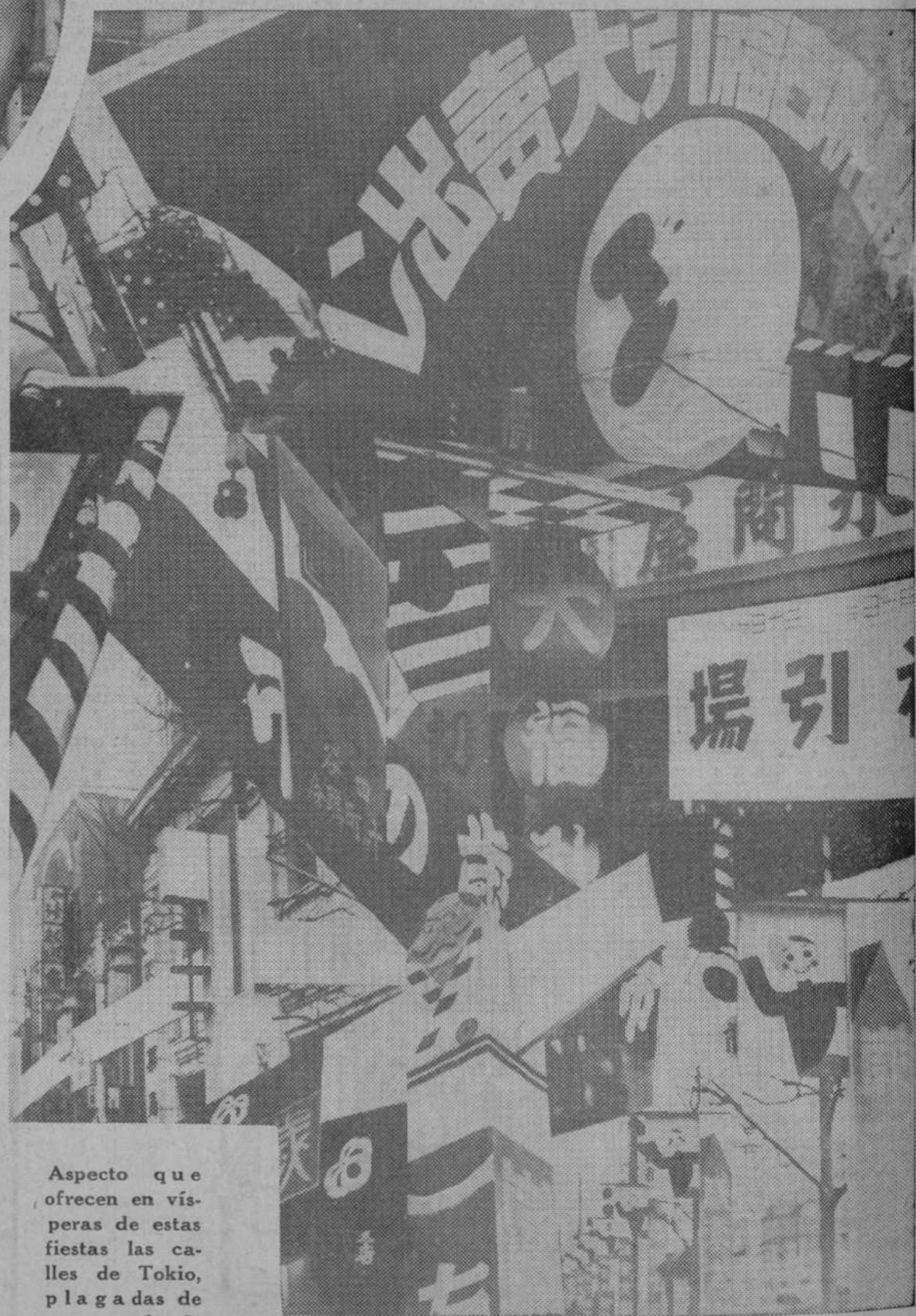
Aspecto que ofrecen en vísperas de estas fiestas las calles de Tokio, plagadas de propaganda de artículos para el Año Nuevo