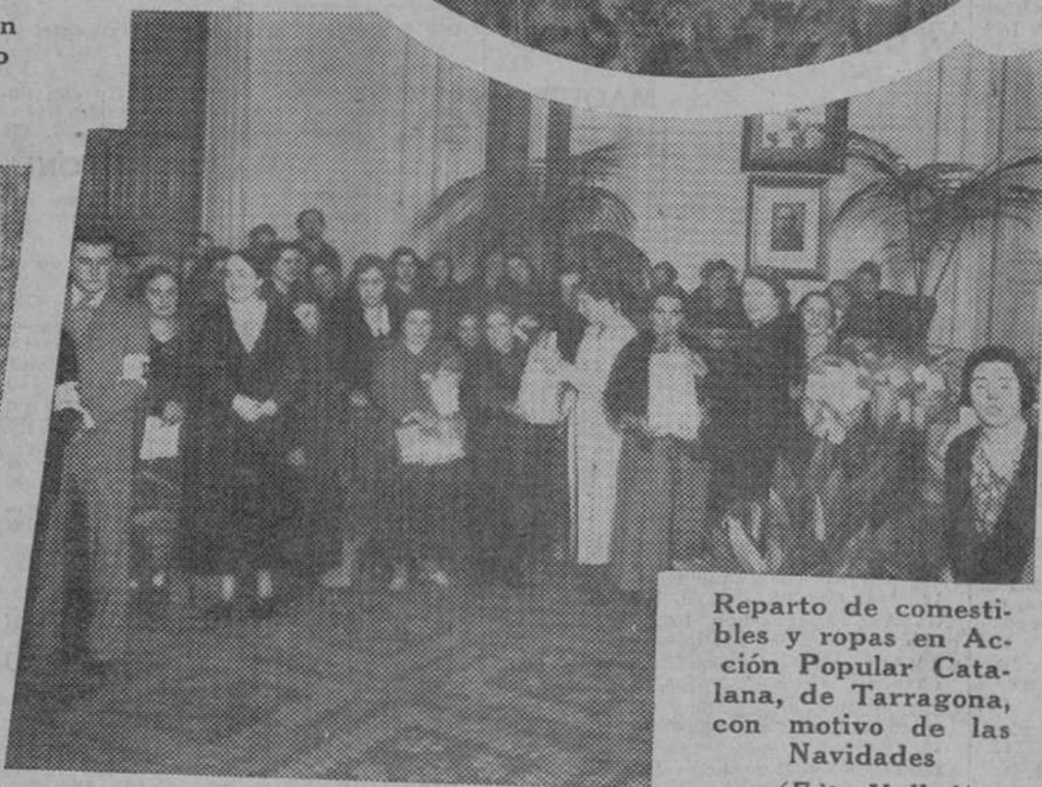
Reparto de comestibles y ropas en Acción Popular Catalana, de Tarragona, con motivo de las Navidades