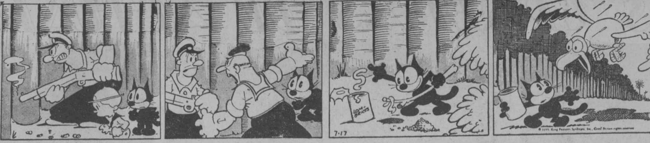
—No hay manera de que le entre una bala.