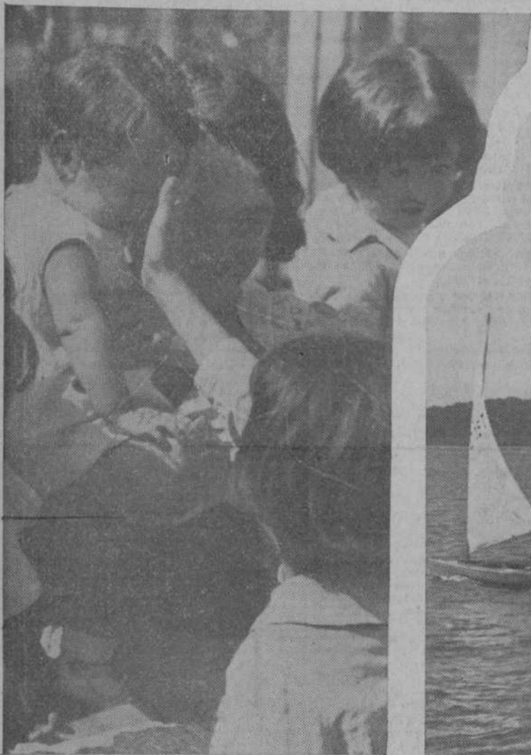
Los pequeños de las colonias escolares de Montseny han regresado a Barcelona, donde las madres aguardaban su vuelta con ansiedad