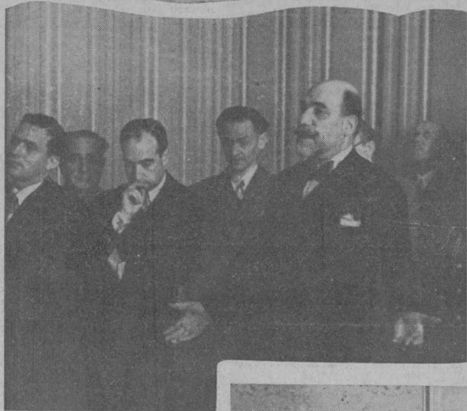
Varios ministros del nuevo Gobierno tomaron ayer posesión de sus Departamentos. Arriba: los ministros entrante y saliente de Marina, señores Rahola y Royo Villanova, durante los discursos que pronunciaron. A la derecha: el ministro saliente de Justicia, señor Casanueva, y el nuevo ministro de Trabajo y Justicia, señor Salmón, rodeados por el personal del Departamento