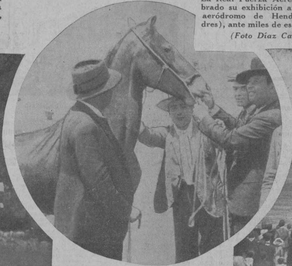
Una escena, de las más frecuentes, tomada en la Feria de Otoño que se celebra en Córdoba