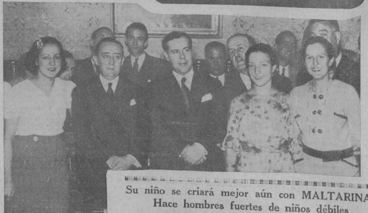
Su niño se criará mejor aún con MALTARINA. Hace hombres fuertes de niños débiles