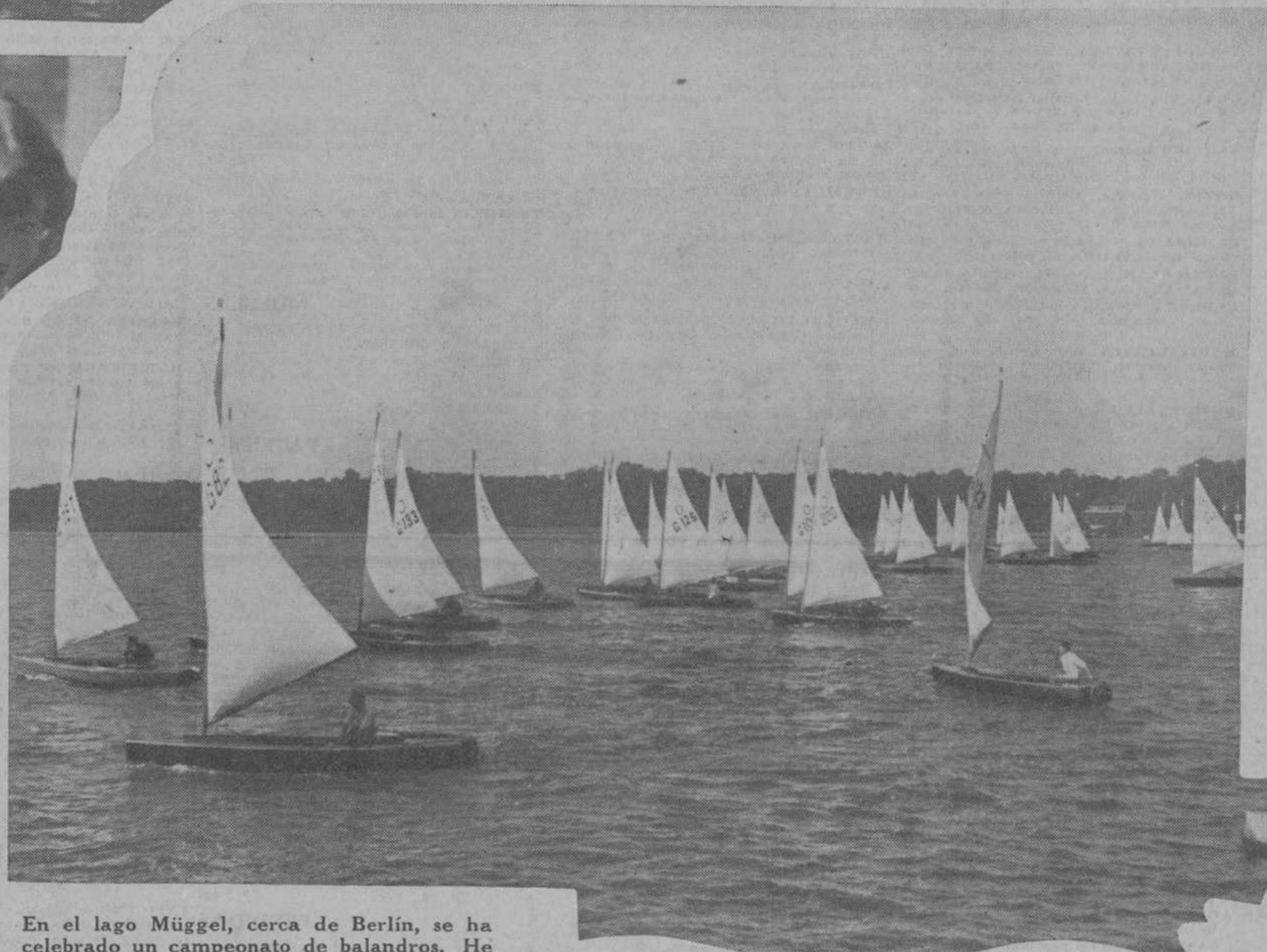
En el lago Müggel, cerca de Berlín, se ha celebrado un campeonato de balandros. He aquí el momento de la salida