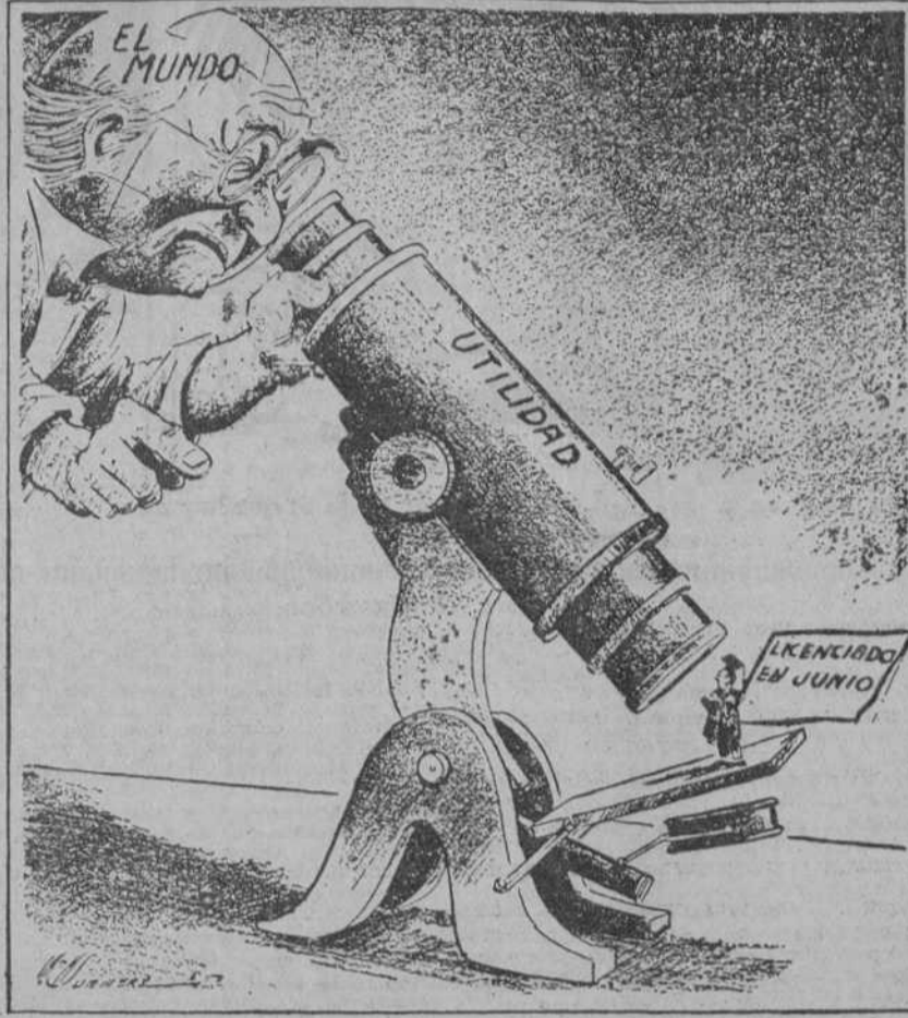
—Veamos si con este microscopio...