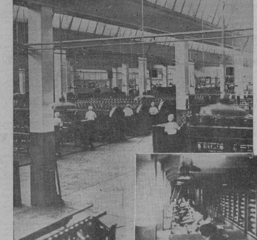
Una gran fábrica textil en el Japón. El perfeccionamiento de las máquinas es tal, que sólo se emplean para alimentarlas a unas cuantas jóvenes obreras

cesidad de nuevas locomotoras. Las encomiendan a uno de los cuatro o cinco señores feudales, según un modelo y un precio determinados. Ingenieros especialistas descomponen entonces la locomotora pedida en el mayor número posible de piezas sueltas. Los pequeños industriales que trabajan en talleres familiares son reunidos y se les explica la calidad y la cantidad de las piezas que hay que hacer. Eligen las que les convienen, entienden los instrumentos que tienen los que piensan adquirir. La mayor parte de las veces, en comandita con una de las grandes firmas del país. La entrega de todos los pedidos queda centralizada en la fábrica de conjunto. Esta reconstitución del trabajo en serie con plan familiar permite obtener precios que son de un diez a un veinte por ciento inferiores a los de las grandes fábricas.