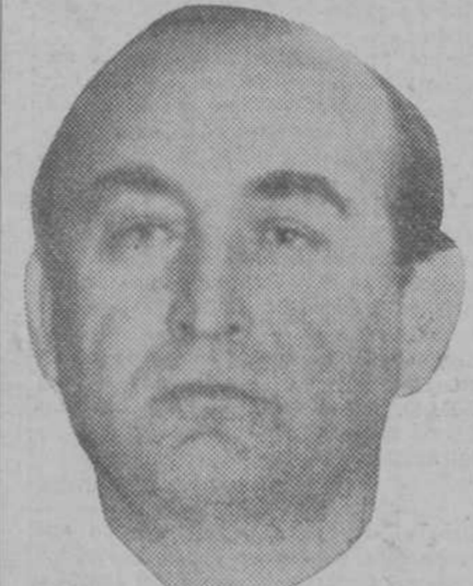
Gombos, jefe del Gobierno de Hungría

El representante húngaro termina rechazando las acusaciones de la Pequeña Entente, las cuales constituyen, a su modo de ver, una maniobra política, expresando su confianza en la alta justicia de los miembros del Consejo de la Sociedad de las Naciones.