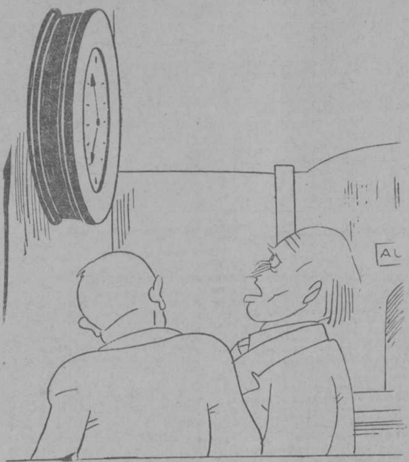
-En vista de las circunstancias, he tenido que traer este ro- loj a Caja.