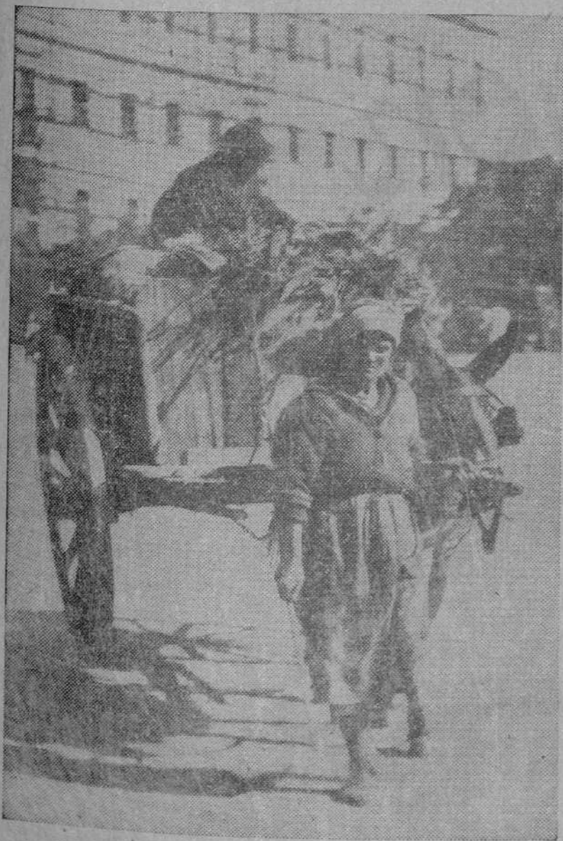
La ciudad está abastecida. Estas escenas que reproducimos disipan todos los temores que padieran haber. Los mercados ofrecían ayer ese aspecto de animación y las medidas del Gobierno articulan con precisión absoluta todos los servicios