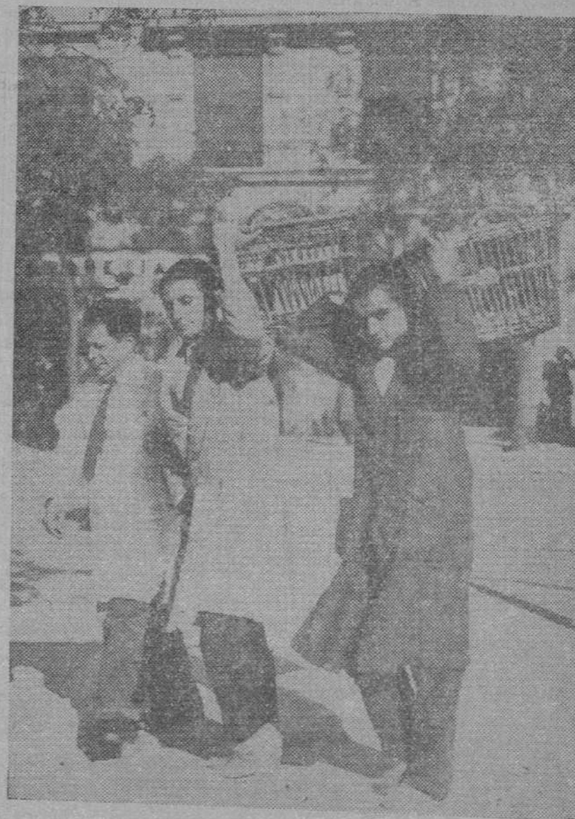
Las calles recuperan su vida propia. Los "paqueos" con que los revoltosos ladraban al aire su fracaso no sincronizan ya la película triste de la revolución. Madrid ha recobrado también su voz antigua, que acompaña de nuevo a estas escenas populares