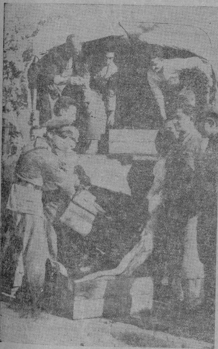
Madrid, que ha vivido en pie sus días de fiebre, siente hoy como una trasfusión de vida, el entusiasmo renovado de sus habi-