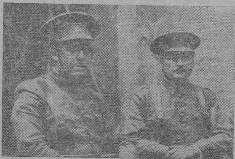
cio, su actuación ha sido igualmente eficaz y gloriosa. No caben distinciones en el recio entusiasmo de la fuerza pública. Ella ha sido en esta nueva reconquista de la unidad de España el símbolo del sentimiento nacional, enardecido por una flagelación cobard-