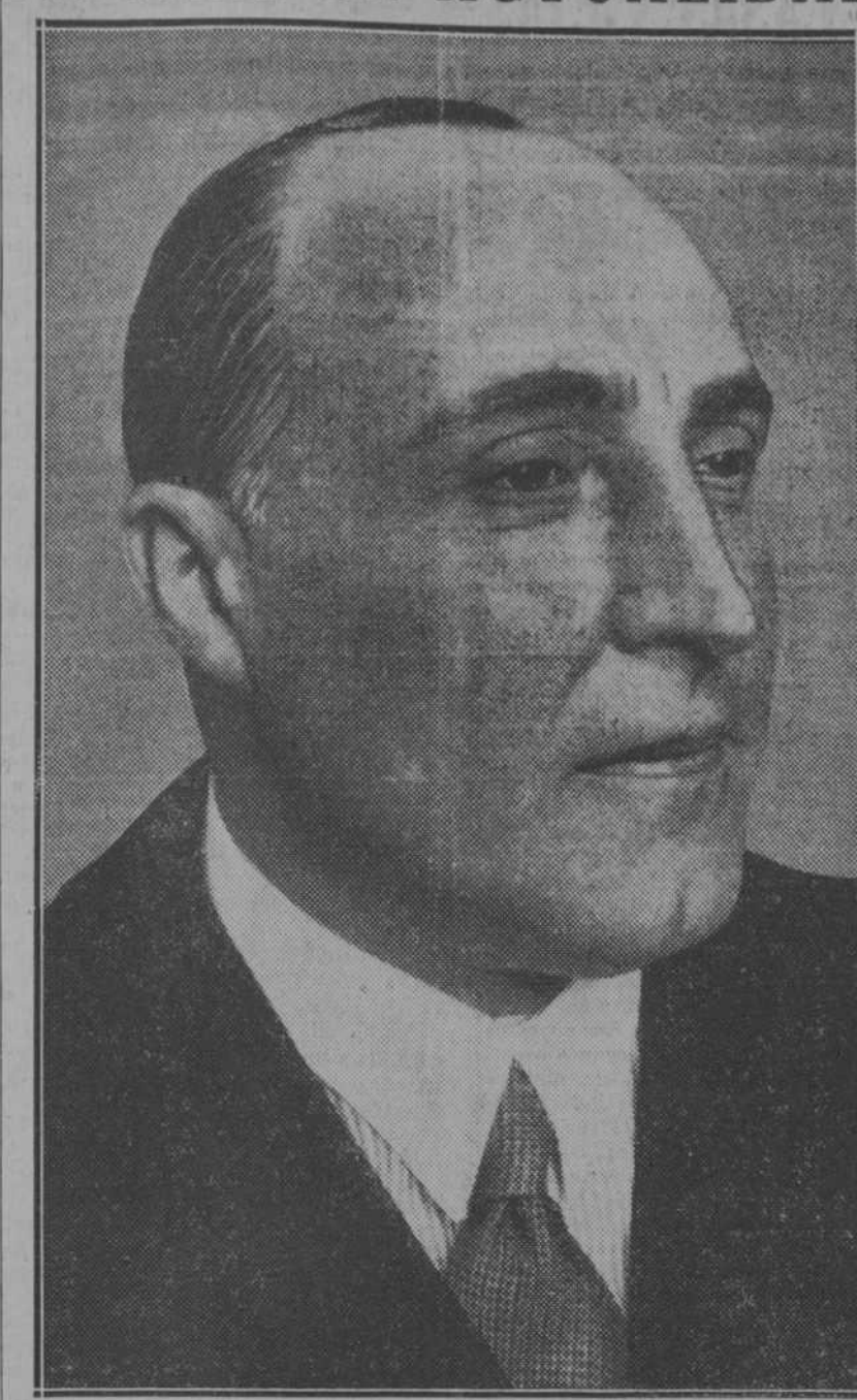
El nuevo subsecretario de Estado, señor Aguirre, que tomó ayer posesión de su cargo