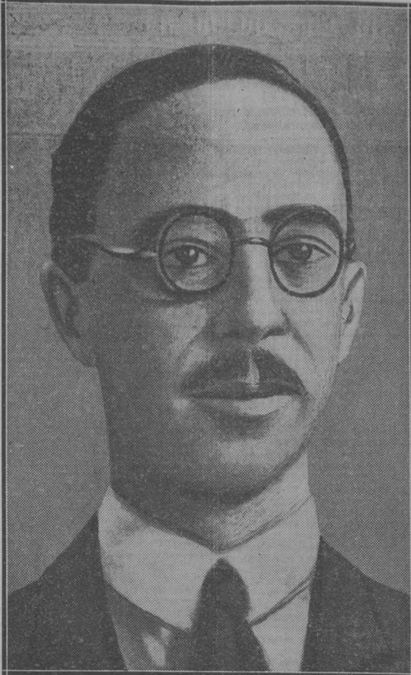
El subsecretario de Negocios Extranjeros italiano, Suvich, que se halla en Londres con objeto de conferenciar con su colega británico acerca del problema del desarme

izquierdistas de Madrid. Y tan convencidos están de ello, que se han fijado con profusión carteles anunciando este propósito de proclamar la República catalana.