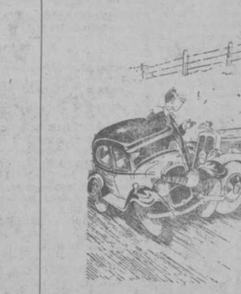
—¿Pero no han oído ustedes mi bocina? —¿Lo ves, Matilde? ¡Y tú empeñada en que era un cuco!