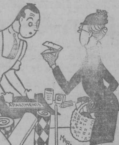
—¿Podría usted cambiarme esta ratonera por algún otro artículo? Ya ha caído el ratón que había en casa.