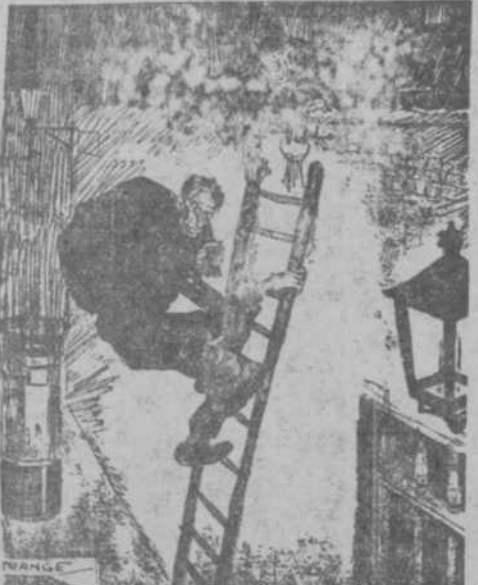
—¡Maldita sea! Algún canalla ladrón nos ha robado el "auto".