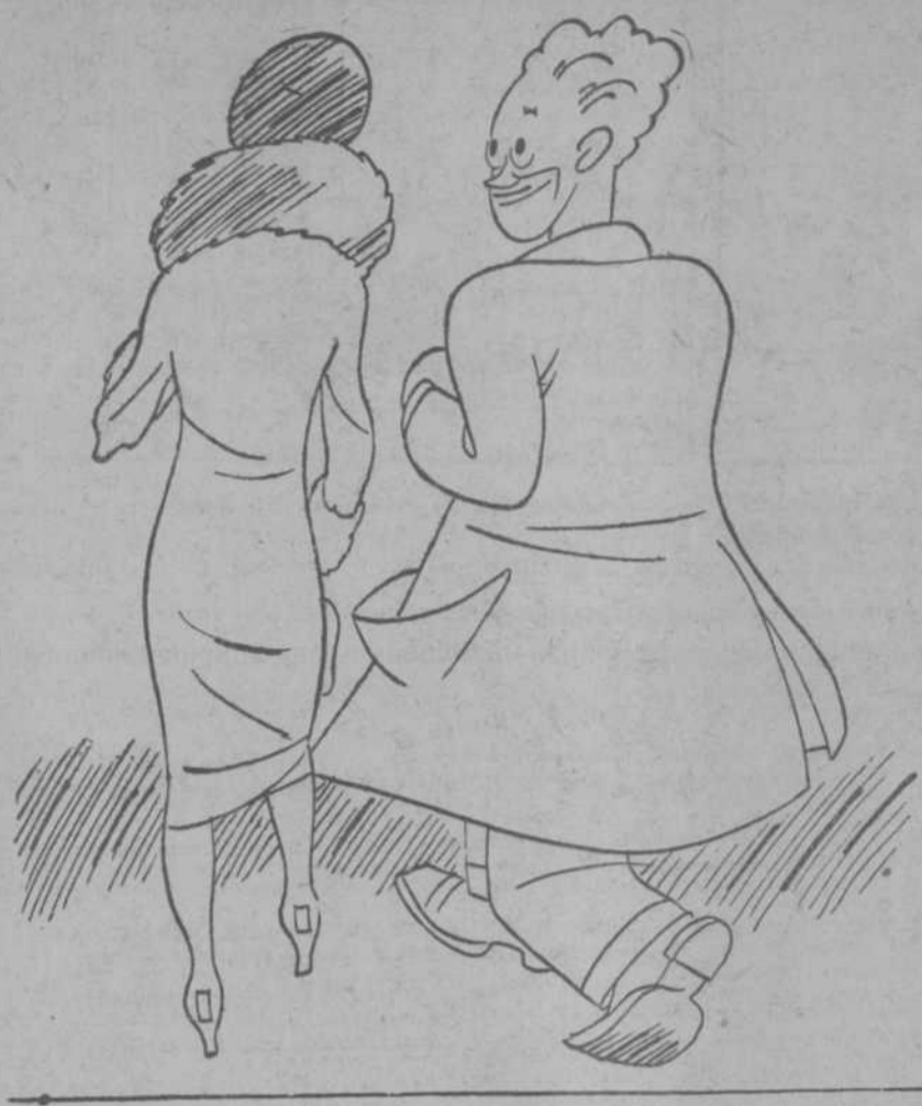
—La ví a usted ayer por vez primera, y su efigie ha quedado impresa en mi corazón. —Me extraña mucho; hay huelga de Artes Gráficas.