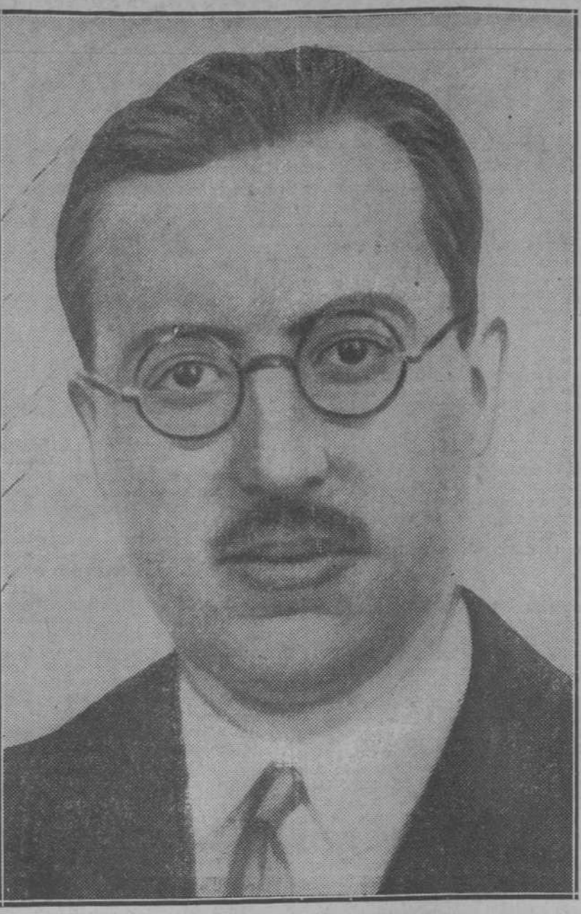
Don Alfredo Zabala, abogado del Estado, nuevo gobernador del Banco de España

(Crónica telefónica de nuestro corresponsal) BARCELONA, 9.—El ataque del martes en la Via Layetana, y el perpetrado durante la madrugada última en la casa de los condes de Sert, tiene desconcertados a los policías de la Generalidad. Todo hace presumir que si no intervienen pronto los agentes de carreteras pertenecientes a la plantilla del Estado, estos delitos quedarán impunes, como viene ocurriendo con cuantos actos delictivos se perpetran en Cataluña. Las cosas se agravarán todavía más cuando llegue el primero de abril, y sean trasladados al resto de España los policías de carrera, que, como es sabido, no quieren seguir a las órdenes del Gobierno de la Generalidad. Entonces los ciudadanos barceloneses quedaremos a merced de las bandas de pistoleros y atracadores, sin más defensa que la de los "escamots" elevados a la categoría de guardadores del orden, ayunos de todo conocimiento técnico, sin confidentes, desconocedores de los maleantes habituales, con los ficheros incompletos y desorganizados. No hay nadie, ni los mismos consejeros de la Generalidad, que abrigue el menor optimismo respecto a la situación de Barcelona en manos de los "escamots". La ciudad se prepara a hacer frente al "gransterismo", que amenaza adquirir proporciones fantásticas. En los