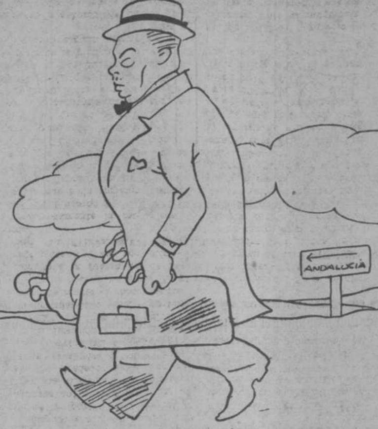
"Sevilla, presidencia del Consejo, cuán atormentais mi mente."