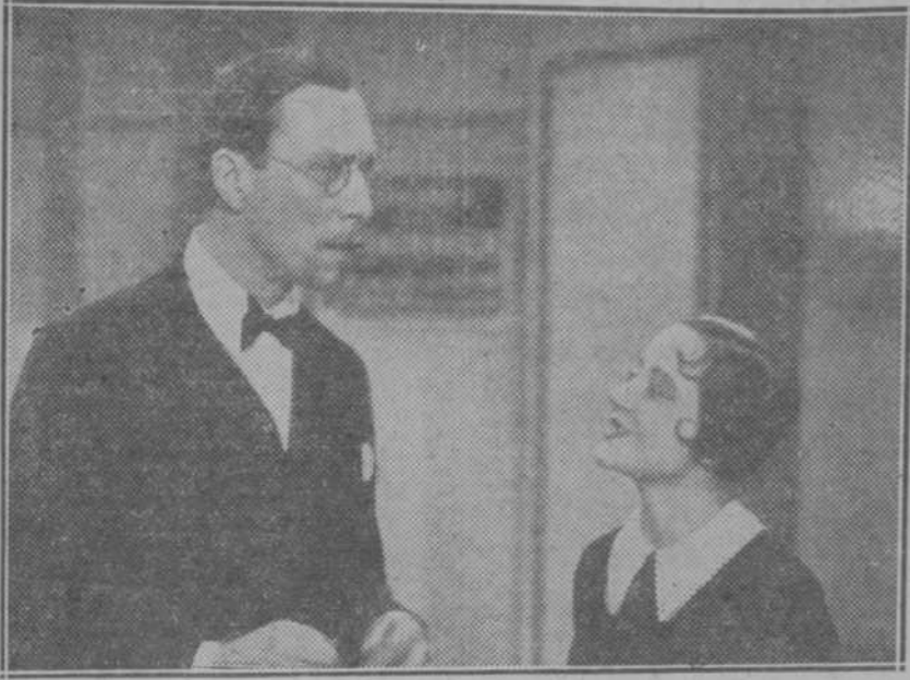
El gran actor Louis Jouvet Paulet en su creación de "Topaze", la formidable comedia que presenta pasado mañana lunes, el Cine PROYECCIONES.