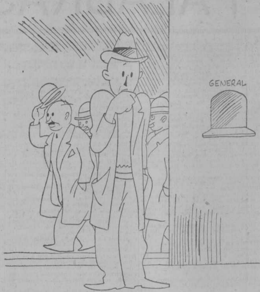
—Pues, señor; tres horas hablando, para decir tan poco. ¿Qué le costará a este hombre poner un telegrama?