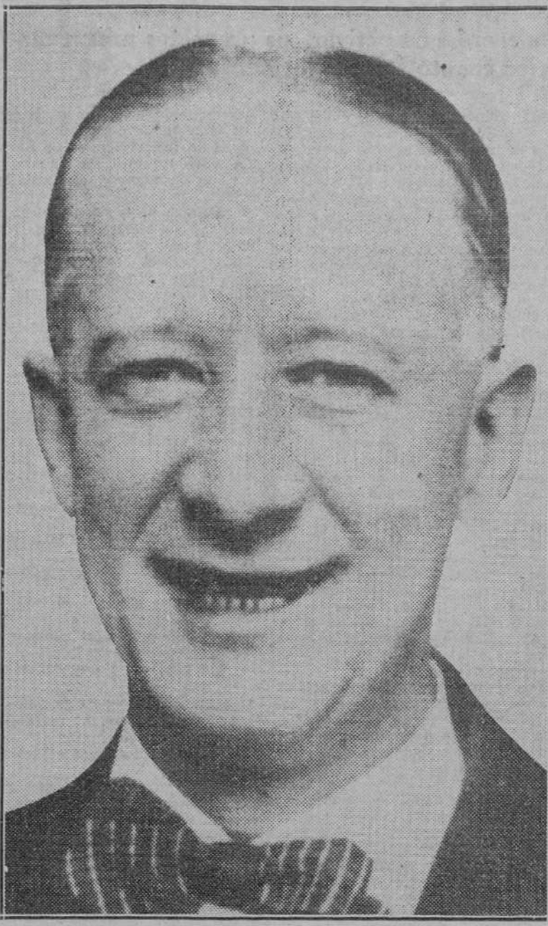
Mr. Al. Smith, ex gobernador de Nueva York y ex candidato a la Presidencia de los Estados Unidos, que se ha declarado contrario a la política de Roosevelt