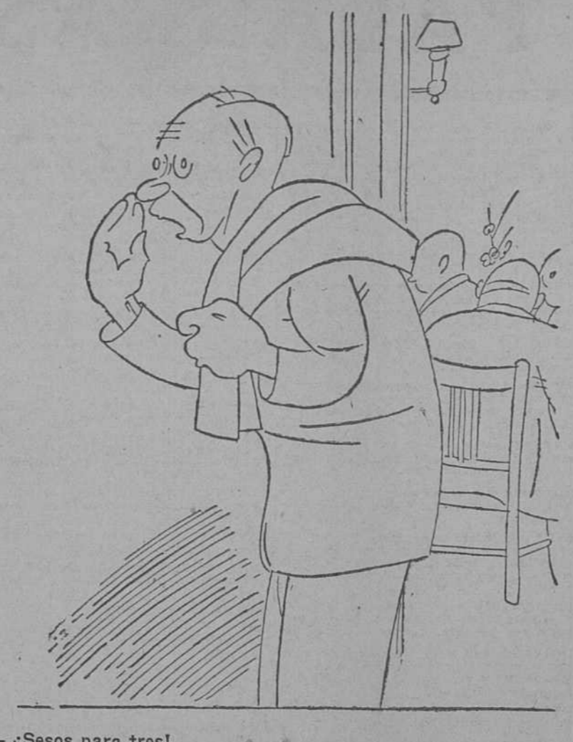
— ¡Sesos para tres!