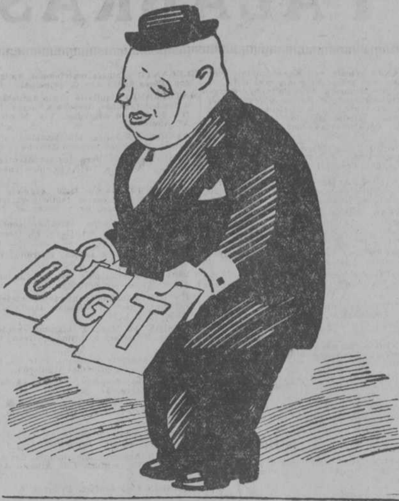
Las letras que se creen que van a vencer.