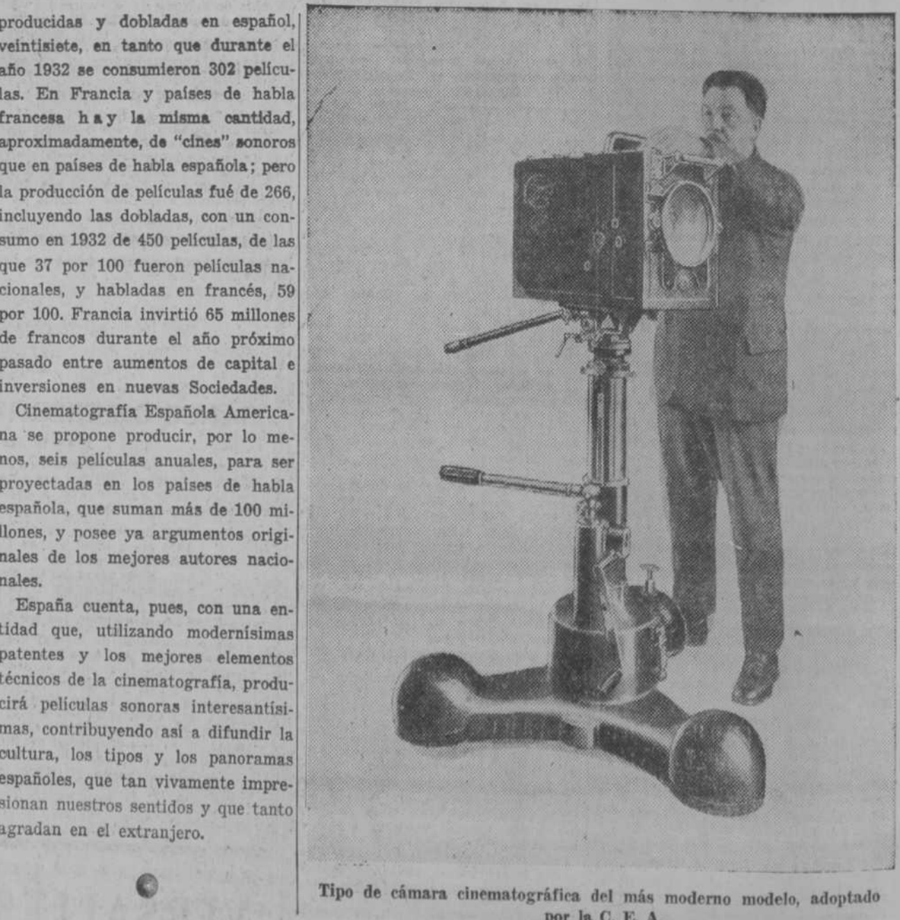
Tipo de cámara cinematográfica del más moderno modelo, adoptado por la C. E. A.