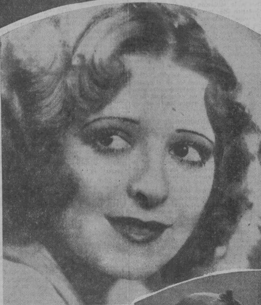
Clara Bow, deliciosa intérprete del "film" "Sangre roja", que mañana estrena el Cine Alkazar

táculo, por la cantidad y multiplicidad de elementos que se han sumado a su realización. En una de las escenas se ven más de 600 presos en el patio de una cárcel. En otra, una cantidad casi igual de soldados que regresan de la gran guerra. Luego, a lo largo de este "film" extraordinario, son muchos los minutos que transcurren viendo cómo se mueven en escena con