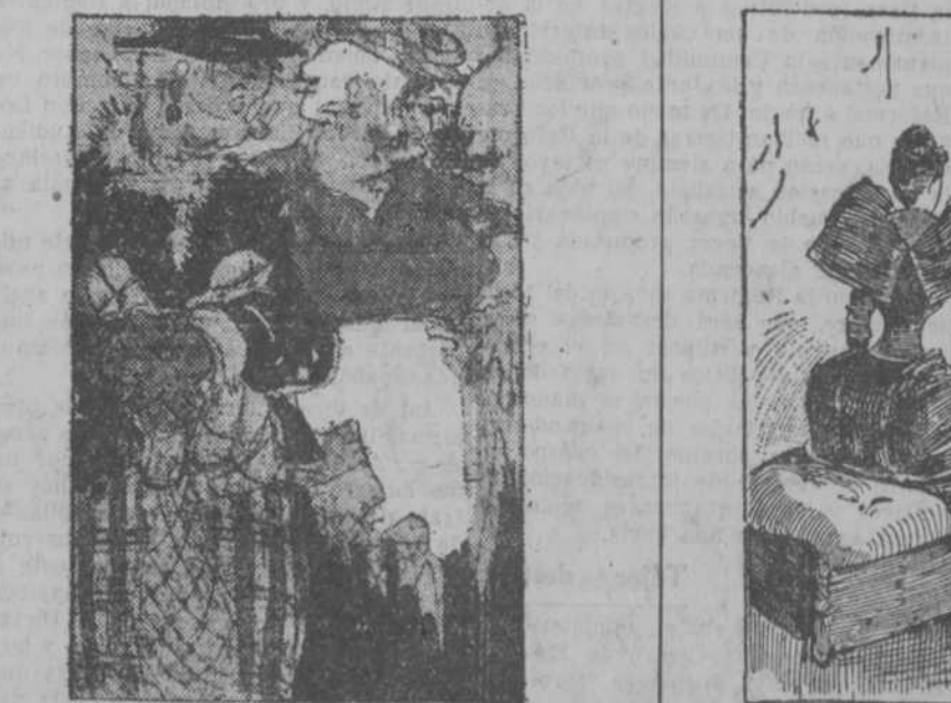
—Es la primera vez que veo sonreír a su marido desde que empezó a trabajar.