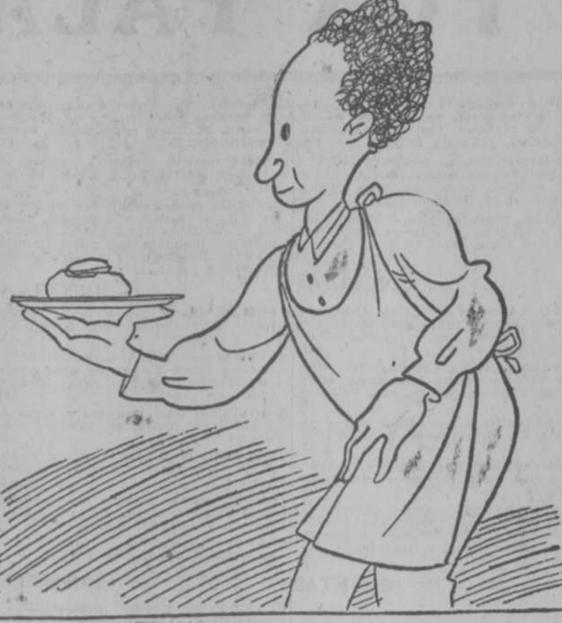
El pastelero de Madrigal.