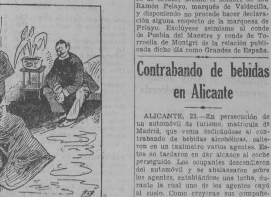
—No conoce usted a mi hermano Jorge? Es por completo distinto de mí.