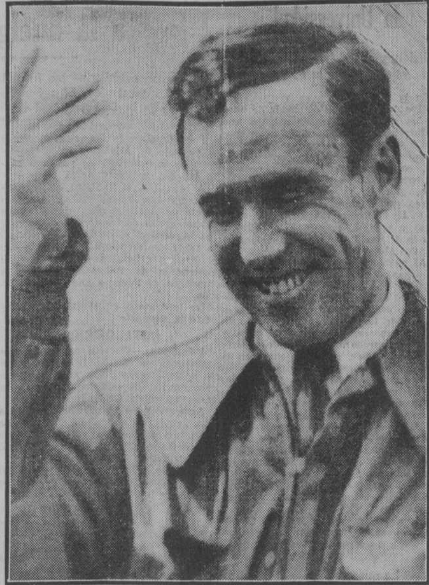
El aviador Mollison, que ha atravesado el Atlántico en dieciocho horas. La figura de Mollison vuelve a tomar relieve, al cubrir la distancia de África-América (2.000 millas), en dieciocho horas.