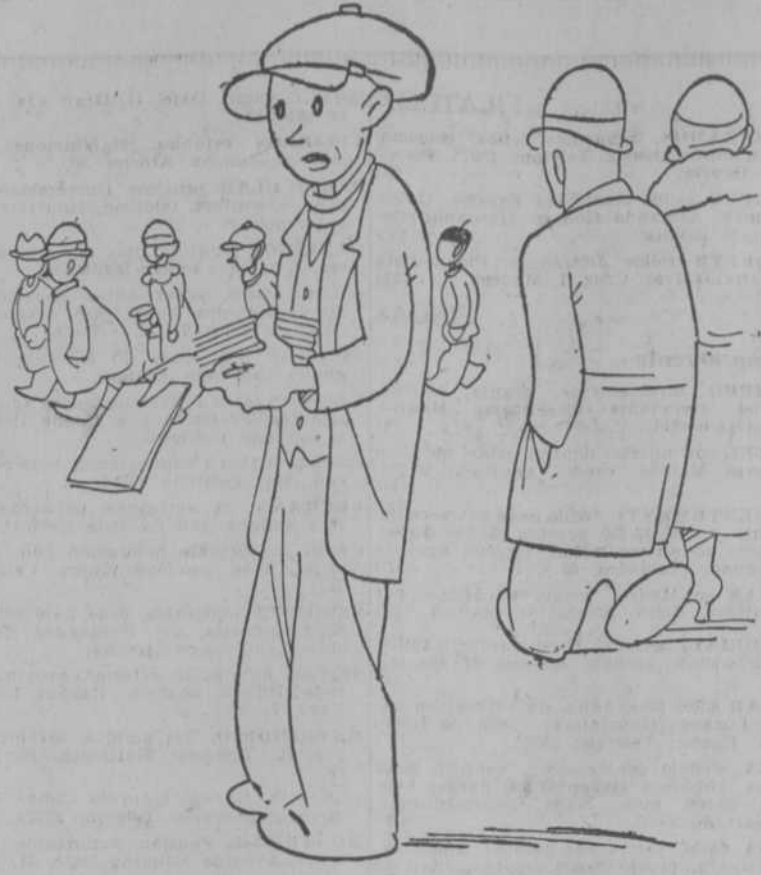
—El artículo 26! Corregido y aumentado!