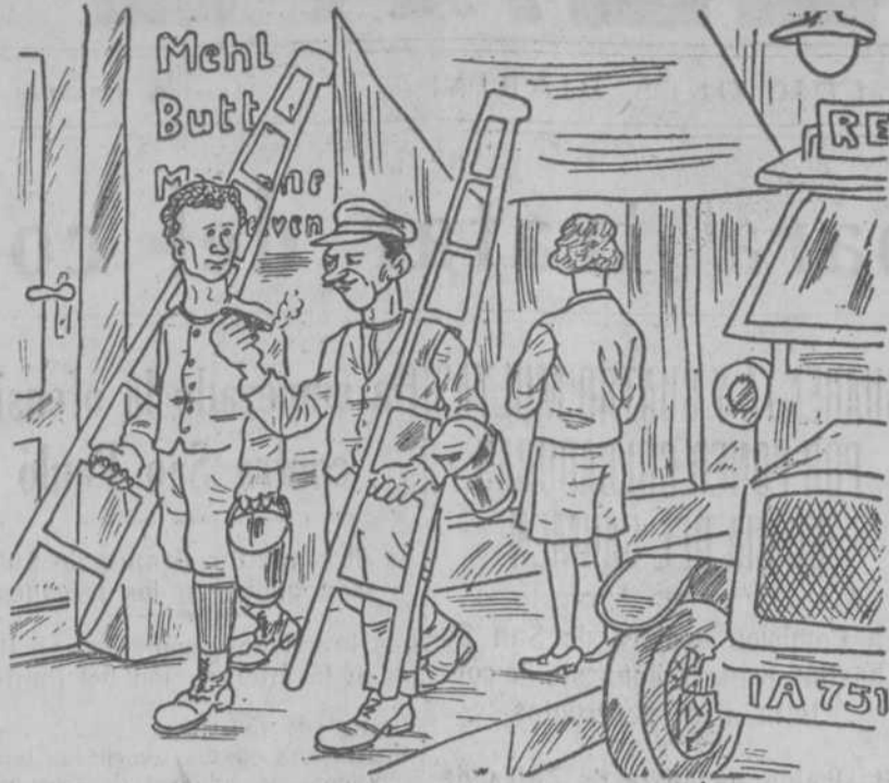
—Mira, Hitler es como este cigarro: una cubierta marrón y todo acaba en humo.