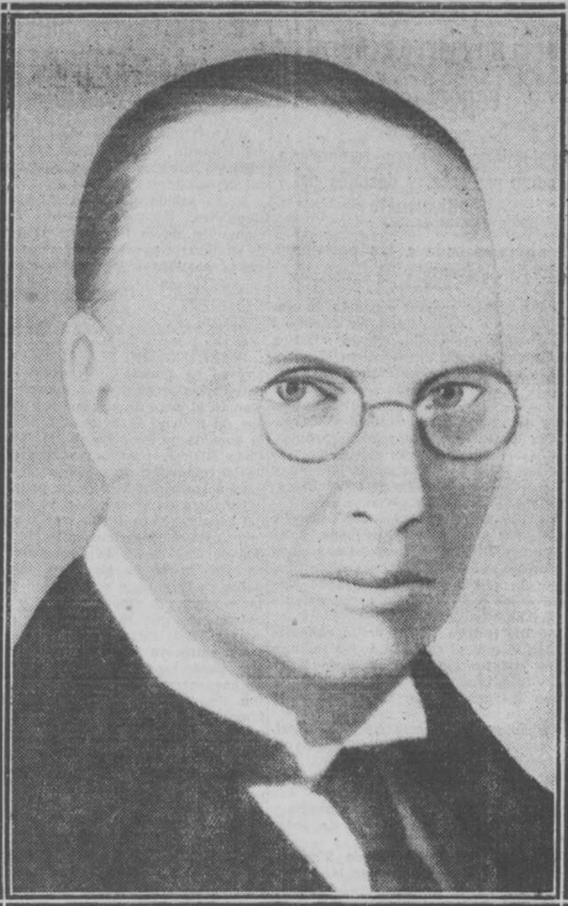
Bennett, jefe del Gobierno del Canadá y presidente de la C. Imperial