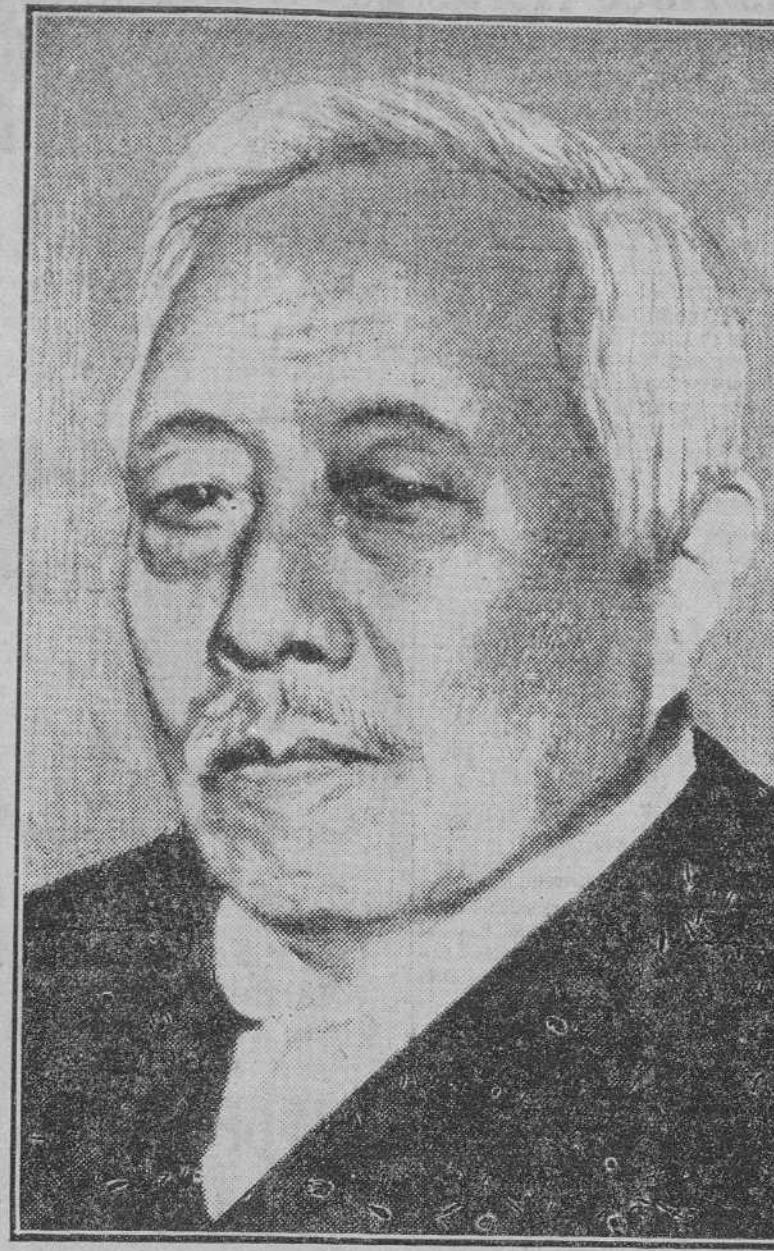
El almirante Saito, nuevo presidente del Consejo de ministros del Japón

Para hacer frente a la difícil situación del país, se ha escogido a un anciano de setenta y tres años, famoso más que por sus dotes de marino por su reputación de prudencia y de tacto. El almirante Saito representó a su país en la Conferencia del Desarme de 1927 en Ginebra, y antes había sabido vencer como gobernador de Corea un momento casi angustioso. Es hombre de tendencias liberales.