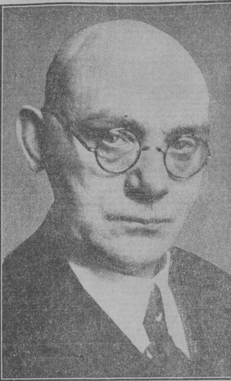
Ernest Wittmaack, que ha sido elegido presidente del Landtag prusiano