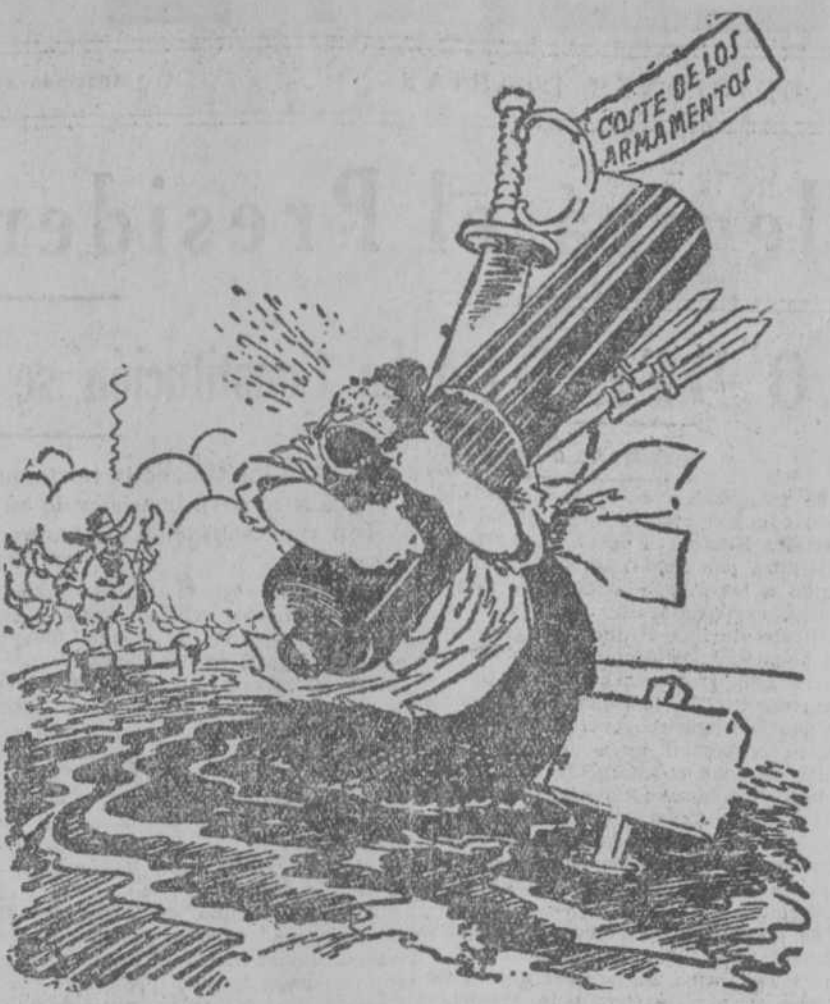
"Si dejaras caer parte siquiera de tu carga, no te hundirías en el fango." ("Philadelphia Inquirer").