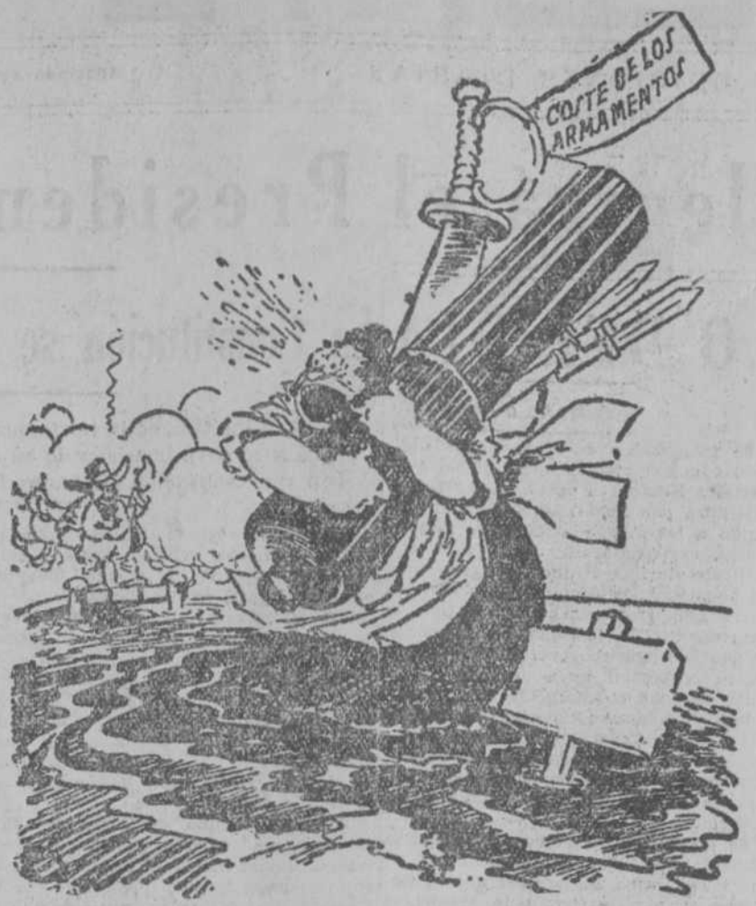
"Si dejaras caer parte siquiera de tu carga, no te hundirías en el fango." ("Philadelphia Inquirer").

Sección a unas palabras del susodicho señor Ortega y Gasset, dichas con su magnífico énfasis habitual, tras el cual, como siempre, no había nada. Y ello en relación con sólo dos artículos. A los otros catorce ni el nadie objetaron lo más mínimo.