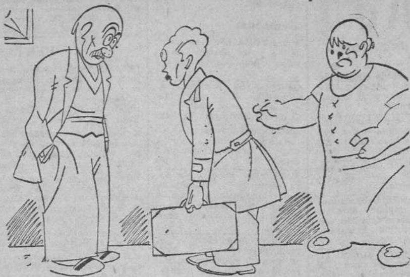
—¿De qué es esa afonía, rico? Tú no has hecho más que escandalizar. —No, no. Es de... estudiar en alta voz.

¿Y el problema de "buscar dinero" para tantas obras. Locales, muebles, libros, instrumentos, personal auxiliar, limosnas, premios, etcétera.