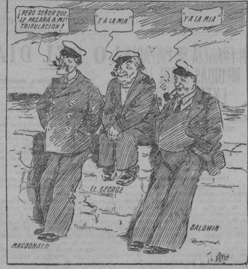
CAPITANES... Y SOLOS