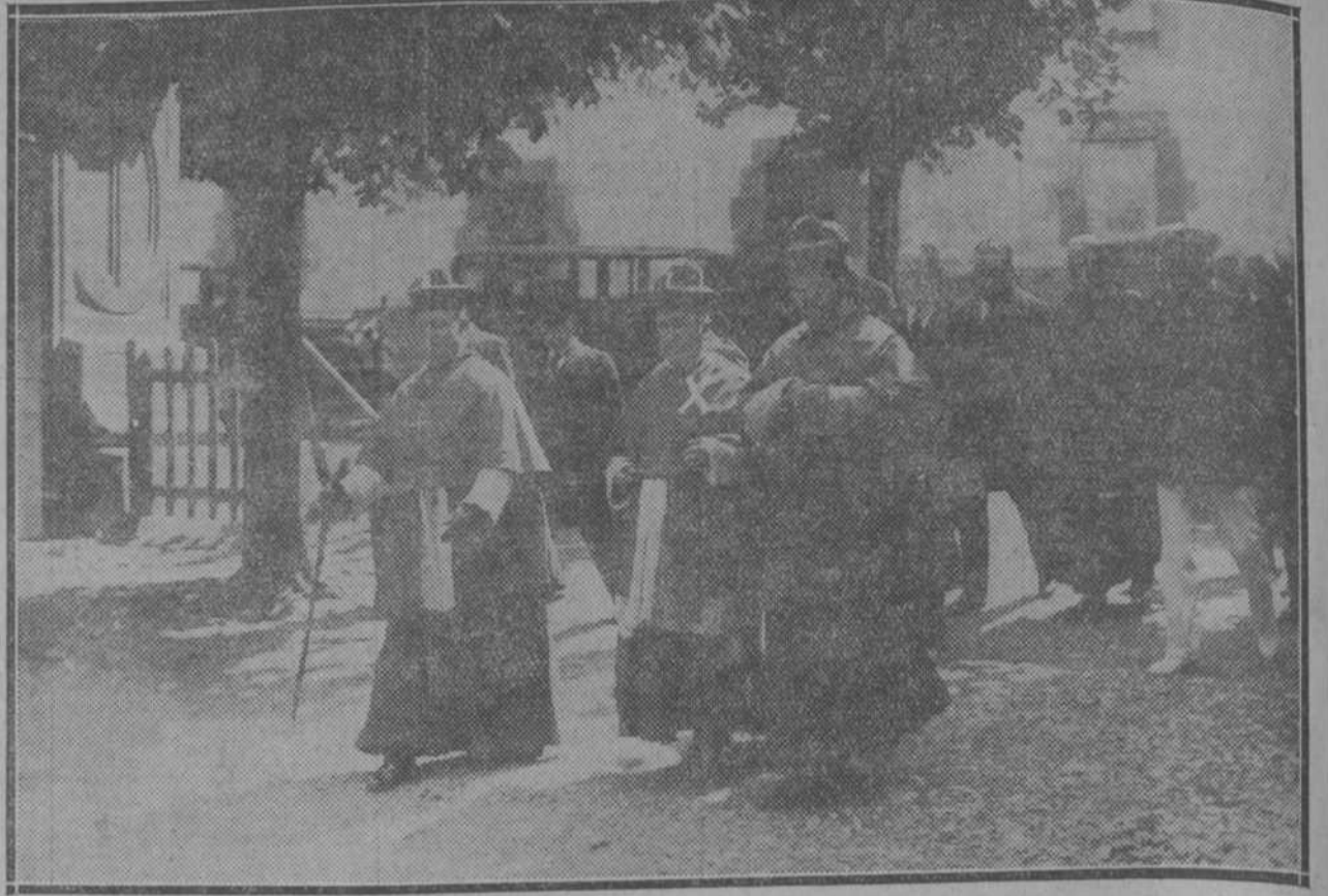
El Arzobispo de Valladolid, doctor Gandásegui, después de la celebración de sus bodas de plata en Begoña. La fotografía nos lo muestra entre los Obispos de Vitoria y de Zamora.