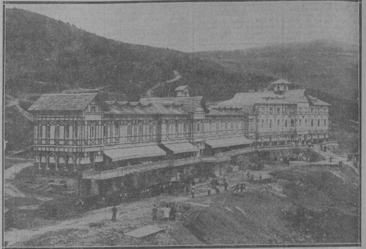
El nuevo Sanatorio Reina Victoria, inaugurado en Bilbao con asistencia de las autoridades