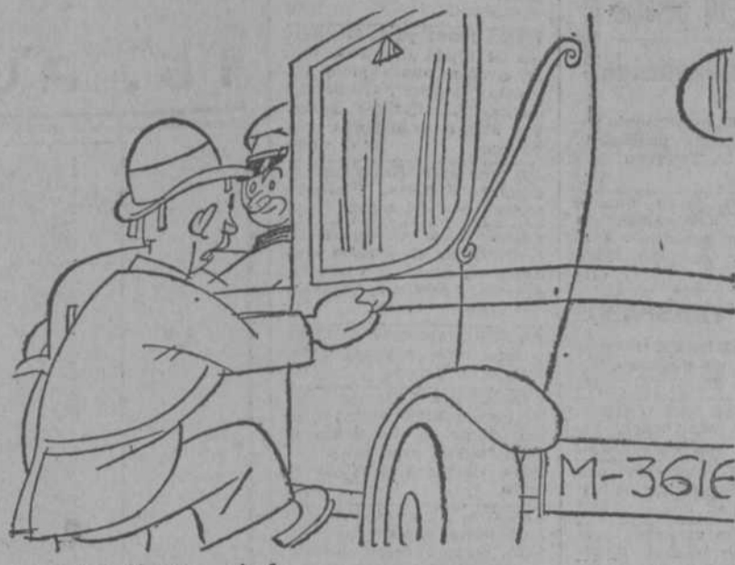
—A las Ventas, chofer. —¿Con propina o con vuelta de campana?