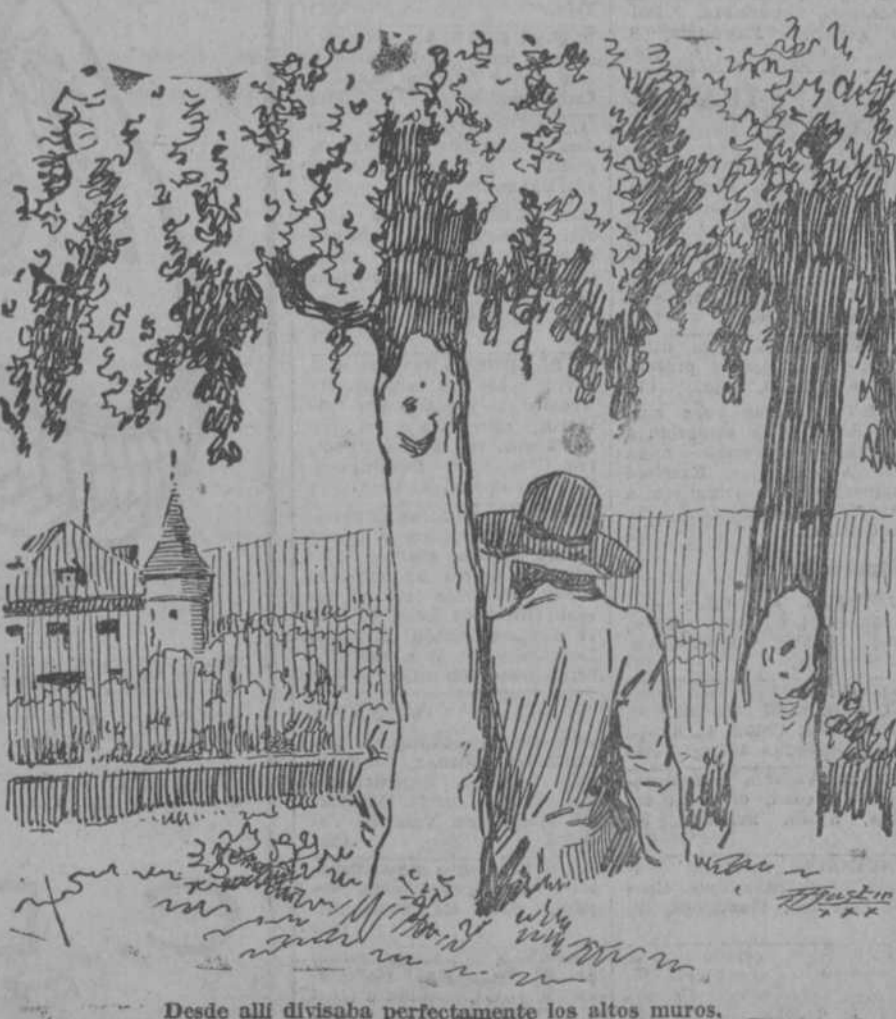
Desde allí divisaba perfectamente los altos muros.

Al cabo de un rato de espera, vió salir del palacio al joven príncipe Enrique, a quien acompañaba, como siempre, su preceptor. El egregio niño atravesó cubriendo la poterna del castillo, pero hubo de detenerse obediente y respetuoso a una indicación del preceptor que, percatado de la transcendencia de su magisterio cuidaba, al mismo tiempo que de cultivar la inteligencia del príncipe, de formar su espíritu en el acatamiento a la disciplina y al orden.