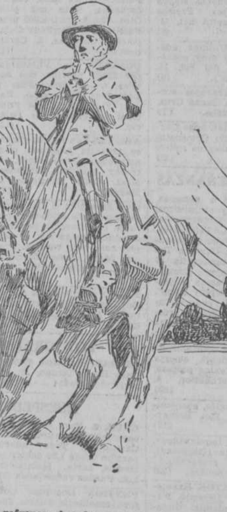
Hubo de refrenar el andar de la bestia.

En La Gravelle se detuvo sólo unos minutos, el tiempo estrictamente necesario para dar de beber a "Júpiter" un cubo de agua de salvado, que a un restaurador excelente para las caballerías, y a las cuatro de la tarde, sin nuevas peri-