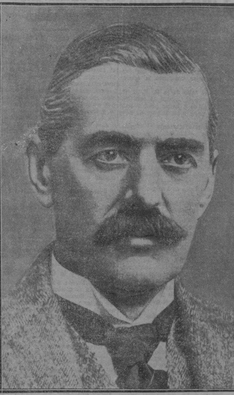
Mister Neville Chamberlain, que ha sido designado jefe de la organización del partido conservador inglés

Mister Neville Chamberlain es hermano de mister Austin Chamberlain, el que fué ministro de Negocios Extranjeros en el Gabinete anterior. Nació en 1869, y se educó en Birmingham. En 1915 fué nombrado lord mayor de esta ciudad. Ocho años después ocupaba el cargo de ministro de Higiene, y en esa cartera desarrolló una labor importante. El fué quien resolvió el problema de la habitación en Inglaterra. En 1928 presentó un proyecto de reforma local, que logró ser aprobado.