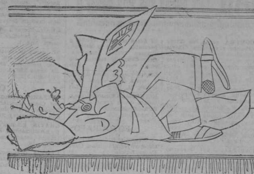
—¡Magnífico, hombre! ¡Magnífico este proyecto de Gran Vida!